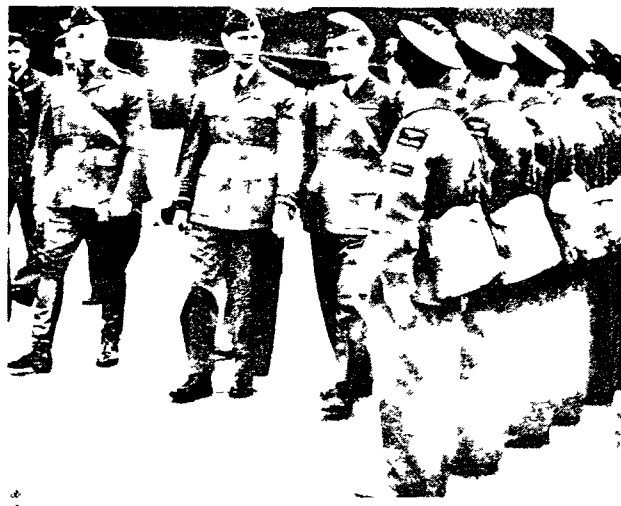
Gen Sikorski i król Jerzy V na inspekcji polskich żołnierzy

Propozycja sojuszu została skwapliwie przyjęta przez napadniętego. W celu stworzenia iluzji zwartości obozu antyhitlerowskiego należało wygasić wszelkie spory między uczestnikami montowanej koalicji. Najpoważniejszym z nich był "spór" jeśli można uzyć tego eufemizmu