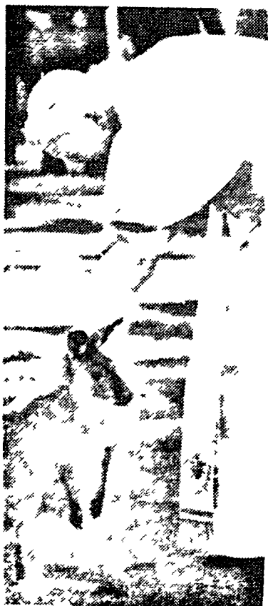
Ojciec Święty w czasie ostatniej pielgrzymki do Australii

Dlatego też wielu ludzi młodych i dobrze wykształconych woli emigrować. Wysoką koniunkturę mają więc w Polsce prywatne lekcje języków obcych i biura tłumaczeń, które sporządzają przekłady świadectw i dyplomów. Ten drenaz mózgow staje się dla Polski kolejnym zagrożeniem