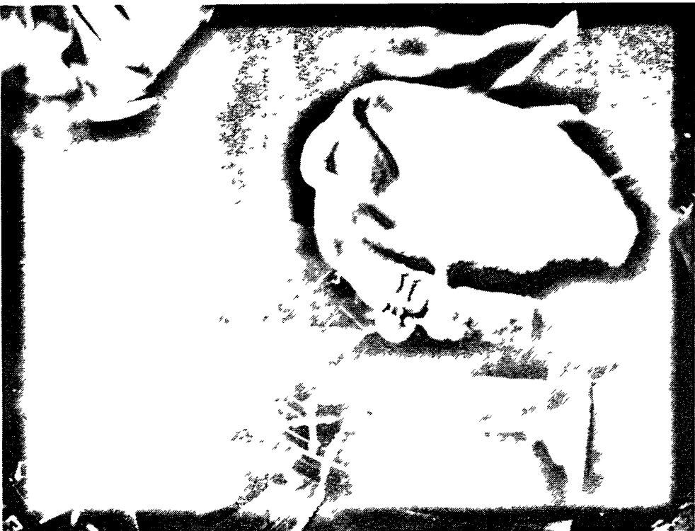
Bron używana przez Adama w Afganistanie i afganckie nakrycie głowy z polskim orzełkiem w koronie pamiątka po ojcu

Ile lat są u was komunisci? - pytali No, 40 lat, odpowiadałem I wy ich nie chcecie? Nie chcemy A ile was jest? 36 milionów Ho, ho! I jeszcze zęście ich nie wygnali? Tłumaczyłem im wówczas najprościej, że w Polsce jest płasko To oni na to, że w