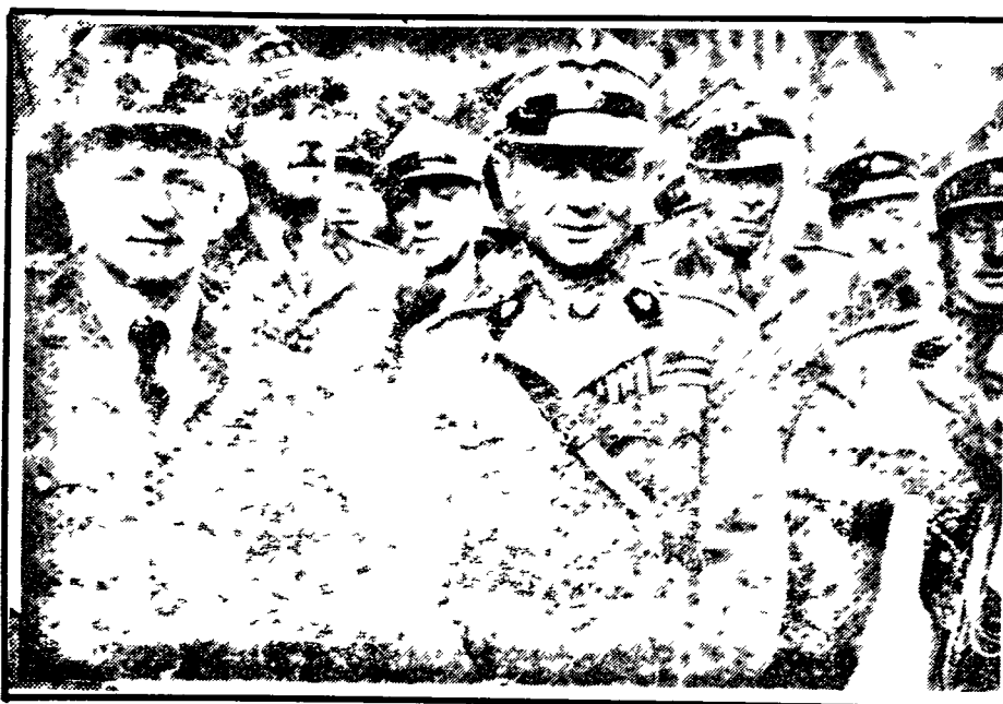
Od góry Gen bryg obs Stefan Sznuke Ottawa 1974

Po znalezieniu się we Francji w lutym 1940 płk Sznuke zostaje mianowany referentem lotnictwa w Ministerstwie Spraw Wojskowych w Paryżu a po ewakuacji do Wielkiej Brytanii w lipcu tegoż roku generał Sikorski mianuje go Szefem Sztabu Lotnictwa. Na tym stanowisku odgrywa decydującą rolę w czasie Bitwy o Wielką Brytanię (od 8 sierpnia do 31 października 1940) w której wzięły udział polskie dywizjony myśliwskie Nr 302 i 303 i polscy piloci przdzielni do jednostek brytyjskich. W bitwie tej Niemcy stracili 1 733 samolotów a Brytyjczycy 733. Polacy zestrzelili 203 samolotów na pewno 35 prawdopodobnie i uszkodzili 36. Brytyjski minister lotnictwa Sir Archibald Sinclair tymi słowami określił wkład polskich lotników do zwycięstwa