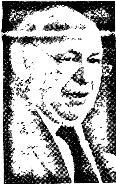
Jerzy Urban, ujawniając sprawę płk Kuklińskiego przyznał się do wielkiego kłamstwa

Amerykanie w odpowiedzi stwierdzili, że zarzut ten jest sfabrykowanym oszustwem