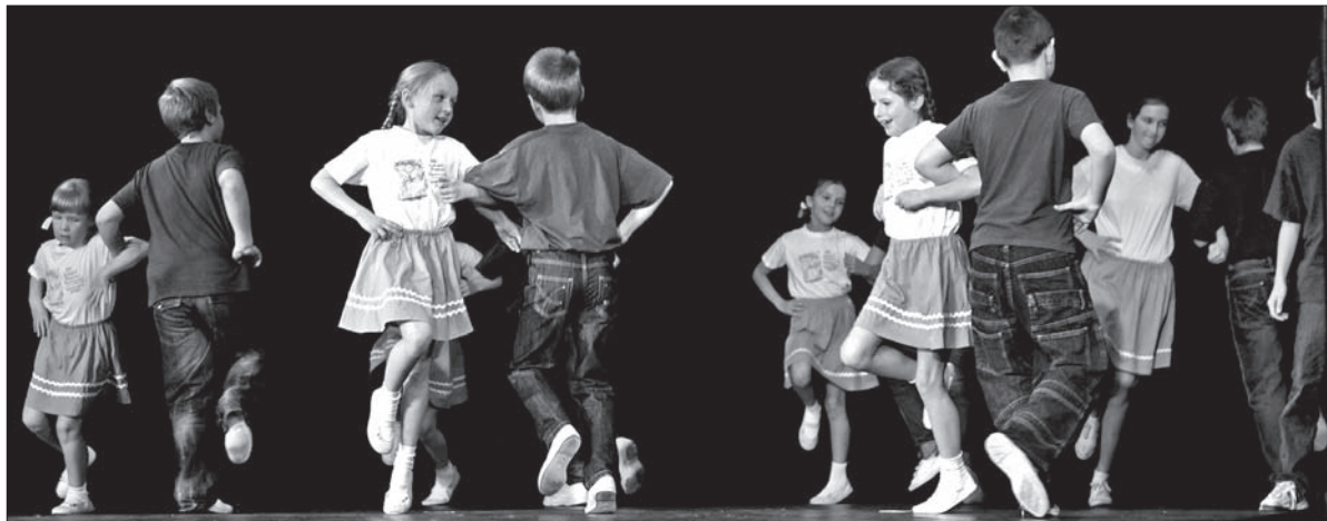
Na scenie uczniowie PSP w Błędowicach.