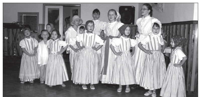
Zespół „Nowa Skotniczka” zaprezentował w Gródku część programu pt. „Jak to było na miedzy”.