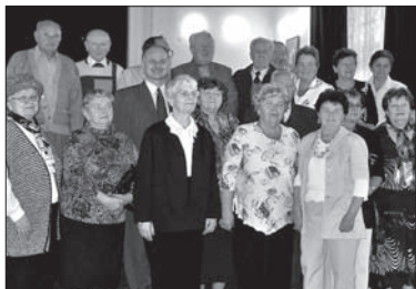
Dwudziestka jabłonkowskich seniorów.

JABŁONKÓW (kor) – Uroczyste przyjęcie dla wszystkich seniorów, którzy w tym roku ukończyli 75. rok życia, przygotowały władze stolicy zaolziańskiej góralszczyzny. Z 38 tegorocznych 75-latków przybyła do sali kinowej ratusza dwudziestka seniorów. Każdy z nich otrzymał książkę i dyplom pamiątkowy. O program zatroszczyli się uczniowie polskiej i czeskiej podstawówki.