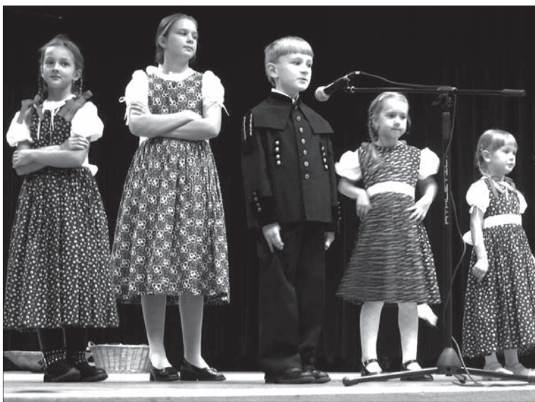
Śpiewają dzieci ze stonawskiej szkoły podstawowej.