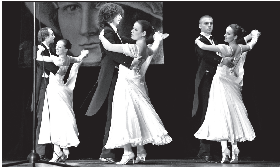
Zespół Regionalny „Błędowice” rozpoczął program polonezem i walcem.