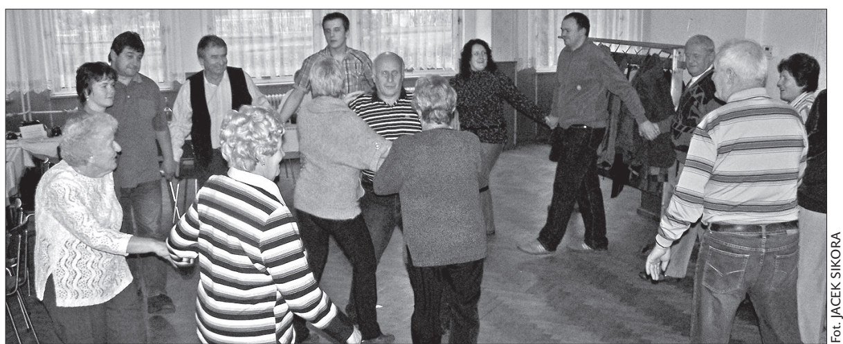
Na swoim Spotkaniu Jesiennym PZKO-wcy z Milikowa-Pasiek nawet sobie zatańczyli.

Koło w Pasiekach należy do tych mniejszych organizacji terenowych PZKO. Liczy 123 członków, aktywnie jednak działa najwyżej trzydziestka Polaków z tej osady Milikowa. Spotkanie Jesienne to jedna z najważniejszych imprez pasieczan. Z