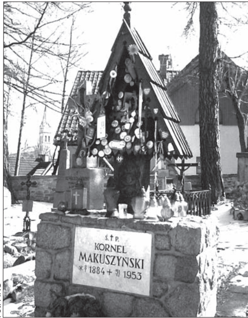
Na Pęksowym Brzyzku spoczywa wiele znanych osób.

Jak głosi napis na drewnianej tablicy z dnia 7 grudnia 1931 r., zawieszony u bramy wejściowej: „Urząd Wojewódzki Krakowski (...) uznaje stary cmentarz przy dawnym kościółku parafialnym w Zakopanem – jako posiadający wartość artystyczną, kulturalną i historyczną – za zabytek podlegający ochronie prawa”. Niemal każdy nagrobek, znajdujący się na otoczonym kamiennym murem cmentarzu, jest osobnym dziełem sztuki. Wiele z nich pochodzi z pracowni Władysława Hasióra, który także został