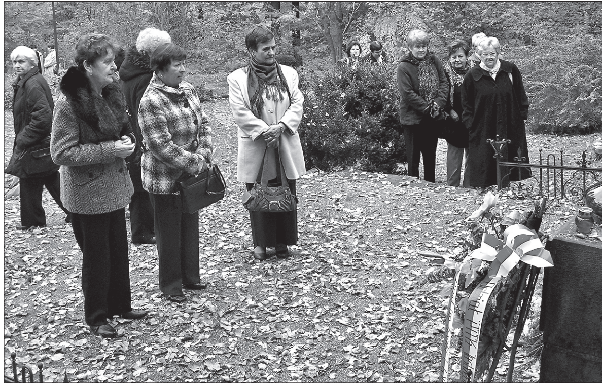
Członkinie Klubów Kobiet złożyły też kwiaty pod pomnikiem Franciszka Żwirki i Stanisława Wigury na Żwirkowisku.