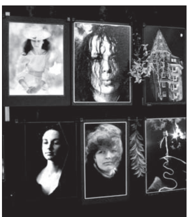
Pomysłowość milikowianek nie zna granic. Ciekawe prace można było oglądać w ostatni weekend.