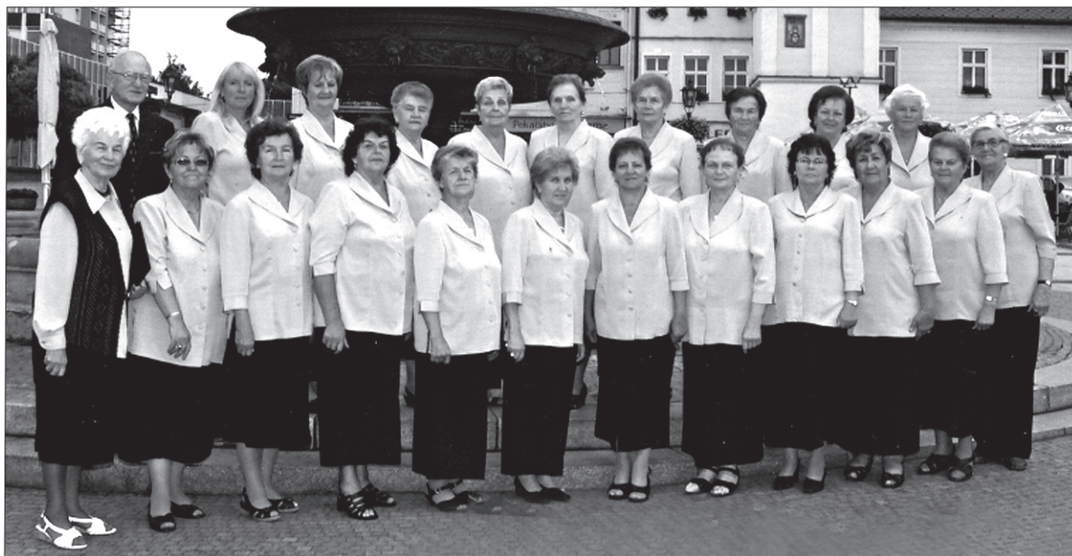
Chór żeński „Kalina” w roku jubileuszowym.