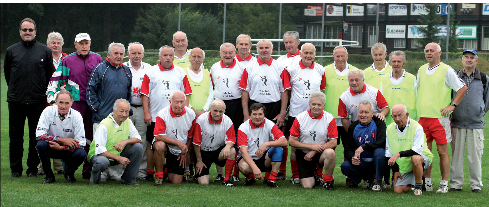
Wspólne zdjęcie uczestników poniedziałkowej zabawy piłkarskiej w Oldrzychowicach.