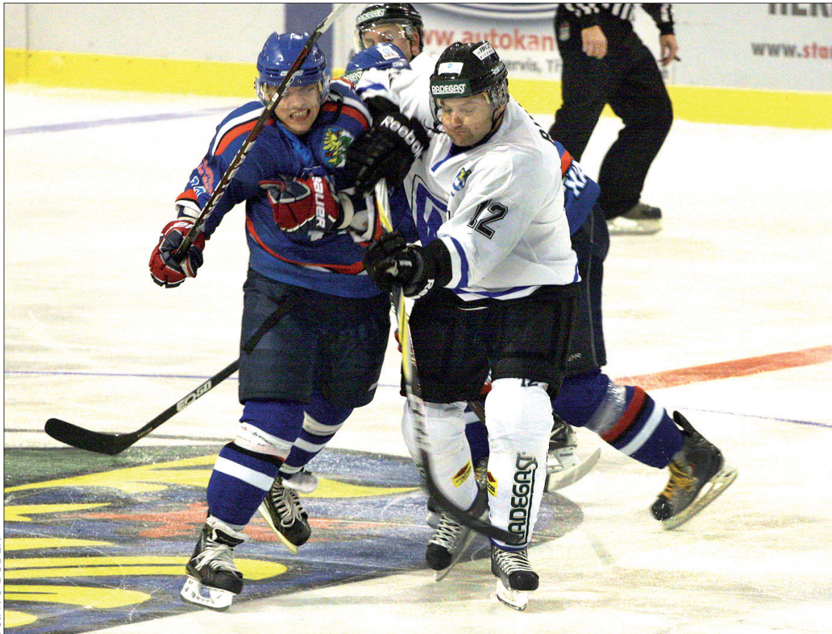
Hokeiści Hawierzowa (białe dresy) pokonali w derbach Karwinę 4:3.