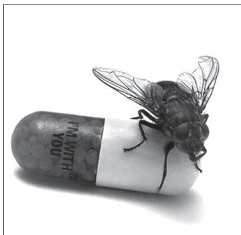
Okladka płyty „I'm With You”.