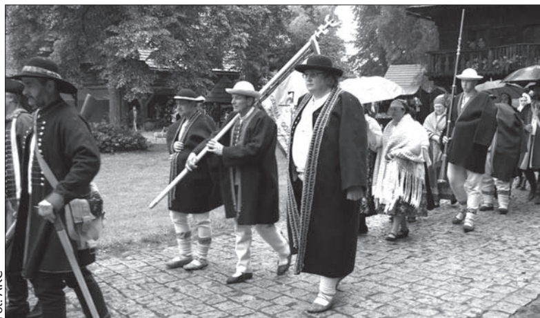
Podczas uroczystości na cmentarzu w Rożnowie nie zabrakło w lipcu przedstawicieli Oddziału Górali Śląskich Związku Podhalań z obu stron Olzy. Na pewno przyjadą do Rożnowa także w najbliższą środę.

Jako znawca folkloru wołoskiego i kultury pasterskiej często gościł na zaolziańskich imprezach takich, jak „Miyszani łowiec” czy seminaria Sekcji Ludoznawczej Zarządu Głównego PZKO. Na jednym z nich, w Jabłonkowie, wygłosił wykład pn. „Sałasznictwo w Beskidach Cieszyńskich, a także o wołochach i góralach”. (kor)