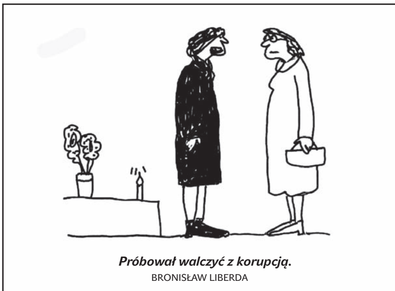
Próbował walczyć z korupcją.

Zainteresowani mogą zgłosić swój udział do 30 września, pisząc na adres: bezečna1@post.cz, lub dzwoniąc pod numer telefonu 558 993 587. (dc)