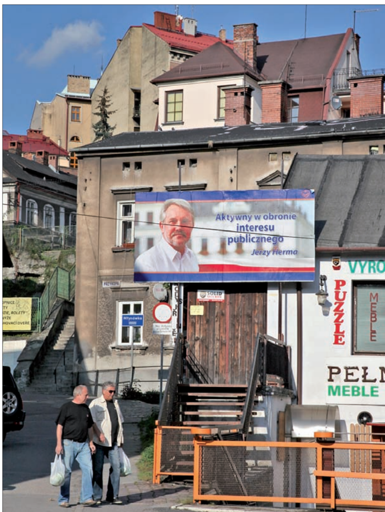
Przedwyborczy krajobraz w Cieszynie.

Wybory w ostrawskim Konsulacie będą trwały od godz. 7.00 do 21.00. Udział mogą wziąć obywatele Polski, którzy najpóźniej w dniu wyborów skończyli 18. rok życia, posiadają ważny paszport polski i zostaną wpisani do spisu wyborców w Konsulacie. Zgłoszenie to można wnieść ustnie – osobiście odwiedzając Konsulat, telefonicznie, pisemnie, telegraficznie, telefaksem lub pocztą elektroniczną. Najprostszym sposobem jest skorzystanie z internetowego systemu zgłaszania się wyborców na stronie https://ewybory.msz.gov.pl/ . Zgłoszenie powinno zawierać następujące dane: nazwisko, imię (lub imiona), imię ojca, datę urodzenia, numer ewidencyjny PESEL, adres miejsca pobytu za granicą, numer ważnego paszportu polskiego lub ważnego polskiego dowodu osobistego, deklarację sposobu głosowania (osobiście lub korespondencyjnie) oraz dane kontaktowe. Termin zgłoszeń upływa na trzy dni