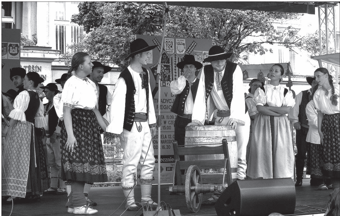
Atrakcyjnie było także w zeszłorocznej edycji imprezy.

Tegoroczna edycja święta tradycji i stroju regionalnego zapowiada się równie atrakcyjnie. W jego czeskokocieszyńskiej części, w sobotę 3 września, od godz. 15.00 obejrzyć będzie można kolejno występy ZPiT „Olza”, ZPiT „Mała Ziemia Cieszyńska”, „Gizdów” z Karwiny, ZPiT „Oldrzychowice” wraz z kapelą, ZPiT „Slezánek” oraz ZR „Istebna”.