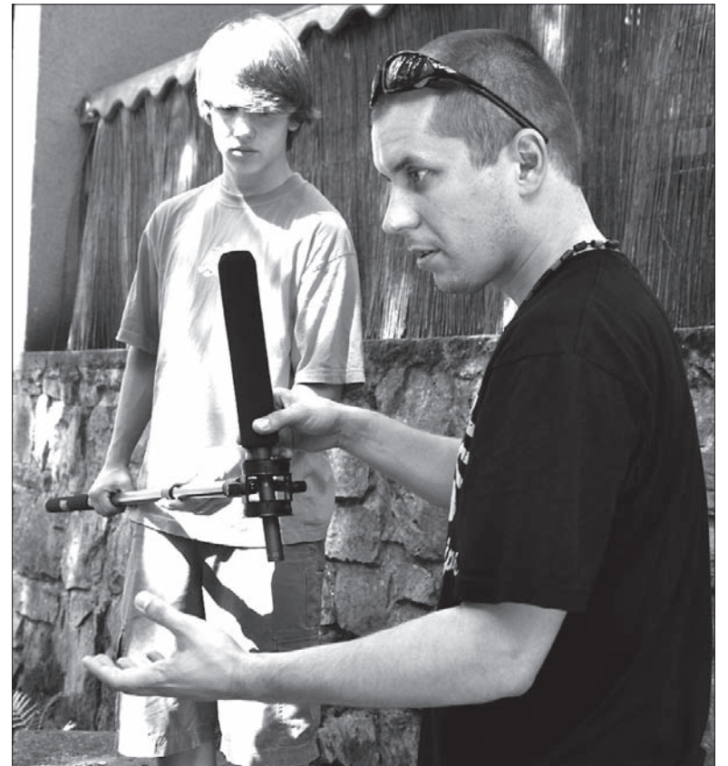
Jeden z wykładowców pokazuje, jak pracować z mikrofonem.