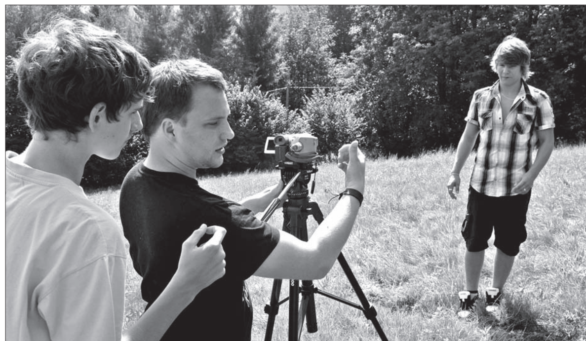
A tu już rodzi się filmowa etiuda.

Czy niektórzy z kursantów mogliby pójść w przyszłości na studia teatralne czy filmowe? – Widzę w tych młodych ludziach potencjał, wielu z nich próbuje. Obecnie jednak na studia teatralne trudniej się dostać, niż dawniej. Ale chętnie w przyszłości przywitałbym nawet kogoś z nich w Scenie Polskiej. A cieszy mnie, że niektórym ludziom, którzy w Koszarzyskach bawili się w film, udało się