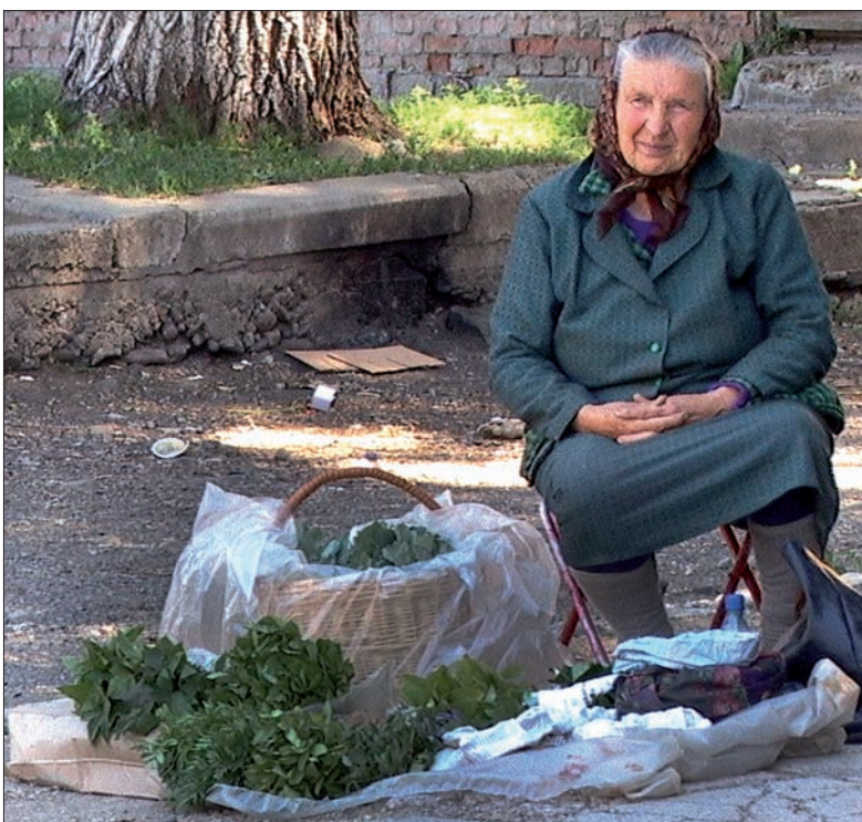
Staruszka oferuje na sprzedaż plony ze swego ogródka.

Wśród miejscowych nie było ludzi, którzy mogliby to robić?