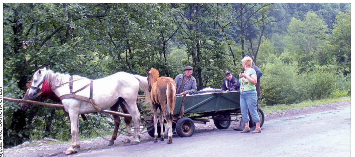
Końskie powozy są na Zakarpaciu ciągle w użyciu.

ze zbieraniem śmieci, których były wszędzie sterty. W Tjačivie wybudowaliśmy duży ośrodek dla pielgrzymów. Już szósty rok z rzędu odbywa się tam „Wielka Pielgrzymka Narodów i Narodowości”. Na początku pomagaliśmy ją organizować, teraz mamy tam tylko główną koordynatorkę, a miejscowi wszystko już przygotowują sami. Oni widzieli w nas przedstawicieli bogatego zachodniego społeczeństwa, powalalo ich, że nasi ludzie do nich przyjeżdżają i za darmo coś dla nich robią. To było dla nich naprawdę motywujące. Stopniowo zaczęliśmy realizować kolejne projekty – „Adopcję na odległość”, „Godne życie”. To unikatowy projekt,