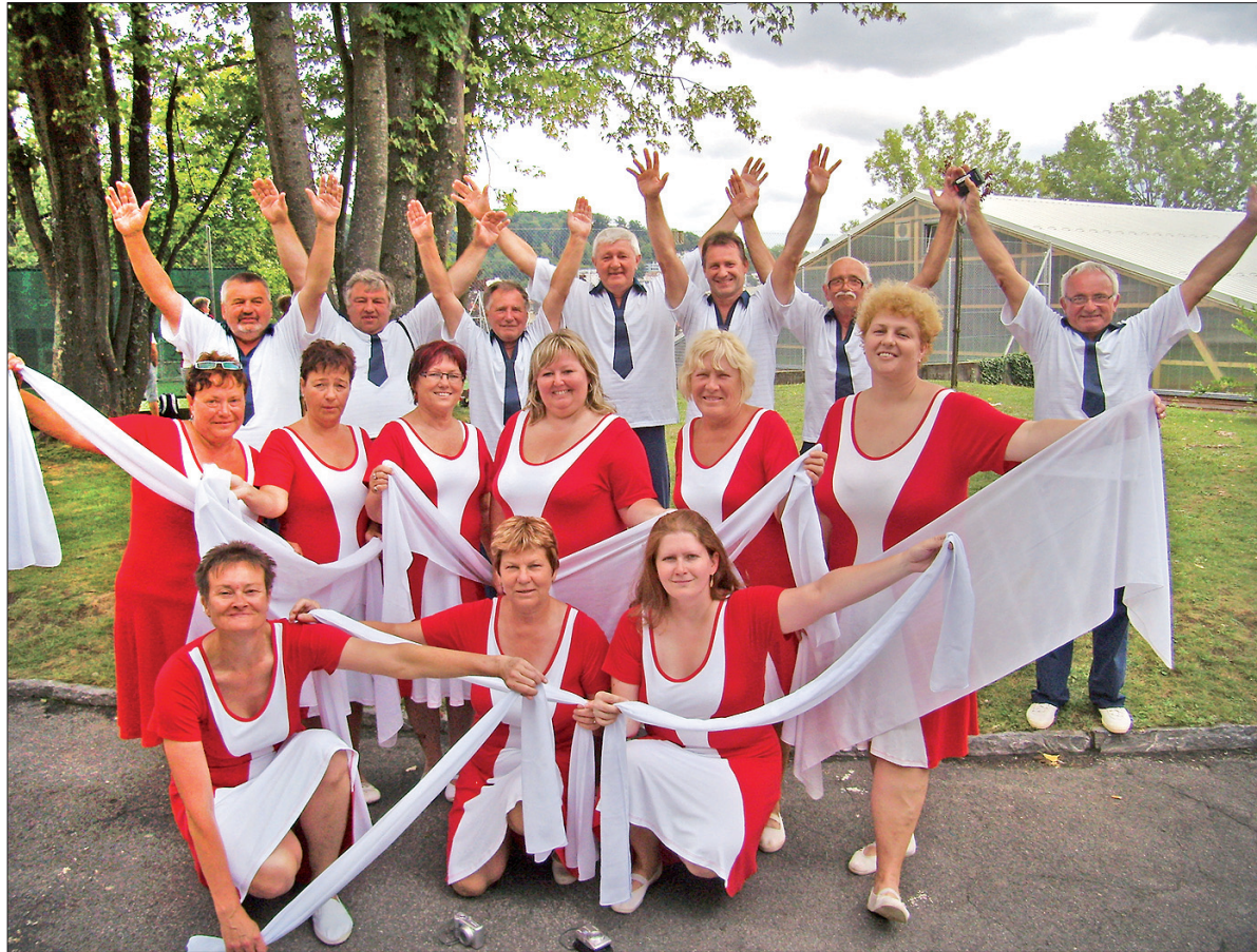
Zdjęcie grupowe karwińskiego „Sokoła”.