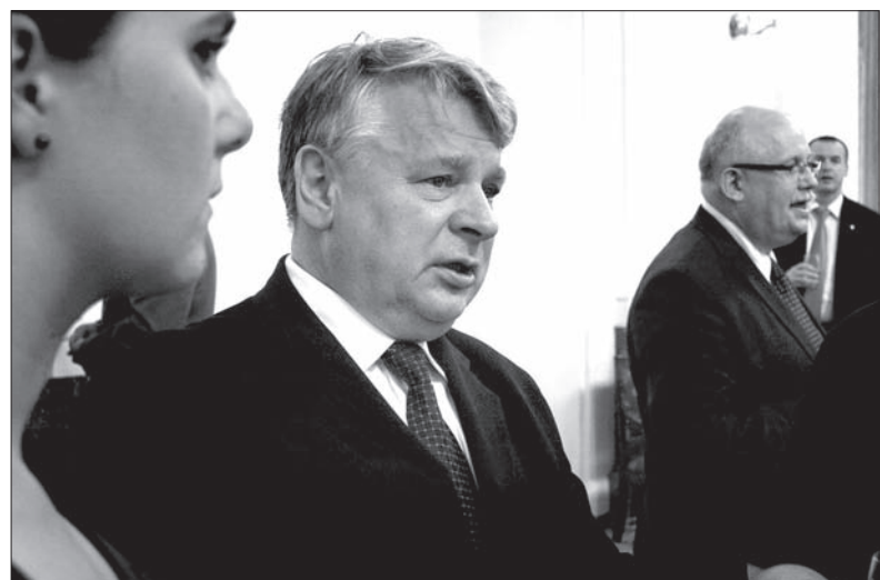
Marszałek Senatu RP, Bogdan Borusewicz, gościł w RC dwa dni.

Polski polityk w rozmowie z „Głosem Ludu” wspominał także, że od premiera Nečasa uzyskał zapewnienie o kontynuacji wsparcia z budżetu państwa dla polskiej prasy na Zaolziu, za co podziękował szefowi czeskiego rządu.