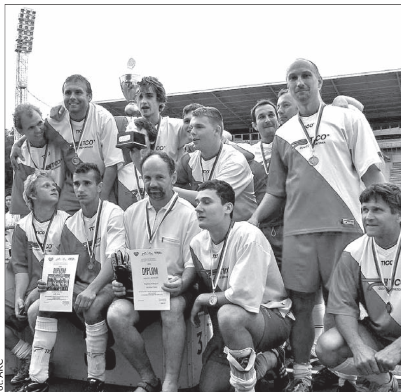
Piłkarska reprezentacja Polaków w RC z brązowym pucharem zdobyłym w mistrzostwach mniejszości narodowych w Pradze o „Puchar Senatu RC”.