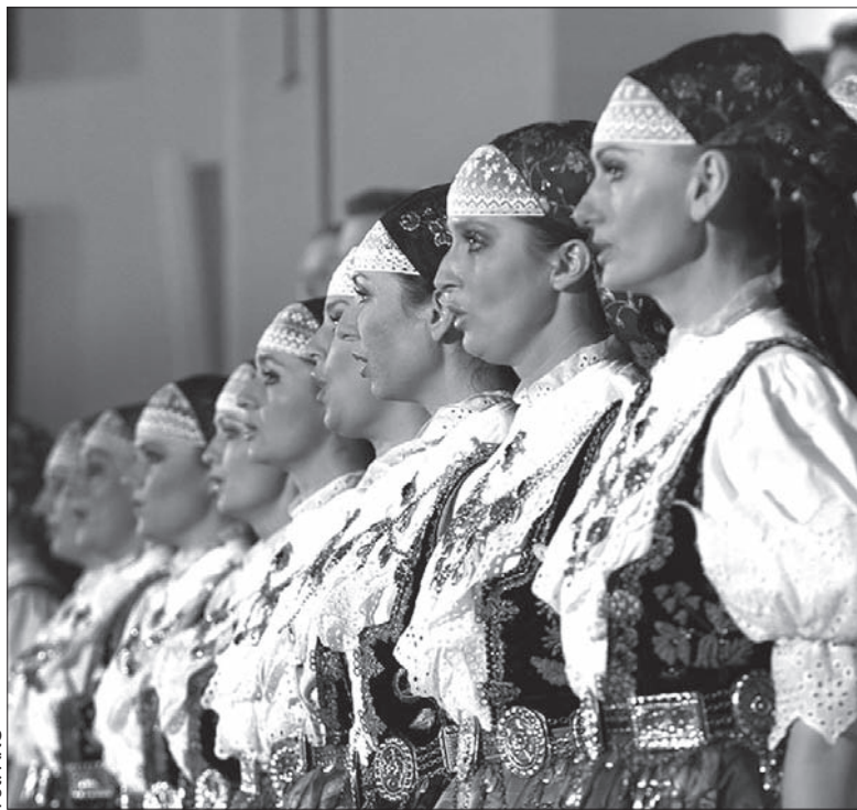
Na piątej złotej płycie „Śląska” zaśpiewał też chór zespołu.

Większość kompozycji i opracowań muzycznych, które znalazły się na złotym albumie, są dziełem Stanisława Hadyny. Z kolei autorem muzyki do „Suity Tańców Rzeszowskich” i opracowania muzycznego „Krakowiaków Lachów Sądeckich”