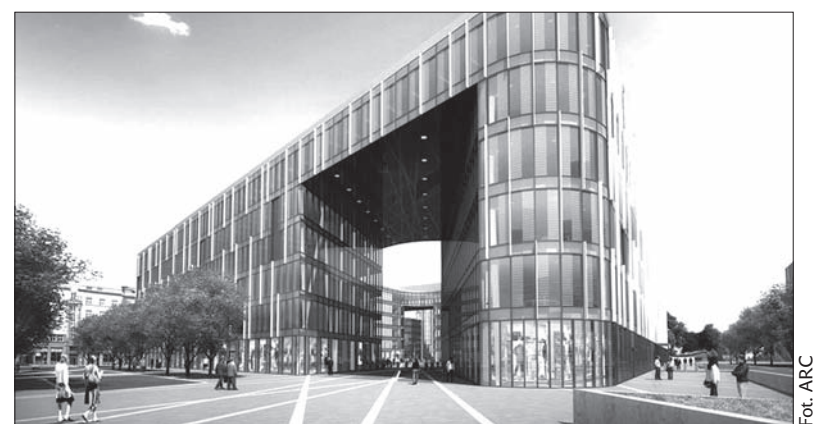
Wizualizacja biurowca Nowa Karolina Park.

Kompleks biurowy ma być dokończony w 2013 roku. O rok wcześniej, już wiosną przyszłego roku, zostaną oddane do użytku centrum handlowo-rozrywkowe oraz kompleks mieszkaniowy, składający się z ok. 250 mieszkań. (dc)