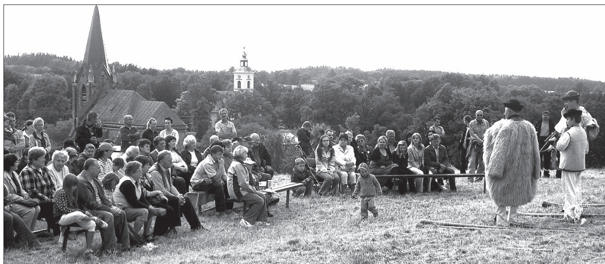
Na świętojańskim spotkaniu w Ligotce zagrała m.in. rodzinna słowacka kapela Gernatovci z Turzówki.