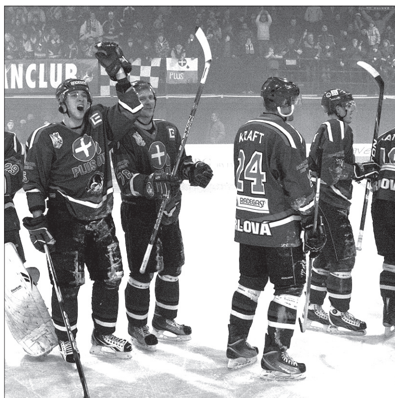
Hokeiści Orłowej zagrają w nowym sezonie w Karwinie.