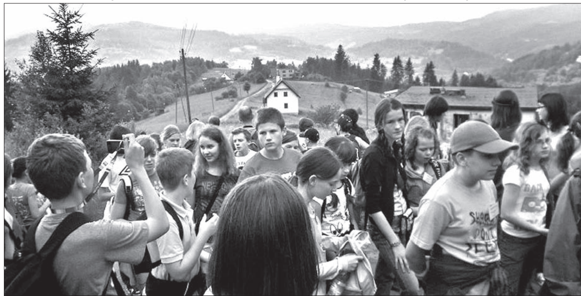
Zaolziańscy matematycy już drugi raz gościli w Wiśle.

Podobnie jak w roku ubiegłym, pod koniec czerwca wyjechała do Wisły 18-osobowa grupa uczniów klas V-VII wraz z dwójką opiekunów, by wziąć udział w finałach 19. edycji Międzynarodowego Konkursu Matematycznego Pikomat. Program dwudniowego zgrupowania przygotowali opiekunowie ze Śląskiego Stowarzyszenia Oświatowego „Delta” w Katowicach oraz metodycy z Centrum Pedagogicznego dla Polskiego Szkolnictwa Narodowościowego w Czeskim Cieszynie. Dla naszych uczniów spotkanie z najlepszymi matematykami z całej Polski jest szczególnie atrakcyjne. Dzieci przebywają w środowisku swych rówieśników, posługują się językiem polskim na co dzień, poznają tradycyjną kuchnię polską, integrują