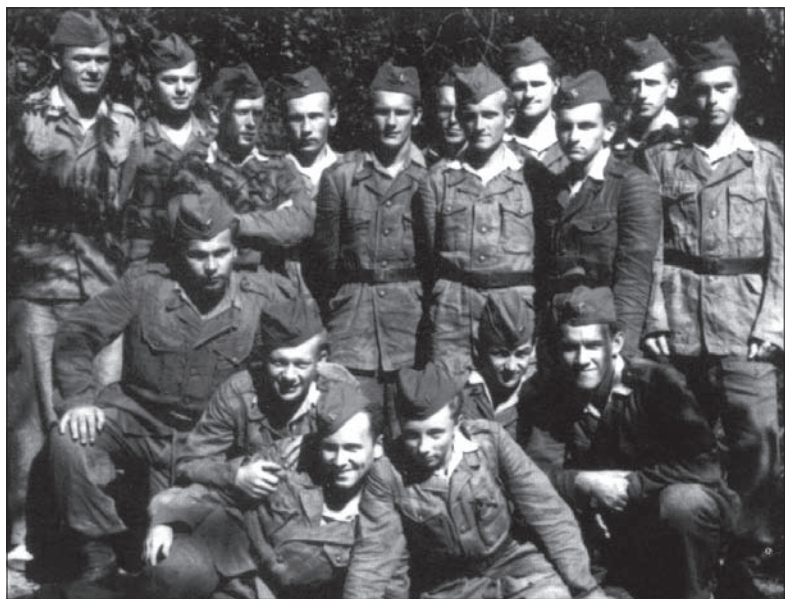
Historyczne zdjęcie wojskowego chóru Zaolziaków studiujących w Ostrawie.

tacyjnym Akademickim Chórem Wojskowym”. Chór był polski, bo śpiewali w nim Polacy, akademicki – bo byliśmy studentami, wojskowy – bo w ramach studiów odbywaliśmy służbę wojskową, a reprezentacyjny dlatego, że reprezentowaliśmy