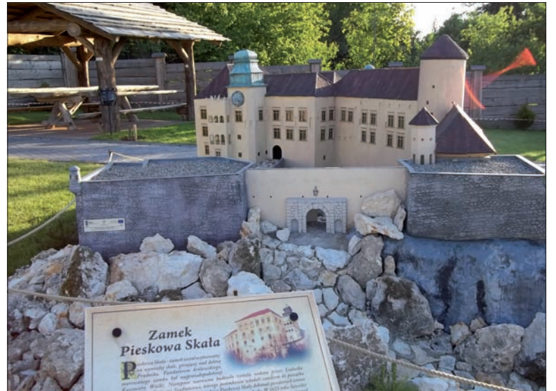
Zamek Pieskowa Skala – jedna z miniatur Szlaku Orlich Gniazd.

Dojazd: z Czeskiego Cieszyna odległość 50 km, czas przejazdu 1:02 h