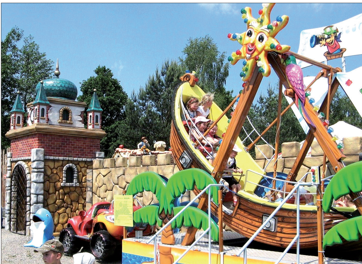
Łódź piracka w Bajkowej Krainie rybnickiego parku rozrywki.

Godziny otwarcia: po-nie 9-20 Dojazd: z Czeskiego Cieszyna odległość 129 km, czas przejazdu 1:52 h