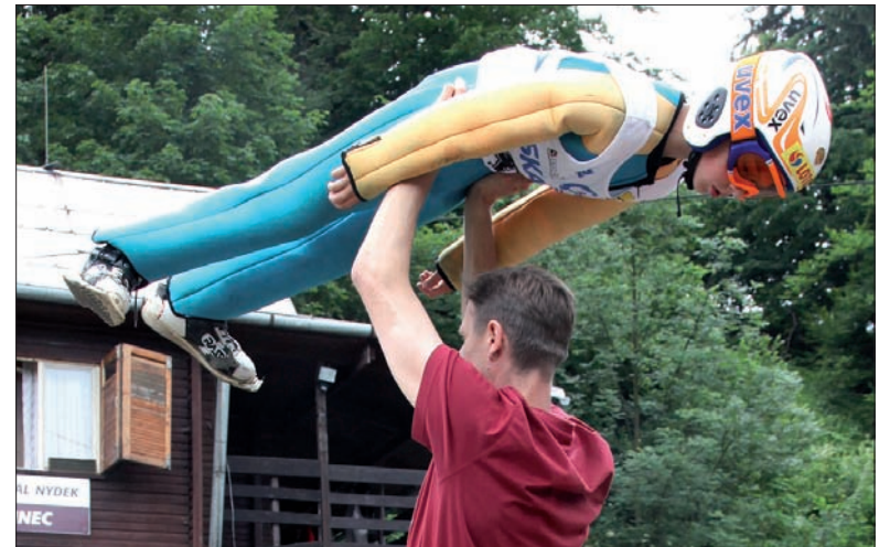
Ostatnie przygotowania przed startem.