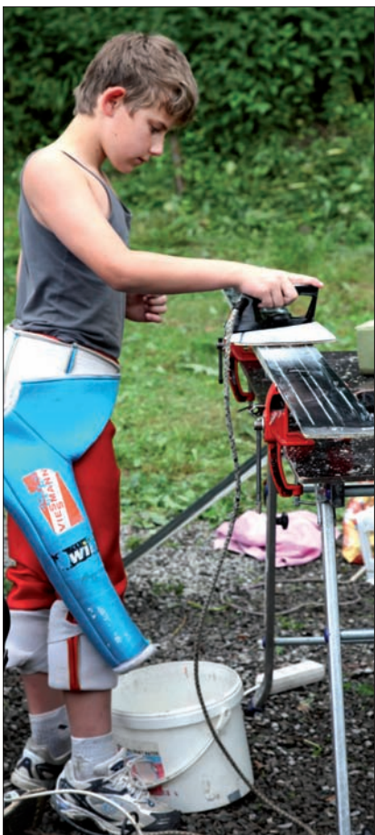
Prasowanie to nie tylko domena kobiet.