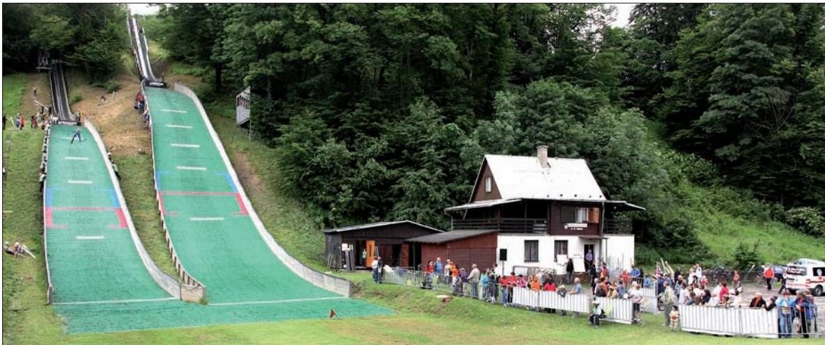
Widok na obie skocznie w Nydku. Od lewej: K-24 i K-40.