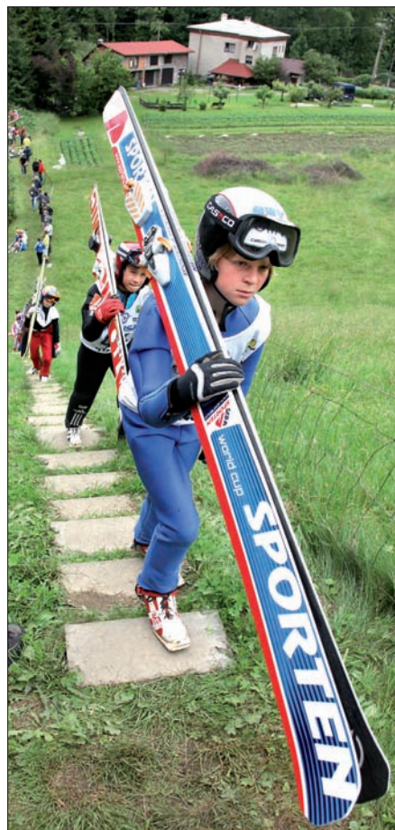
Wspinaczka po stromych schodach.