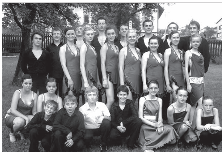
Tancerze „Rytmika” przed Domem PZKO im. Jury spod Grónia w Nawsiu.

Warto przypomnieć, że swoimi tańcami „Rytmik” urozmaica co roku bale na całym Zaołziu, od Mostów koło Jabłonkowa po Karwinę, a w roku 2007 zespół został uhonorowany nagrodą „Złoty jestem” w ankiecie „Tacy jesteśmy” Kongresu Polaków. (kor)