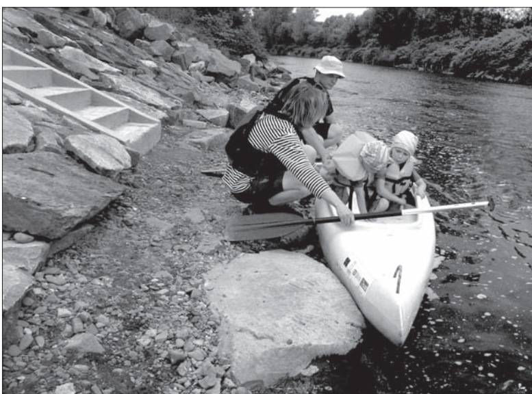
Próba generalna przystani odbyła się w minioną sobotę.