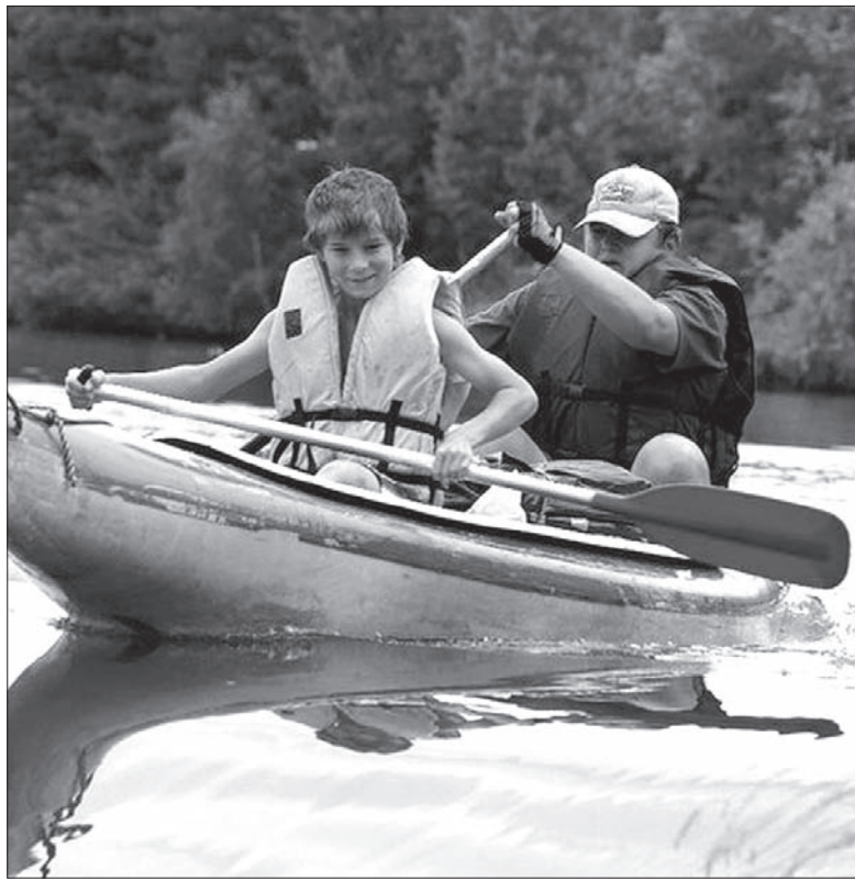
Wakacje na świeżym powietrzu.