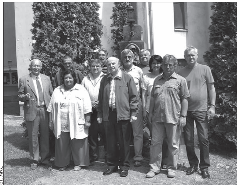
Przed kościołem w Starym Boguminie.