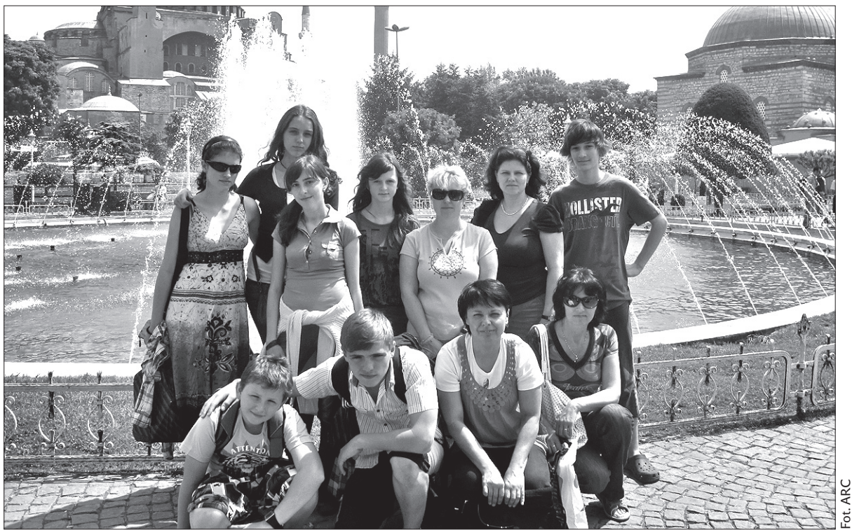
Jabłonkowanie przed kościołem Hagia Sofia.