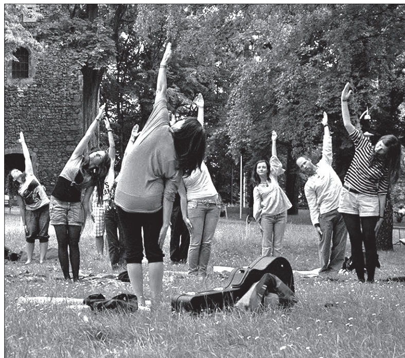
Niecodzienny widok – joga przed Wieżą Piastowską.