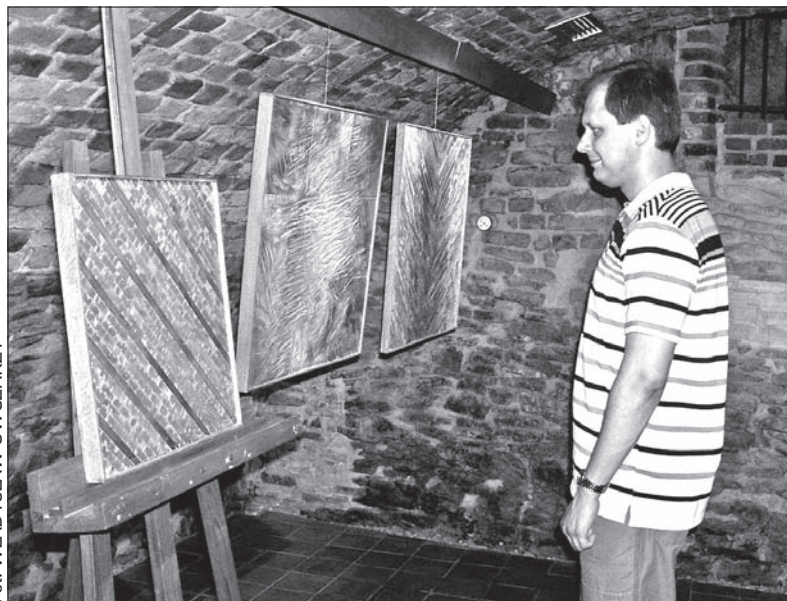
Fragment wystawy w renesansowych podziemiach frysztackiego ratusza.

We frysztańskiej Galerii pod Wieżą zainteresować może ostatnia wystawa twórczości Svatoslava Böhma z Krnova. Autor znany jest przede wszystkim ze swoich opracowań graficznych książek, plakatów i innych projektów grafiki użytkowej. W renesansowych podziemiach frysztackiego ratusza pokazuje jednak swoje obrazy-płaskorzeźby z drewna, na których dominują najprostsze kształty geometryczne i linie wytworzone przy pomocy piły łańcuchowej, dłuta i barw.