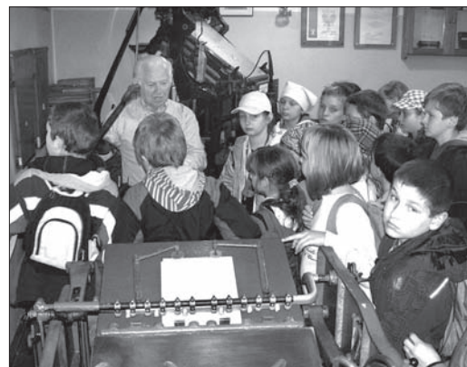
Zwiedzanie Muzeum Drukarstwa to duża frajda...

do 18.00. Będą to: Muzeum Drukarstwa (dzień otwarty), Archiwum Państwowe w Katowicach – oddział Cieszyn (wystawa najstarszych cieszyńskich dokumentów i ksiąg cechowych), Archiwum i Biblioteka Konwentu Zakonu Braci Miłosiernych (wystawa i pokaz technik introligatorskich), Biblioteka Miejska (wystawa i warsztaty dla dzieci),