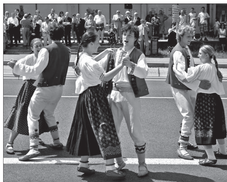
Przed trybuną trzeba zatańczyć.