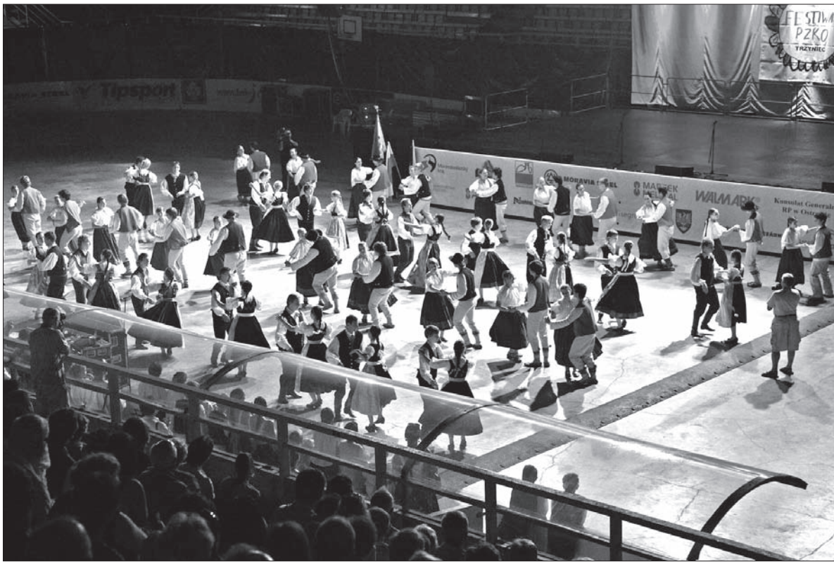
Zasiali górale... taniec.

ny Polski, RC i Unii Europejskiej, „Gaude Mater Polonia”, a także „Hymn III Tysiąclecia”, w którym solo zaśpiewał Klemens Słowiczek, a później inne pieśni, głównie ludowe.