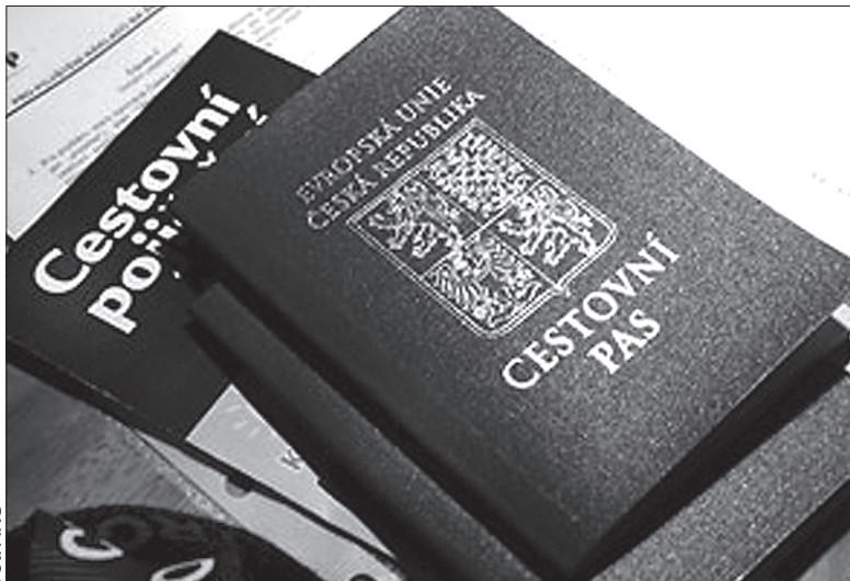
Już tylko do końca czerwca można wpisać dzieci do paszportu rodziców.

– W porównaniu z tym samym okresem ub. roku odnotowaliśmy