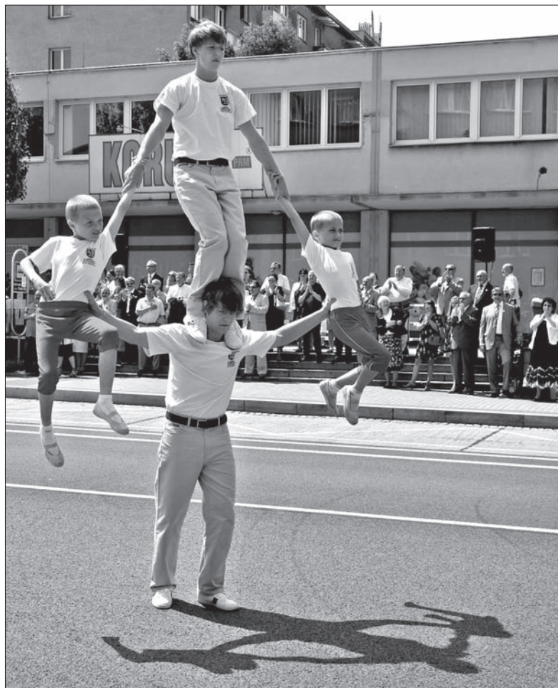
Ach, ci „Gimnaści”...

Za współpracę miasta z polską mniejszością oraz wspieranie przez władze Trzyńca polskich inicjatyw podziękował wiceburmistrzowi Kalecie oraz radnym senator Rzeczypospolitej Polskiej, Tadeusz Skorupa. Senator Skorupa przybył na