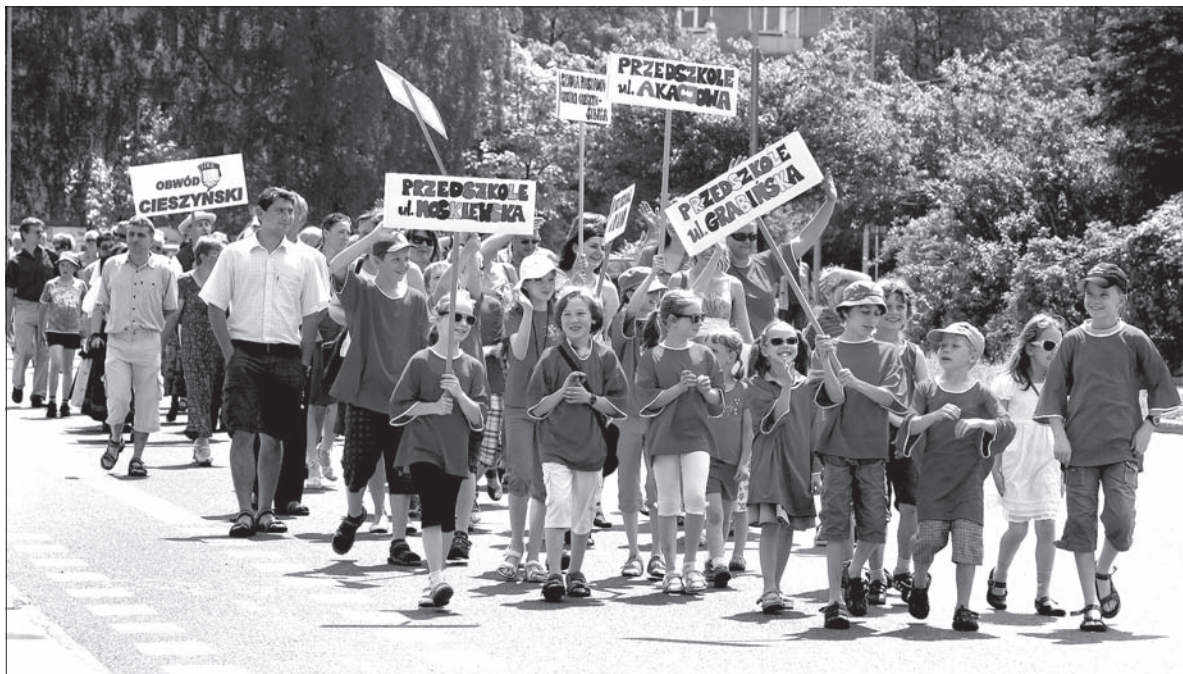
W festiwalowym korowodzie zaprezentowały się w sobotę w Trzyńcu w ramach swojego obwodu PZKO także wszystkie czeskokoczijskie polskie przedszkola.