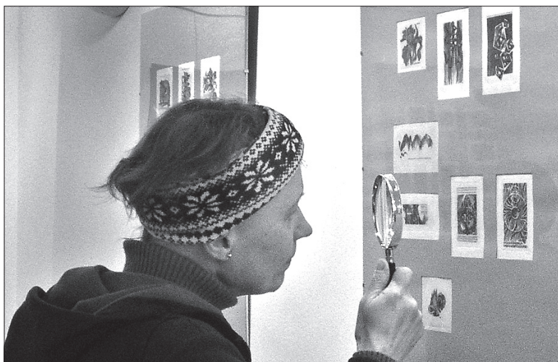
Na wernisażu często przy pomocy lupy starano się zgłębić mistrzostwo poszczególnych rycin Wojciecha Jakubowskiego.

„Głos Ludu” – patron medialny wydarzenia – ogłasza konkurs, którego nagrodą są podwójne zaproszenia na Święto Herbaty. Wystarczy odpowiedzieć na pytanie: Po raz który wystąpi na Święcie Herbaty zespół Karpaty Magiczne? Poprawne odpowiedzi nadsyłać należy e-mailem do środy, 8 czerwca, do godziny 14.00 ( info@glosludu.cz ). (wib)