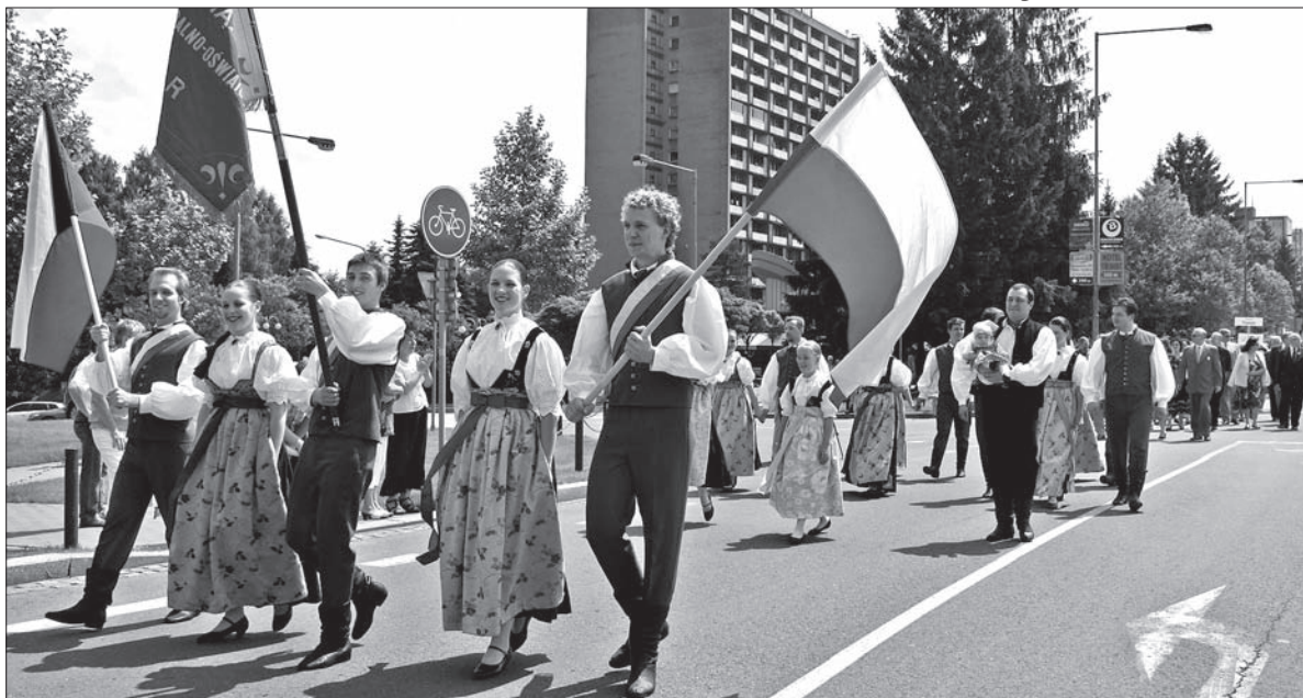
Poczet sztandarowy korowodu prezentował się pięknie i dostojnie.

Festiwal PZKO to sztandarowa impreza związkowa, prezentująca dorobek kulturalny tej największej w RC polskiej organizacji. Festiwal nawiązuje do centralnych imprez czolowych organizacji zaolziańskich odbywających się na Zaolziu w okresie międzywojennym w Parku Adama Sikory w Czeskim Cieszynie. Po utworzeniu w 1950 roku Zarządu Głównego PZKO władze Związku zaczęły urządzać w czeskokieszyńskim Parku Krajo-we Festyny PZKO. Po raz pierwszy festyn nazwano festiwalem w 1953