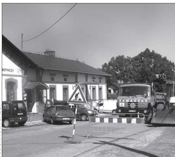
Centrum Suchej Górnej czekają zmiany.

Sucha Górna będzie miała nowoczesne centrum. Ruszyła realizacja projektu dofinansowanego z funduszy europejskich. To dalszy etap rewitalizacji centralnej części gminy, nawiązujący do niedawno zakończonych remontu generalnego Domu PZKO i dobiegającej końca przebudowy Domu Robotniczego. Licząca 4,6 tys. mieszkańców gmina nie miała dotąd atrakcyjnego centralnego placu czy deptaku. Ulice Centrum i Sportowa całkowicie się teraz zmienią. Powstanie deptak z ławeczkami, asfaltowa nawierzchnia zostanie zastąpiona brukiem, wybudowane będą nowe chodniki, miejsca parkingowe, zainstalowane będą nowe oświetlenie publiczne. Duże zmiany szykują się w Parku Bohaterów. – Do tego będzie nawiązywała ścieżka rowerowa biegnąca wzdłuż Suszanki w kierunku Hawierzowa – poinformował zastępca wójta Suchej Górnej, Josef Žerdík. Centrum uzyska jednolity wygląd, również dlatego, że domy przylegające do ul. Centrum będą miały z przodu takie same, atrakcyjnie wyglądające płoty. (dc)