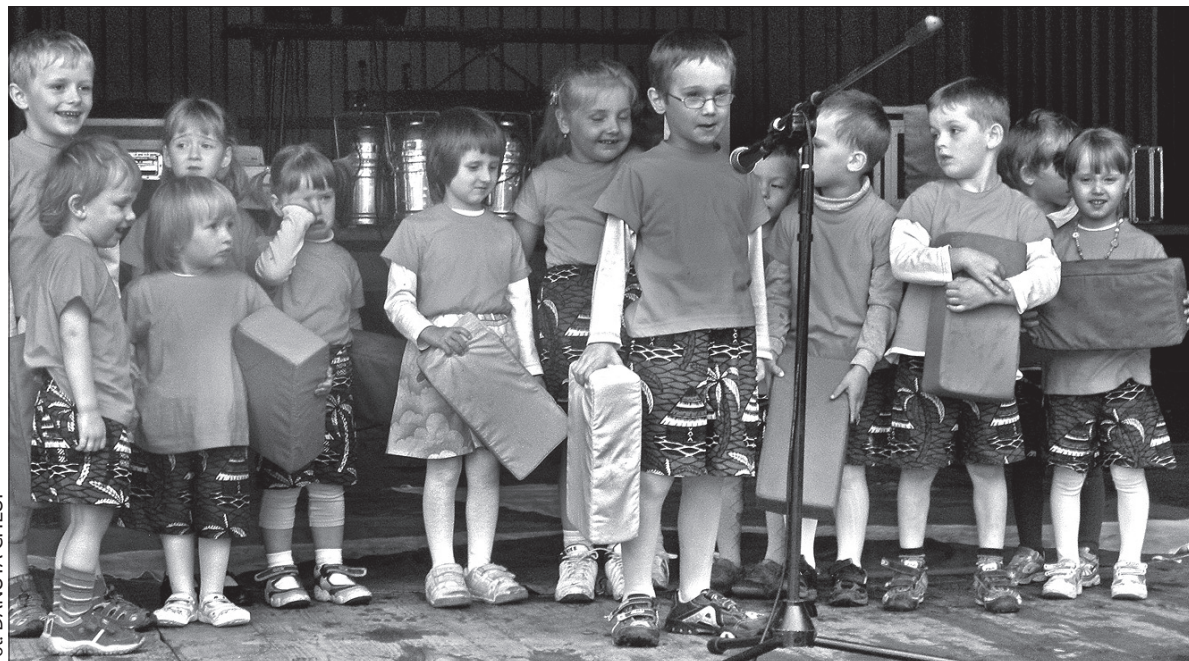
Przedszkolaki opowiedziały widzom, skąd się biorą dzieci.