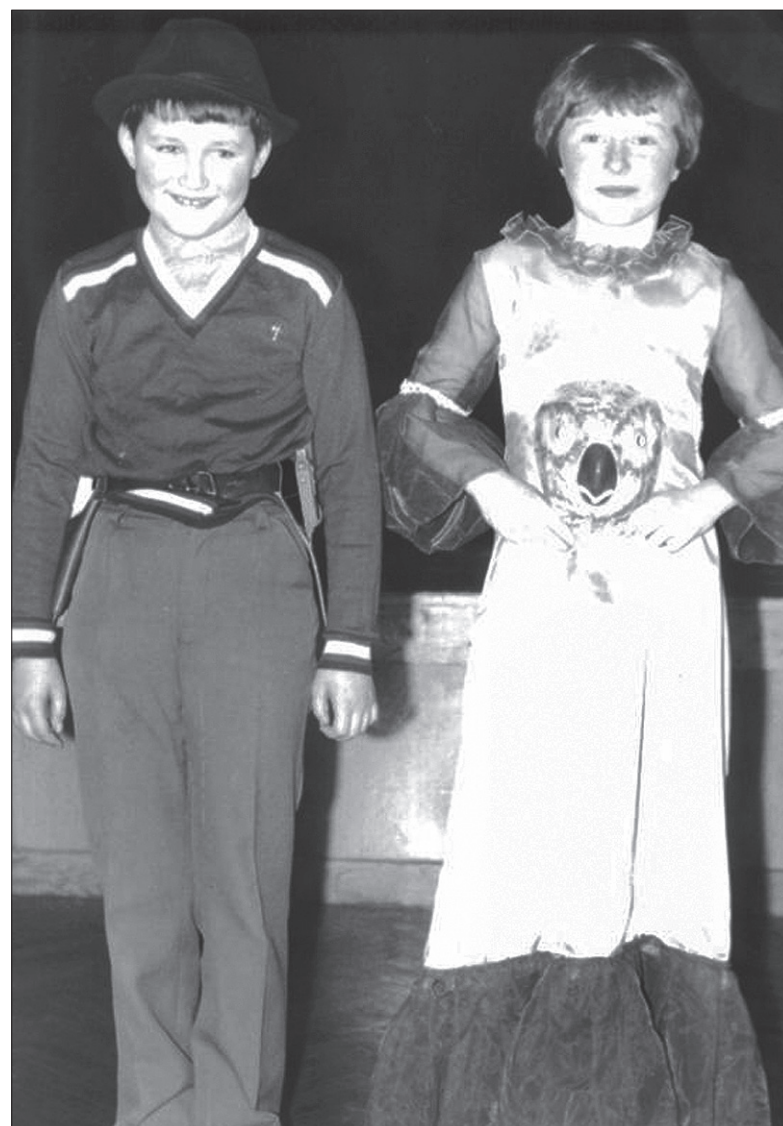
Dziecko 3 (z lewej)

Historia ta zdarzyła się, gdy byłem bardzo mały, bo do przedszkola chodzili jeszcze moi starsi bracia.