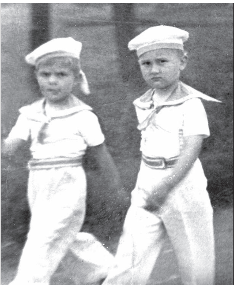
Dziecko 2 (z prawej)

Miałem chyba sześć lat, kiedy losy rzuciły mnie z Wędryni do Ostrawy. Lekarze skierowali mnie do szpitala na Fifejdach. Byłem poddany określonym zabiegom medycznym i lekarze doszli do wniosku, że jestem zdrowy. Dość nieoczekiwanie