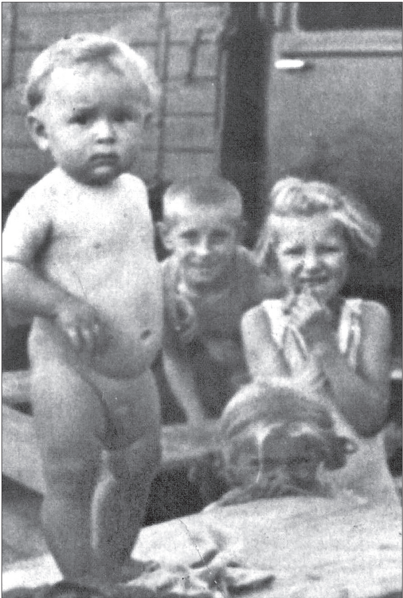
Dziecko 5 (z lewej)

Jestem dzieckiem wojny, urodziłam się w 1942 roku. Dlatego z czasów okupacji mało co pamiętam. Ale jedno utkwiło mi w pamięci. Otóż podczas wojny i tuż po niej sporo było