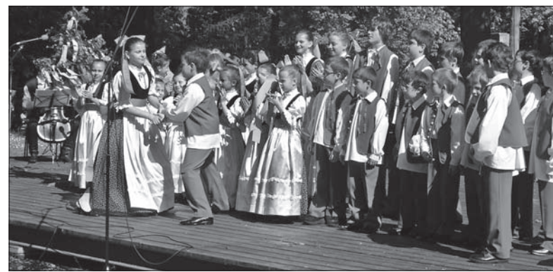
Frysztackie „Gizdy” w pełnej krasie.