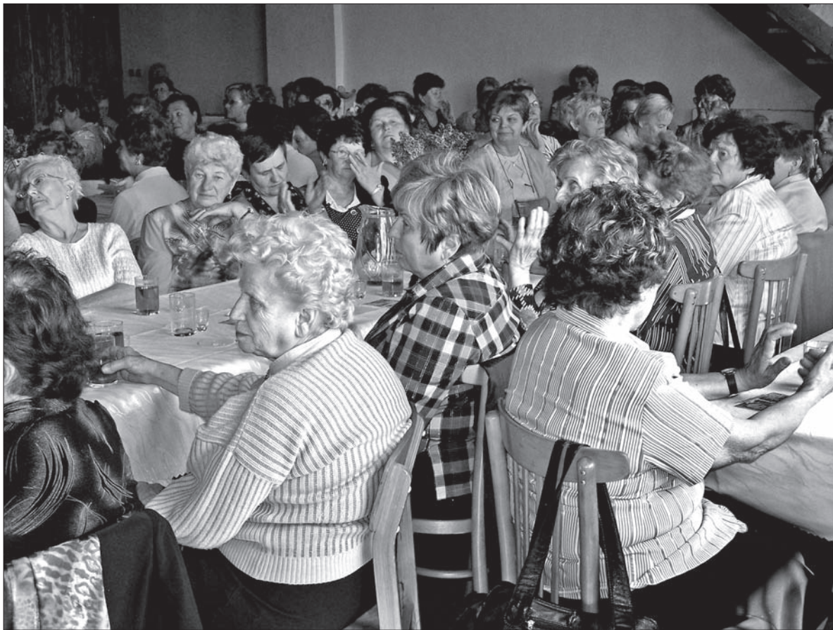
Wiosenne Spotkanie Klubów Kobiet przyciągnęło do nawiejskiego Domu PZKO wiele pań.