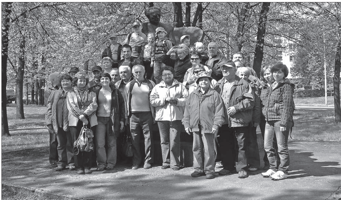
Uczestnicy wycieczki pod pomnikiem Gustawa Morcinka w Skoczowie.

Po przerwie na posiłek wycieczkownicy udali się w stronę gór. Po-