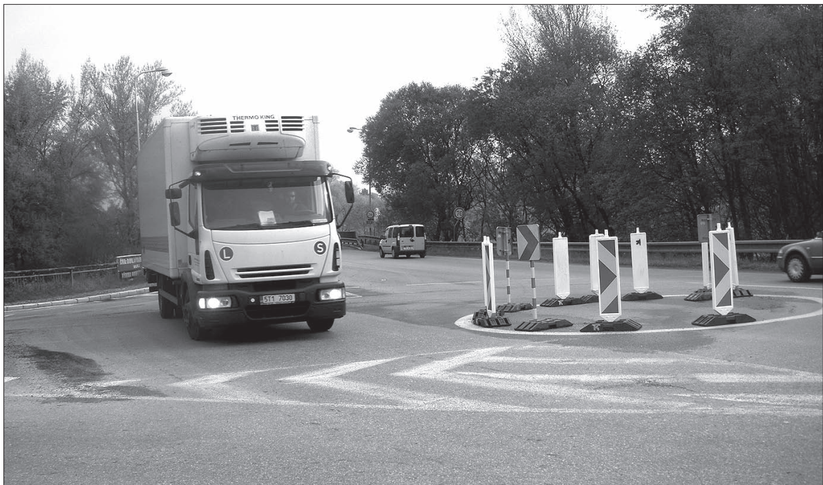
Widok na prowizoryczne rondo w Karwinie.

– Jeżdżę objazdem przez Stonawę do pracy w Ostrawie. Ponieważ nakładam drogi, zajmuje mi to jakieś dziesięć minut dłużej niż normalnie. Rano, po godzinie szóstej, ruch jest w miarę płynny, na rondach trzeba jednak uważać, ponieważ niektórzy kierowcy nie przestrzegają pierw-