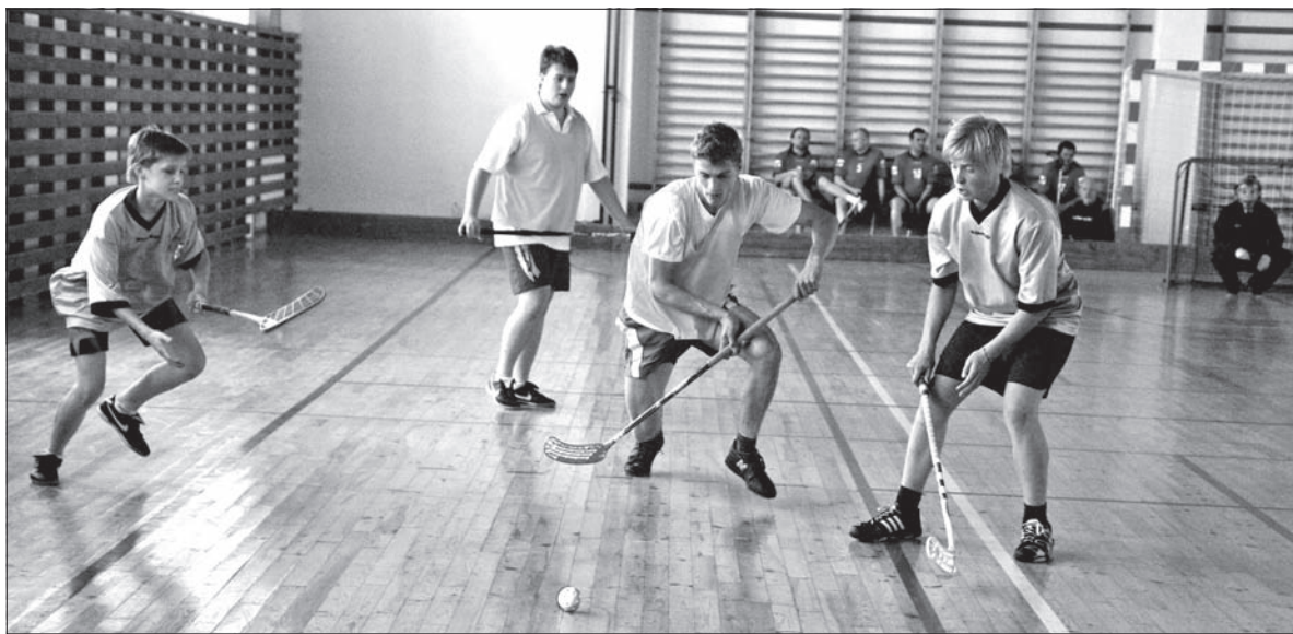
Akcja z meczu pomiędzy klasami III/IV gimnazjum a dziewięcioklasistami PSP.

Ze zwycięstwa w zawodach radowali się chłopcy z pierwszej i drugiej klasy gimnazjum, którzy nie przegrali ani jednego meczu w turnieju. Świetnie radzili sobie także ich starsi koledzy z klas 3-4, którzy zajęli drugie miejsce tylko za sprawą gorszego bilansu bramek. Wzajemny i warto podkreślić zacięty mecz „gimpłków” zakończył się remisem 1:1. Na trzecim miejscu uplasowała się ekipa nauczycieli.