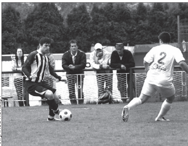
Zdjęcie z meczu Sucha Górna (stroje w paski) – Śmiłowice.

Do przerwy: 0:1. Bramka: 15. Cupek. Sucha Górna: Drobec