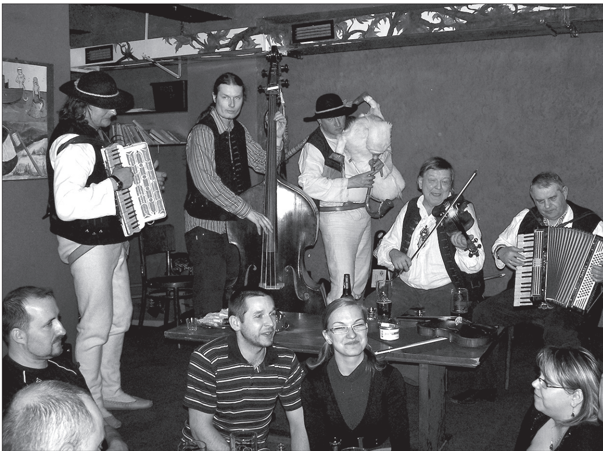
W „Dziupli” śpiewali w sobotnią noc nie tylko członkowie kapel, ale też publiczność.