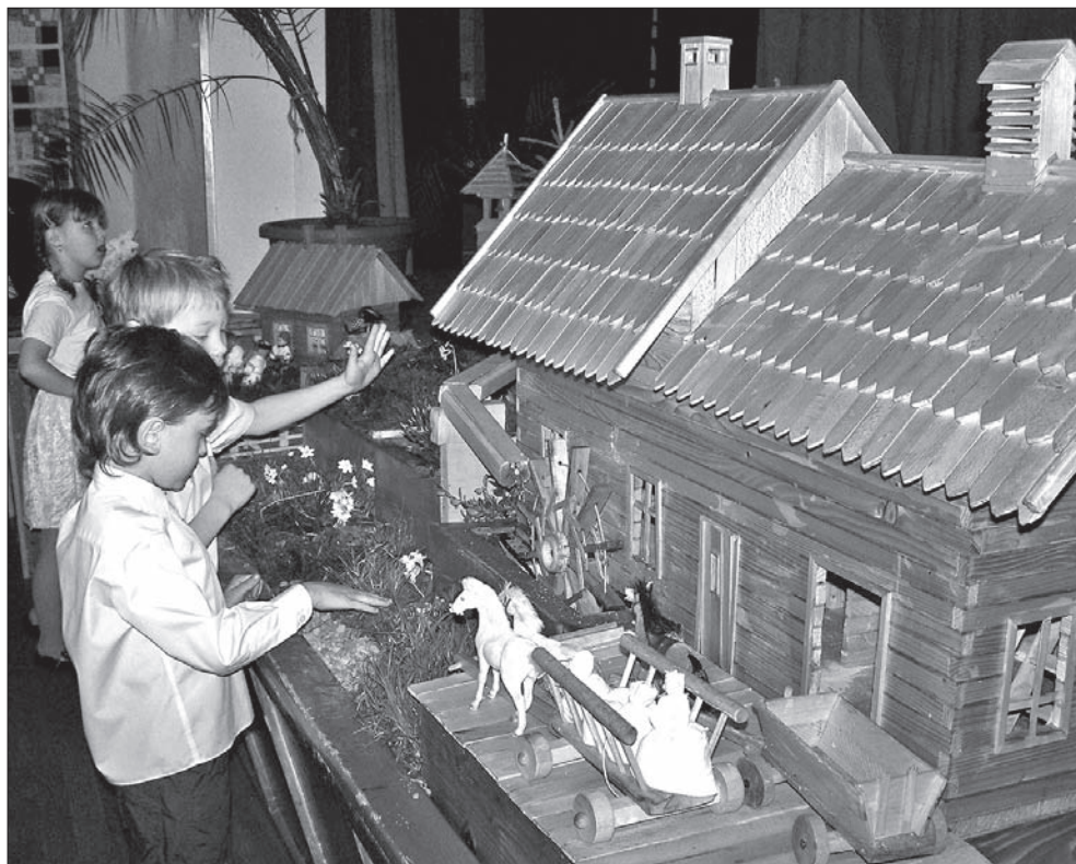
Dzieciarni najbardziej podobał się drewniany model młyna wodnego.

zaolziańskich południowo-zachodnich kresów. – Do zapisów jednak przyszło sporo dzieci, możemy się zatem spodziewać, że liczba uczniów w przyszłym roku szkolnym wzrośnie do setki – informuje mnie dyrektor gnojnickiej PSP.