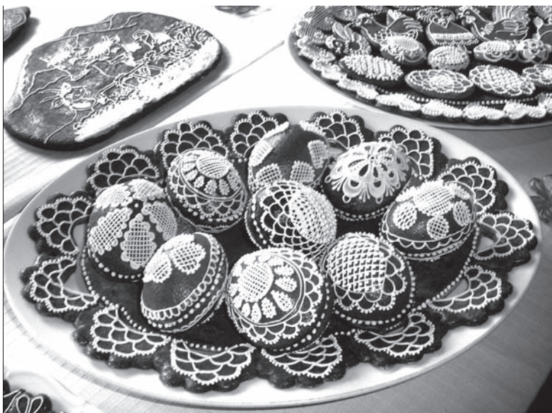
Pisanki z piernika pokazano w ub. roku na wystawie wielkanocnej w Muzeum Łomnińskim.

Trzyniecki jarmark wielkanocny odbędzie się w dniach 18 i 19 kwietnia w godz. 10.00-18.00 przed Domem Kultury „Trisia” oraz na Rynku Wolności. Również uczestnicy trzynieckiego jarmarku będą mogli przyjrzeć się rzemiosłom ludowym, różnorodnym technikom dekorowania pisanek, zakupić dekoracje świąteczne, wyroby koszykarskie, z piernika i inne. W poniedziałek o godz. 15.30 wystąpi kapela „Fleret”, o godz. 17.00 „Blaf”, a we wtorek o godz. 17.00 – kapela folkowa