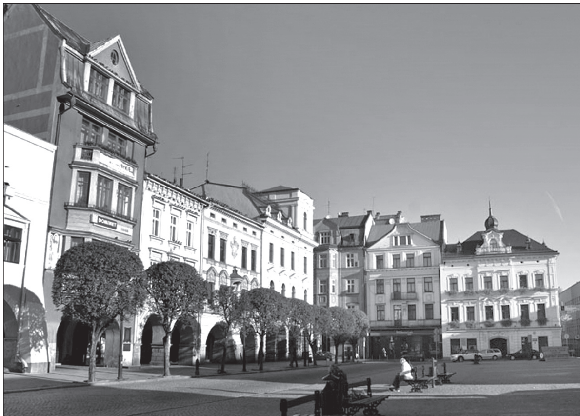
Rynek w Cieszynie. Tu odbędzie się niedzielna impreza.

Nieprzypadkowo impreza odbędzie się w momencie inauguracji rundy wiosennej rozgrywek ligi piłkarskiej, w której rywalizuje cieszyńska drużyna, a jednym z założonych