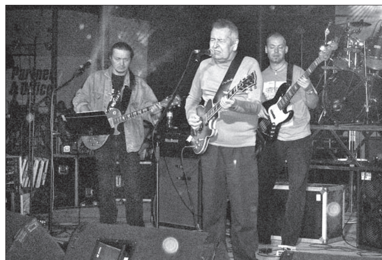
Legendarny Tadeusz Nalepa z zespołem Free Blues Band na Złocie w Wędryni w sierpniu 2006 roku.

Złot w Wędryni odbędzie się dopiero podczas wakacji. Już jednak za niespełna dwa miesiące, w piątek 13