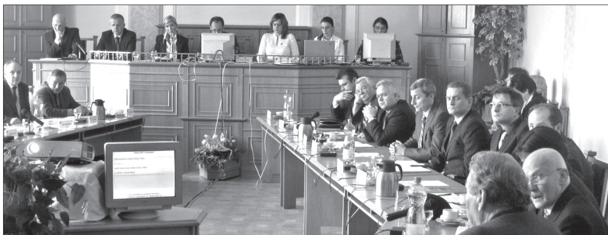
Inauguracyjne posiedzenie Rady Miasta przebiegło niezwykle gładko i przyniosło oczekiwane rozstrzygnięcia.