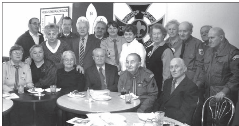
Harcerze-seniorzy z Zaolzia, Cieszyna i Bielska-Białej spotkali się z okazji Dnia Myśli Braterskiej.