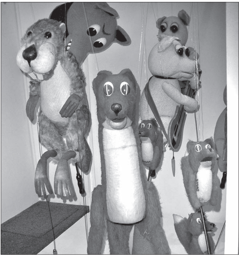
Zwierzątka leśne z bajki „My się wilka nie boimy”.

– Wiesz, teraz, jak pójdę na kolejne przedstawienie teatru lalkowego, będę już pewne rzeczy znał „od kuchni” – powiedział Głosik, gdy wychodzili razem z muzeum. Mądrze to ujął, prawda? Nawet Ludmiłka z uznaniem pokiwała głową... (dc)