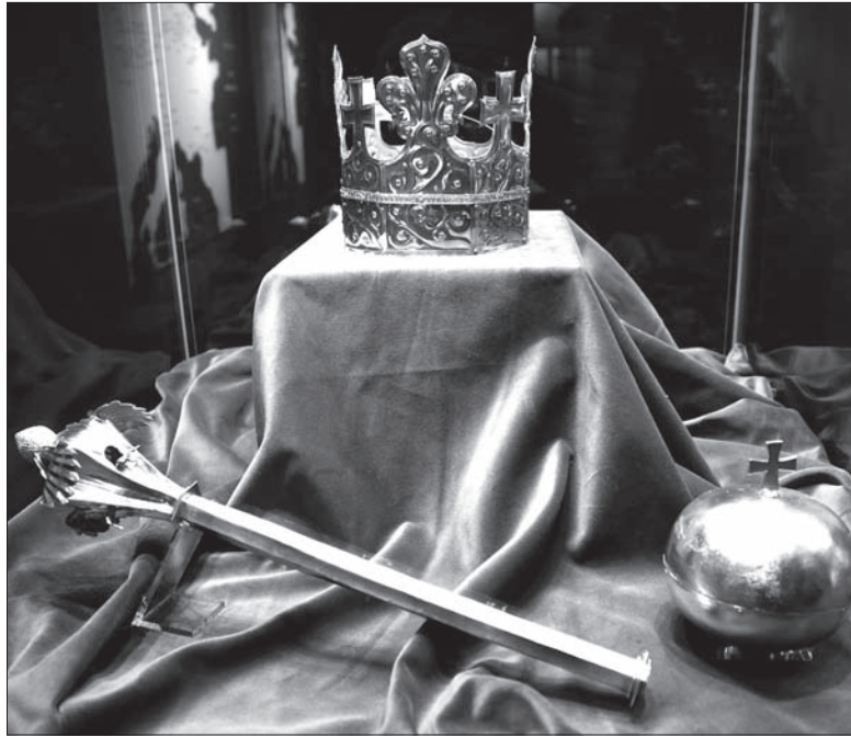
Do cennych eksponatów należą również insygnia pogrzebowe króla czeskiego Przemysła Otokara II.

Oprócz klejnotów przywiezionych z Polski, na wystawie znajdziemy też eksponaty ze skarbcza w niemieckim Akwizgranie – m.in. XIV-wieczną koronę królewską.