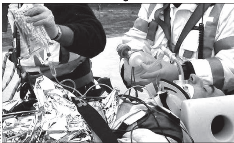
Robert Kubica bezpośrednio po wypadku w Ligurii.