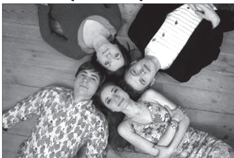
Kwadrofonik zamknie obchody Roku Chopina w Republice Czeskiej.

W najnowszym projekcie Kwadrofonika, „Byłem tu, Fryderyk”,