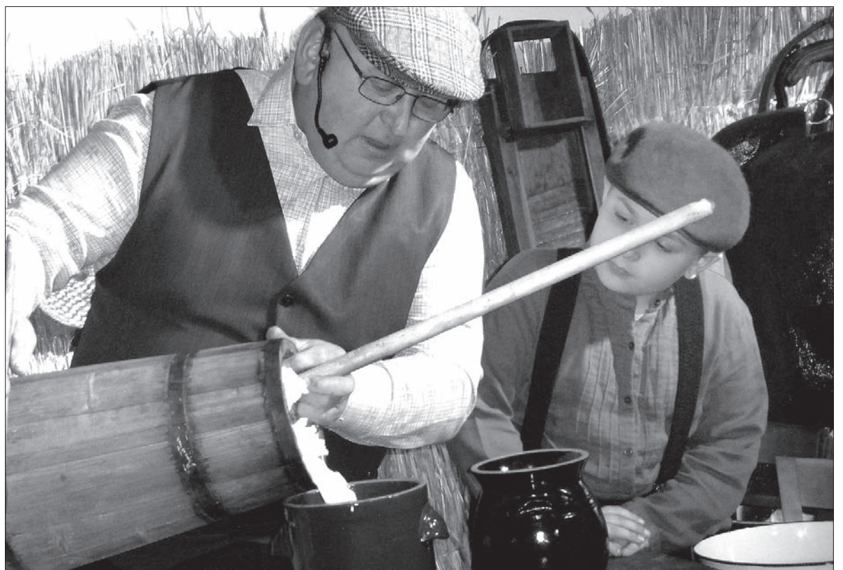
Najpierw trzeba zlać maslanke, a potem wyciągnąć masło z masielnicy.

I już na stole gotowa kolacja. Mlekiem, masłem i serem goszczono również widzów w sali. W przyszłym roku mieszkańcy Ochab przygotują inny pokaz – bo Dzień Tradycji odbył się tu po raz szósty. W poprzednich edycjach było m.in. ochabskie wesele, „szkubaczki” czy świniobicie. Ja bardziej od tłustego mięsa lubię