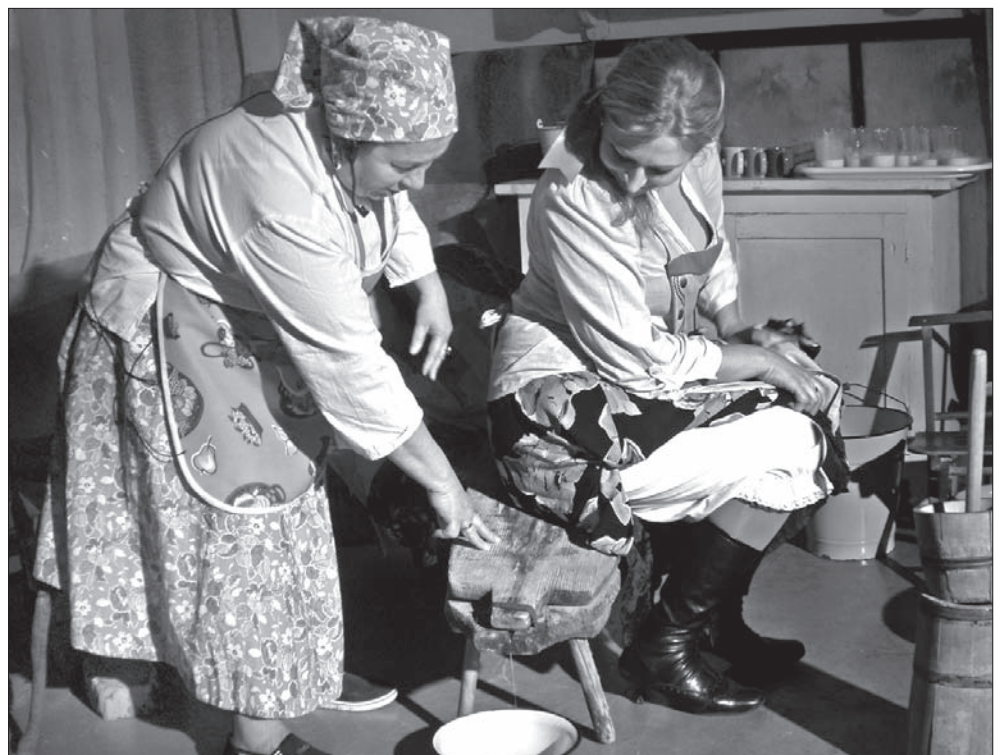
Do wyciskania sera służy specjalna ławka.