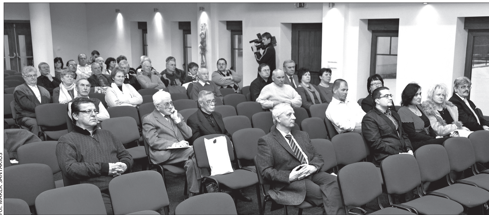
Po zeszytgodniowej konferencji w Trzciniecu pojawiły się nowe pytania i wątpliwości dotyczące Spisu Powszechnego.

REGION: Od kilku dni na stronie internetowej Kongresu Polaków w Republice Czeskiej, www.polonica.cz , dostępna jest elektroniczna wersja logo „Postaw na Polskość”. Może z niej skorzystać każdy, kto chciałby włączyć się w kampanię na rzecz deklarowania polskiej narodowości podczas zbliżającego się Spisu Powszechnego 2011. Na potrzeby kampanii Kongres przygotował też inną „elektroniczną” propozycję.