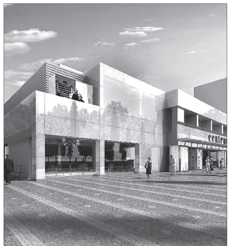
Tak za dwa lata powinno wyglądać hawierzowskie kino „Centrum”.