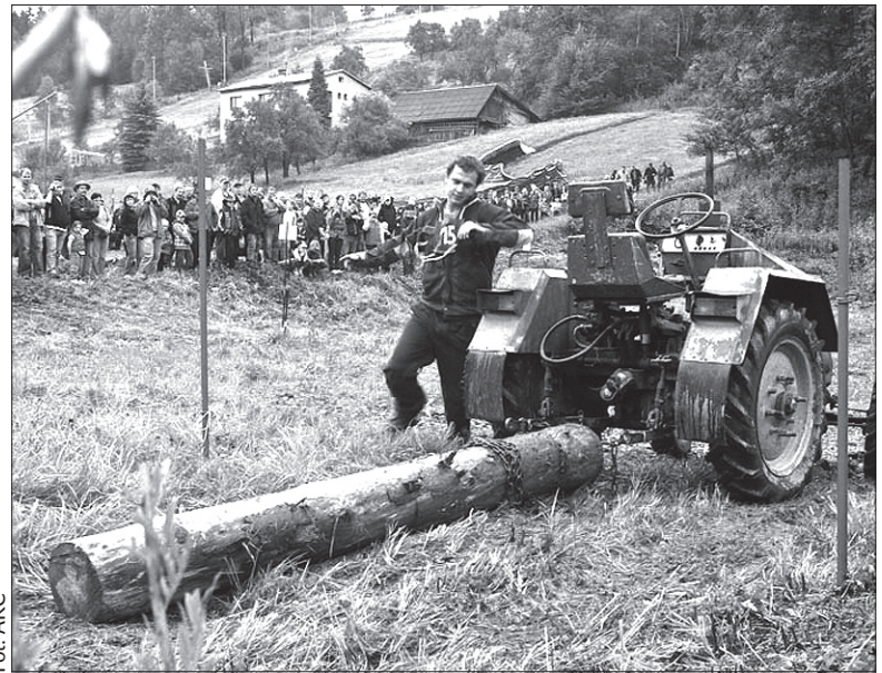
Pekocz Cup odbywa się w Bukowcu tradycyjnie we wrześniu.

nych ciągników. W grudniu zaś małych mieszkańców Bukowca zaprosi na spotkanie św. Mikołaja. Ich rodzice będą mogli natomiast wysłuchać Koncertu Adwentowego. (kor)