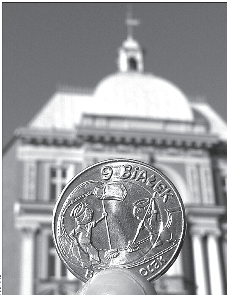
Okolicznościowa moneta z wizerunkiem Bolka i Lolka.

Białkami płacić będzie można w Bielsku-Białej do końca marca, ale tylko w sklepach, galeriach, klubach i lokalach, które przystąpiły do akcji promocyjnej. Równowartość bielskich dukatów w polskich złotych to: wersja mosiężna – sześć złotych,