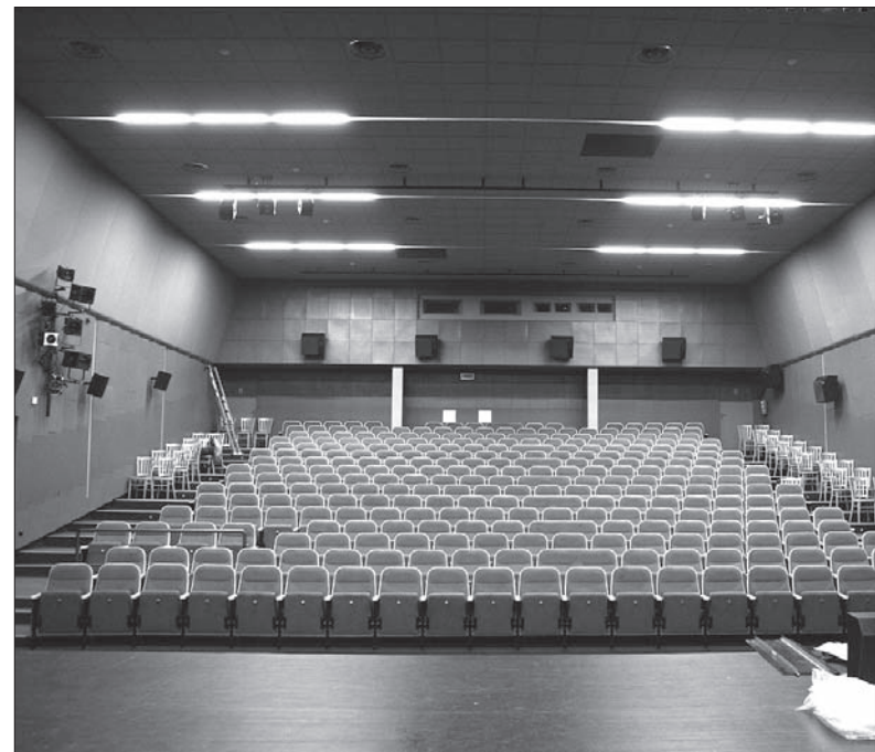
Bogumińskie kino posiada już nowoczesny system do odtwarzania cyfrowego dźwięku.

w którym zakupić można monety, ustawione będzie przy bielskiej ulicy od 11 listopada do 6 lutego – zachęca Krzysztof Drogoszcz. (wib)