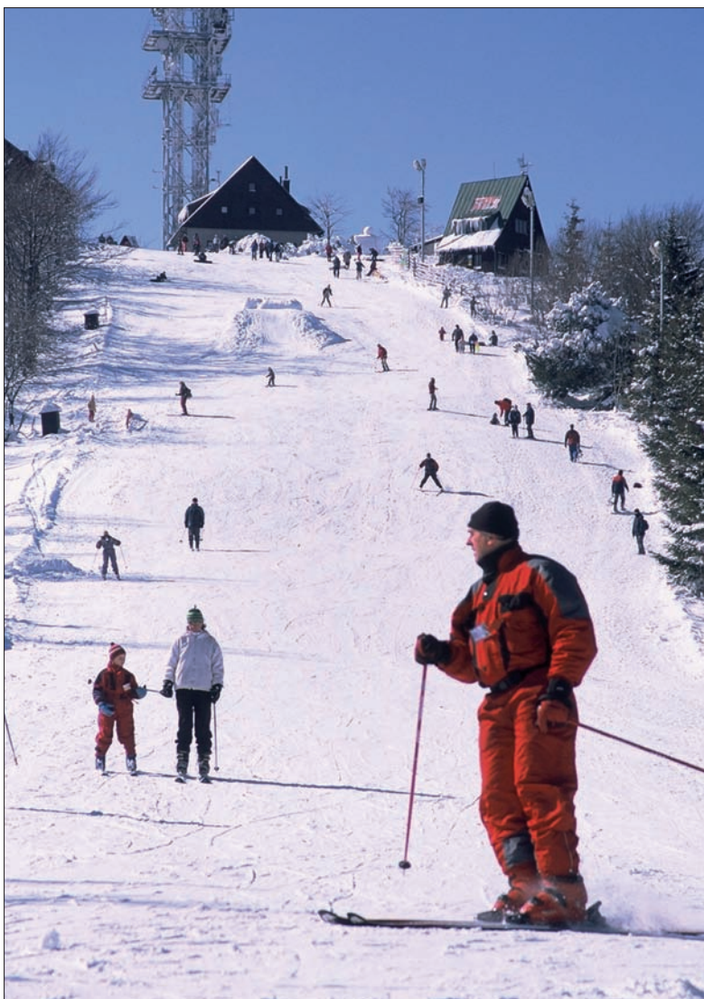
Jaworowy to jedno z ulubionych miejsc nie tylko narciarzy.

Na turystykę stawia natomiast całe SGRJ. – Zrealizowaliśmy kilka ważnych projektów, współpracując z polskimi partnerami, zwłaszcza z władzami Trójwsi, w skład której wchodzi Istebna, Koniaków i Jaworzynka. Powstały trasy dla amatorów rowerów górskich, a także dokładna mapa turystyczna polsko-czesko-słowackiego pogranicza czy całe zaplecze dla turystów na Trójstyku,