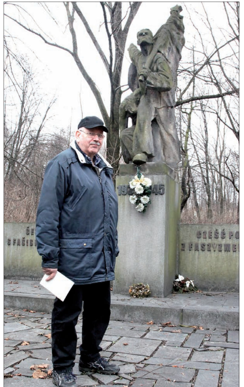
Pomnik przy głównej drodze na Ostrawę przypomina ofiary II wojny światowej. Nazwiska poległych umieszczono z tyłu pomnika.