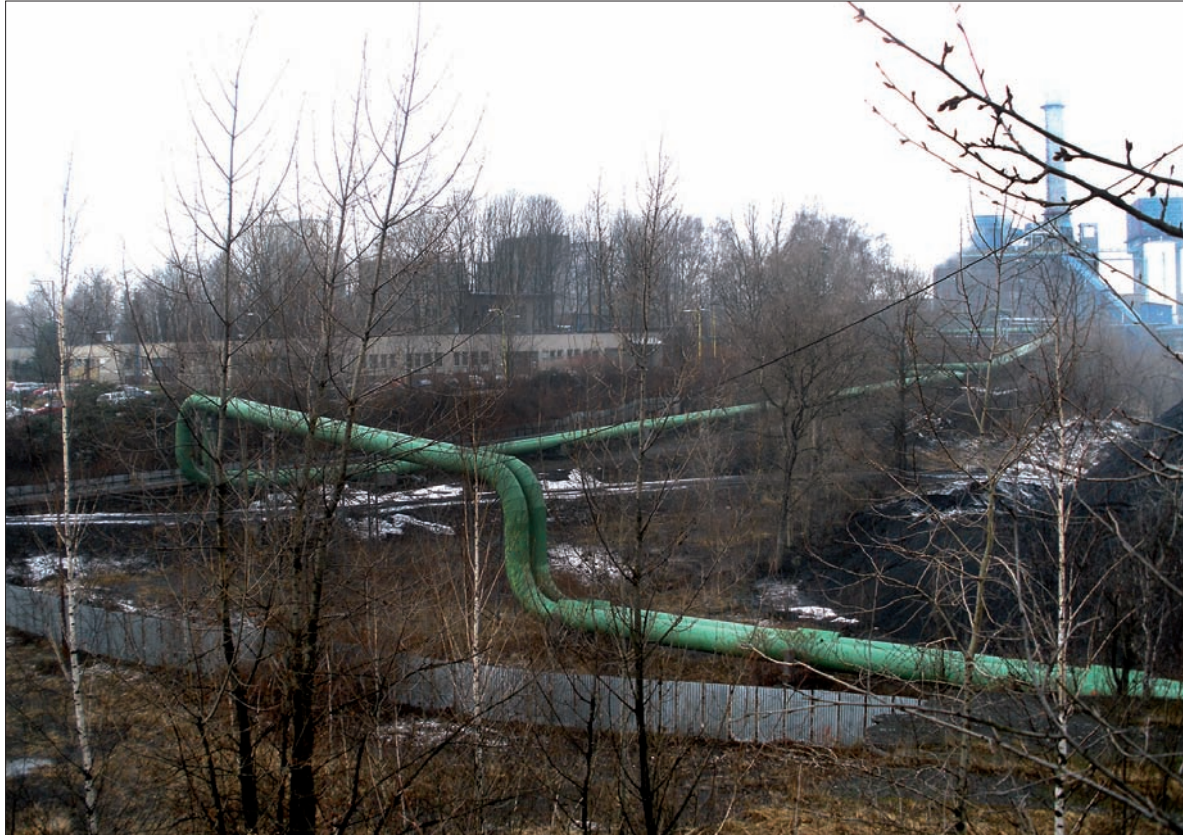
Nieciekawa okolica Kopalni Armii Czesosłowackiej to dawny Żabków, gdzie Morcinek spędził najwcześniejsze lata dzieciństwa.

Gdy mały Gustlik miał niespełna rok, jego ojciec zginął. Spadł z koła pod koła własnego wozu. Wdowa z dziećmi przez jakiś czas mogła zostać na Żabkowie, później musiała opuścić służbowe mieszkanie. Wynajmowała później lokum w domu pewnego muzykanta na Granicach. Tego domu, podobnie jak innych w okolicy, też już dawno nie ma. Zarośla i stawy, które powstały po wydobyciu węgla – tak wyglądają dawne Granice, przylegające do Dąbrowy. Nie mają nic wspólnego z dzisiejszą, nowo wybudowaną dzielnicą Karwi-