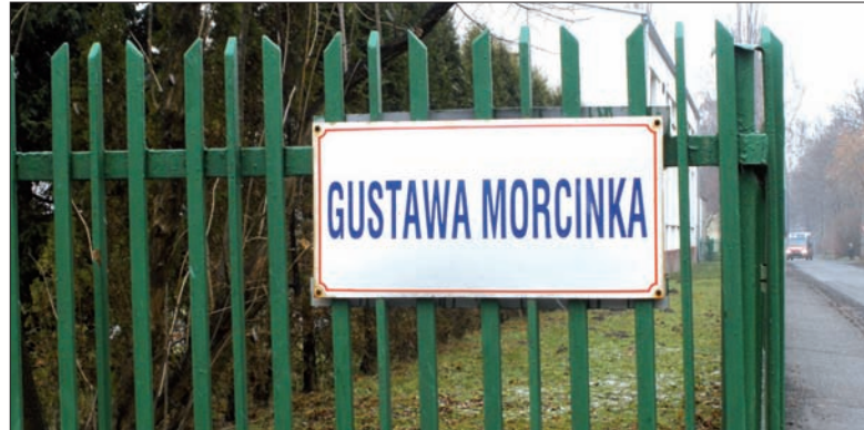
Gustawa Morcinka przypomina ulica w Karwinie-Nowym Mieście.