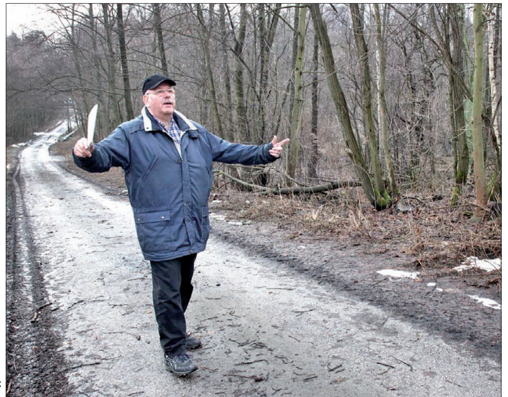
W tym miejscu była gospoda u Mokrosza.