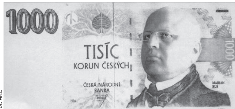
Tego rodzaju banknoty rozdawano na czwartkowej konferencji prasowej. Na taką właśnie gratyfikację może podobno liczyć każdy sygnatariusz petycji...