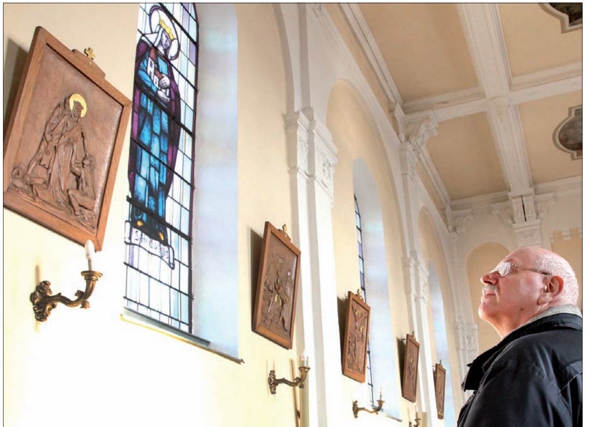
Odnowione stacje Drogi Krzyżowej w świątyni na cierlickim Kościelcu.