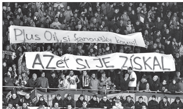
Dziś na stadionie w Hawierzowie spodziewane są duże emocje. Drużyna Az-u podejmuje w derbach ekipę Orłowej. Tak właśnie potrafią kibicować fani Hawierzowa.

Lokaty: 1. Szumperk 74, 2. Hawierzów 66, 3. Orłowa 66, 4. Nowy Jiczyn 55, 5. Przerów 53, 6. Prościejów 53 pkt. (jb)