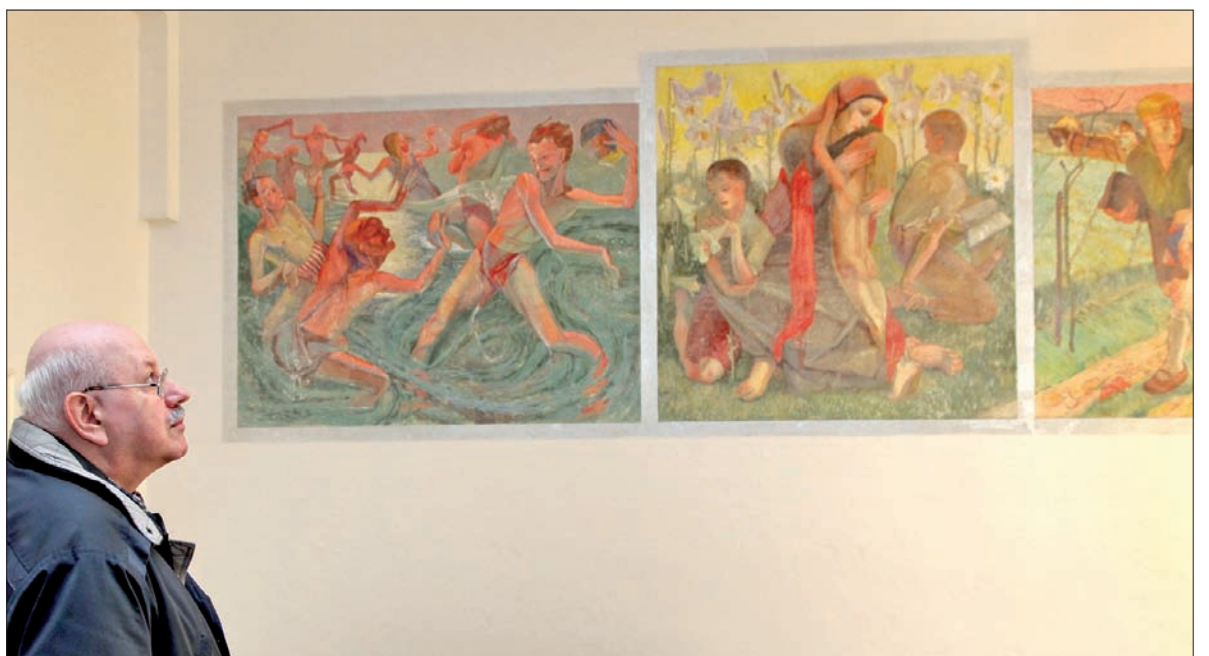
Tryptyk na ścianie auli górnosuskiej szkoły przez pięćdziesiąt lat pokrywała farba.