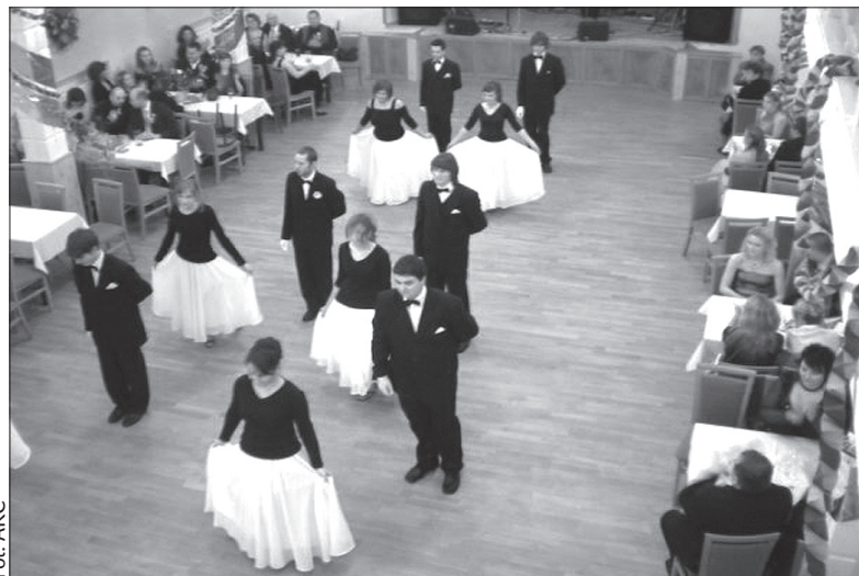
Miejscowy zespół taneczny otwiera zawsze ligotczański bal polonezem. Zdjęcie z ubiegłego roku.