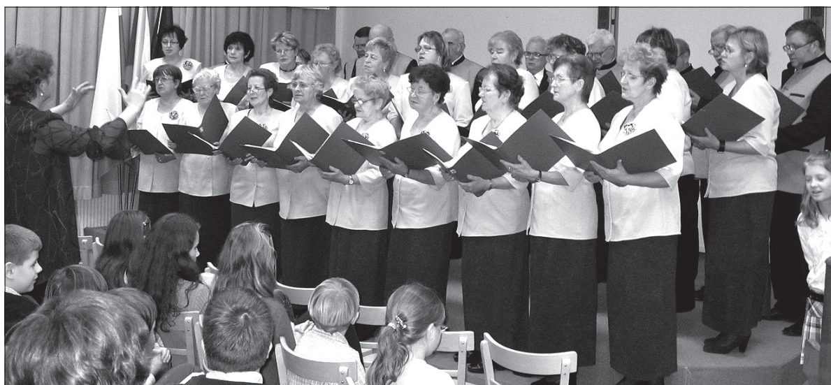
Chór „Sucha” podczas jednego ze swoich występów.