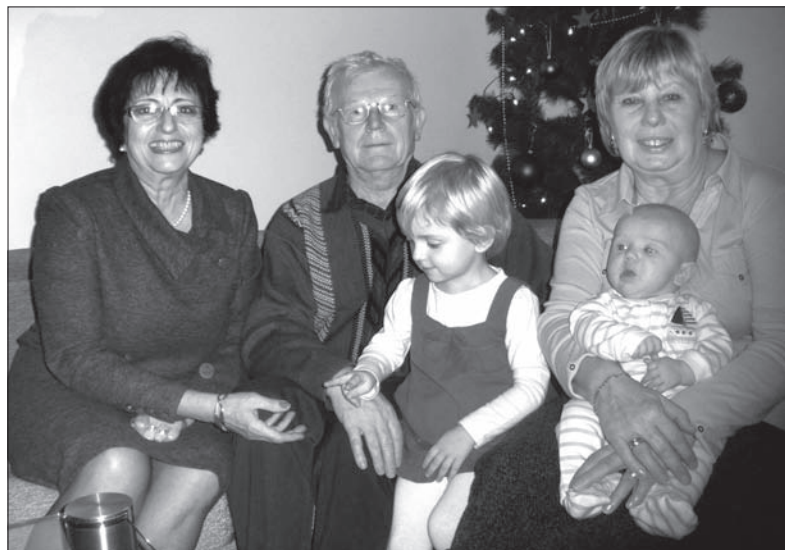
Zdjęcia: DANUTA CHLUP

A jaka jest rola dziadka? – Budujemy razem ZOO z klocków lego – informuje Lenia. – Babcia z Radomia przywiozła taki duży domek i teraz muszę w nim siedzieć, jak niby piesek – nie wstydzi się przyznać dziadek Józef. DANUTA CHLUP