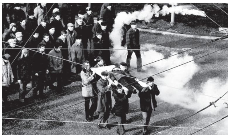
Kadr z filmu „Czarny czwartek”.