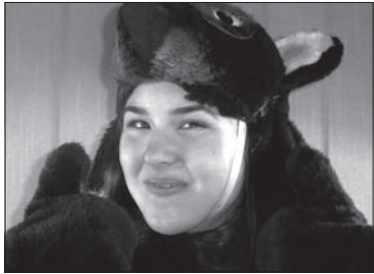
próby, ale ogólnie jest fajnie. Aktorka, która gra Królową Śnieżkę, jest bardzo miła.

Już pojutrze Scena Polska Teatru Cieszyńskiego wystawi premierowo sztukę „Królowna Śnieżka”, którą na podstawie baśni braci Grimm napisali Jerzy Rakowiecki i Jerzy Wittlin. Reżyserem jest Karol Suszka. Przedstawienie rozpocznie się o godz. 17.30. W niedzielę, o tej samej godzinie, będzie powtórka premiery. Jeśli macie ochotę wybrać się na przedstawienie z rodzicami, to powiedzcie im, by jak najprędzej zarezerwowali bilety, bo zainteresowanie będzie na pewno duże. Głosik i Ludmiłka nie mogą się już doczekać chwili, gdy zobaczą na scenie Królową Śnieżkę, Królewicza, Krasnali... Dlatego w poniedziałek po południu poszli przynajmniej zobaczyć, jak wygląda próba. Spotkali tam dzieci z polskich szkół w Bystrzycy, Czeskim Cieszynie, Wędrzynie, Gnojniku i Karwinie, które będą występowały w rolach zwierzątek leśnych oraz najmniejszych krasnoludków. Właśnie po raz pierwszy założyły stroje, w których będą grały. Te, które akurat miały trochę czasu, poopowiadały im o swej przygodzie z teatrem.