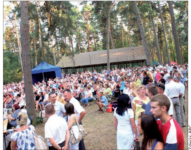
Gorolski Święto? Nie, to „Siabrouskaja Biasieda” w Gródku na granicy polsko-białoruskiej.