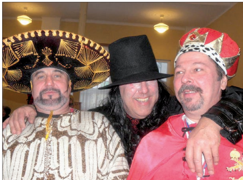
Mieszkańcy Milíkova koło Mariańskich Łaźni lubią się wspólnie bawić. Zdjęcie pochodzi z zeszłorocznego gminnego karnawału.

Dawniej niemiecką, dziś czeską wsią jest również Milíkov, leżący w powiecie chebskim, niedaleko Mariańskich Łaźni. To mała miejscowość, mniejsza od podbeskidzkiego Mili-