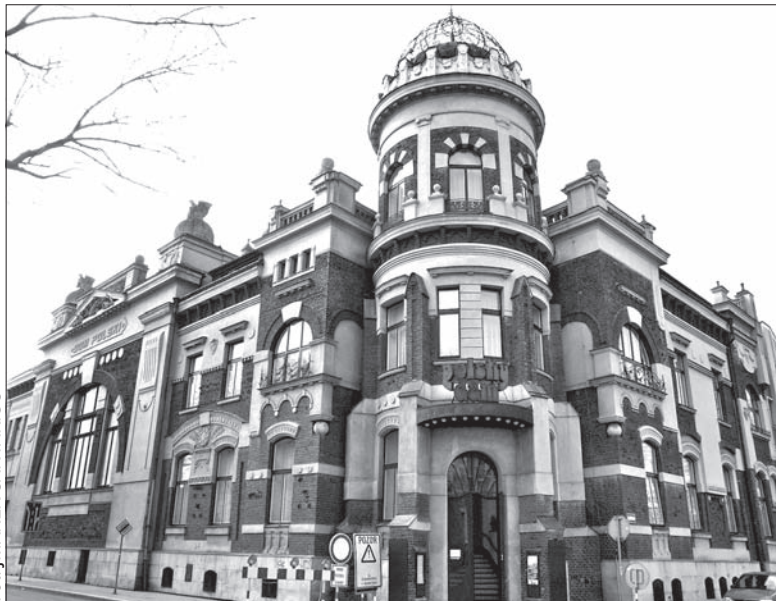
Dom Polski w Ostrawie.