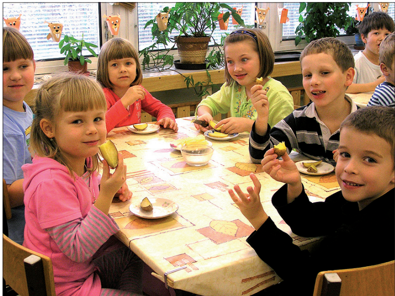
Tradycyjna szkolna impreza, czyli ubiegłoroczne Święto Ziemniaka.

Szkoła Podstawowa z Polskim Językiem Nauczania Czeski Cieszyn ul. Polna 10 (klasy elokowane PSP Czeski Cieszyn ul. Havlička) tel.: 558 740 432 e-mail: ruckova@zsptesin.cz