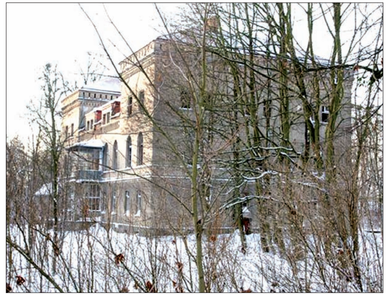
Wędryński zamek był niegdyś chlubą wsi.

jący kompleks parkowo-pałacowy. Czytając historię pałacu, stojącego w pięknym parku (zarówno pałac, jak i park wpisane są na listę zabytków), pomyślałam o zamkach w Ropicy czy Gnojniku, wciąż czekających na inwestora, który przywróciłby im dawną świetność.