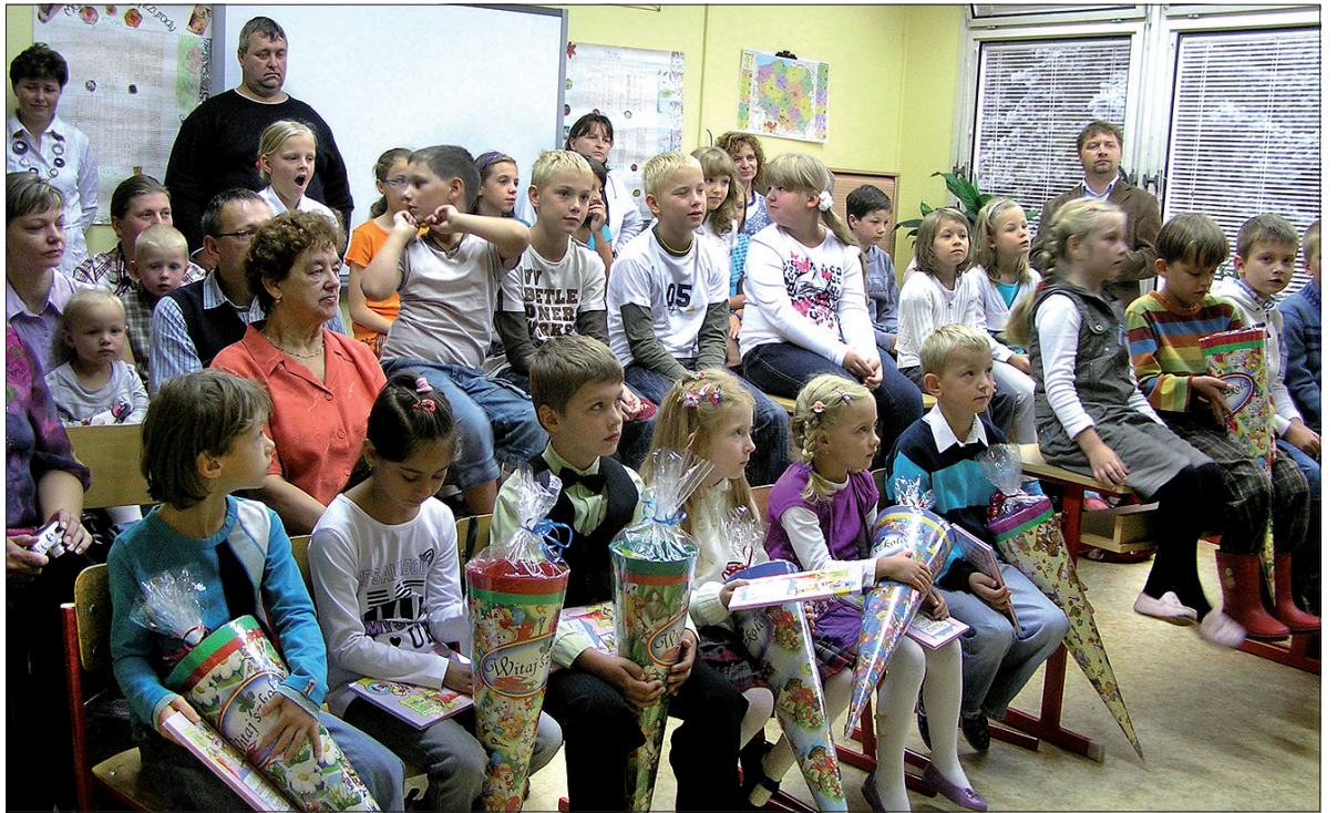
Rozpoczęcie roku szkolnego 2010/2011.

Przy Polnej uczniowie mają do dyspozycji dwie sale lekcyjne, klasopracownię komputerową, małą salę gimnastyczną oraz świetlicę szkolną, z kolei na zewnątrz czekają na nich ogród oraz nowe boisko. Na lekcjach korzysta się też często z tablicy interaktywnej, zakupionej kilka lat temu przez Konsulat Generalny RP w Ostrawie. Dla uczniów 1. i 2. klasy jest prowadzone kółko języka angielskiego, dla starszych uczniów jest kółko komputerowe, odbywają się też zajęcia aerobiku, na które chodzą dziewczynki. Ale szkoła to oczywiście nie tylko nauka. Wiele imprez jest organizowanych przy współpracy Macierzy Szkolnej. Tradycyjnie odbywają się co roku na przykład Mikołaj, wigilijka, balik, kulig, festyn, różne wycieczki, zielona szkoła. W tym roku szkolnym dzieci czeka również noc w szkole z ciekawym programem. Dzieci występują też na zebraniach czy imprezach Kół PZKO w Sibicy