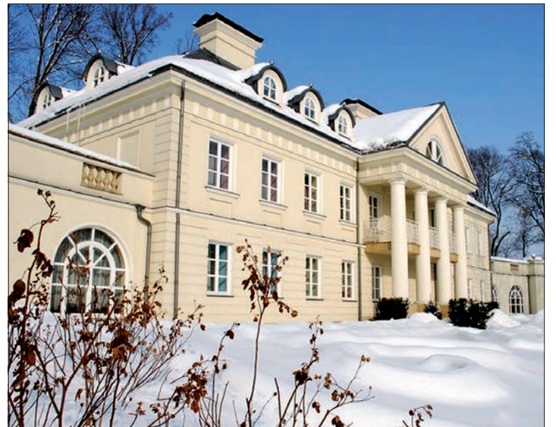
W Śmiłowicach odrestaurowano pałac, który był kompletną ruiną.

Morawskie Oldřichovice mogą się pochwalić nowym kościołem