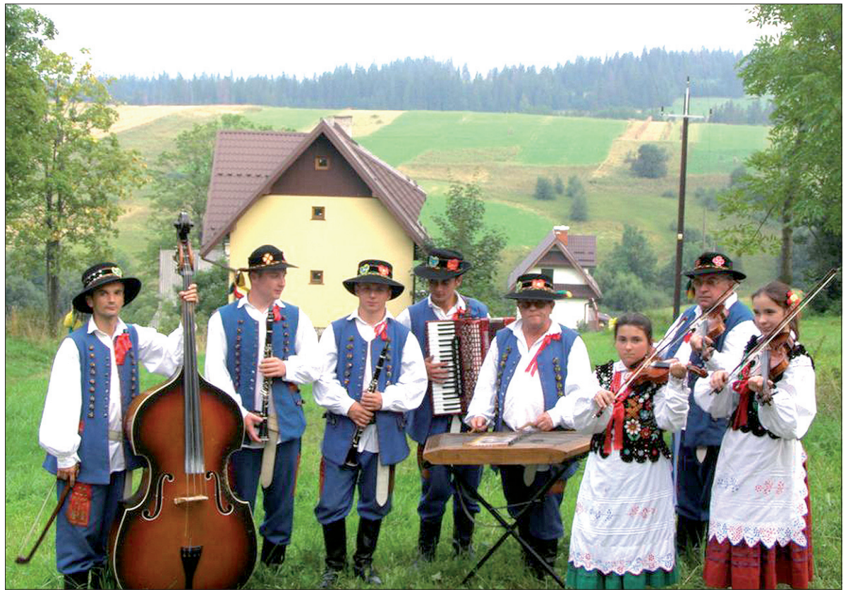
W Nawsiu w Rzeszowskim działa kapela ludowa, lecz większość młodzieży nie interesuje się folklorem.

kowa. Składa się z czterech małych wiosek i liczy w sumie ok. 260 mieszkańców.