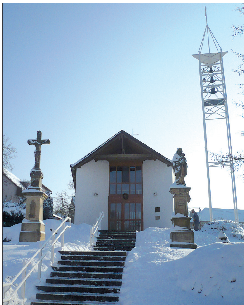
Kościółek św. Zdzisławy w Oldřichovicach niedaleko Zlina.

Zaolziańska wioska leżąca pod Głodulą ma imienniczki zarówno w Czechach (w powiecie Rakovník i Mladá Boleslav), jak i w Polsce. Tam udało mi się znaleźć trzy nieduże miejscowości o nazwie Śmiłowice. Najbardziej zainteresowała mnie wioska wchodząca w skład gminy Nowe Brzesko w Małopolsce, położona na trasie między Krakowem a Sandomierzem. Po pierwsze dlatego, że liczy mniej więcej tyle samo mieszkańców, co zaolziańskie Śmiłowice (ok. 600), ale głównie ze względu na odnowiony, wspaniale się prezentu-