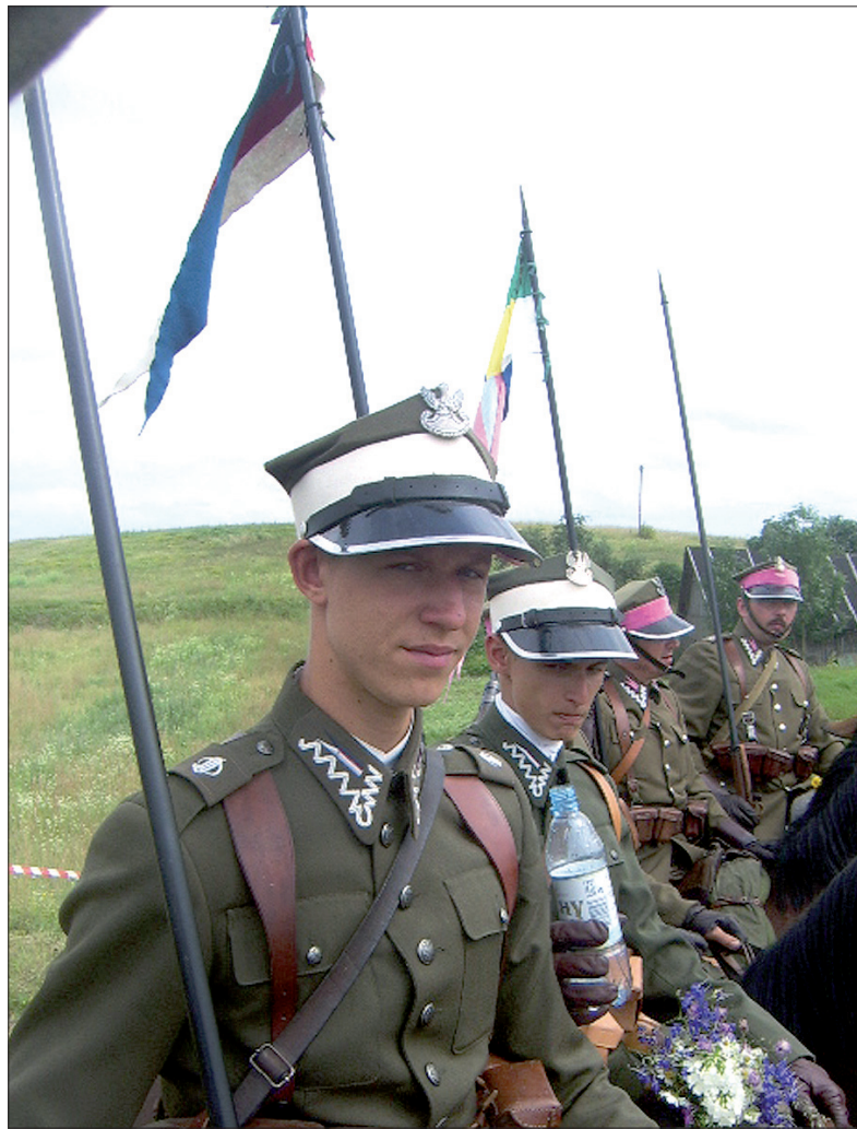
Pod Bukowcem odbywa się co roku rekonstrukcja bitwy z 3 września 1939 roku.

Jest też Bukovec w Czechach, w powiecie Domažlice. To typowa