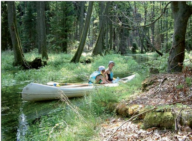
Spyw kajakowy rzeką Brdą prowadzi przez Trzyńciec.

Swojego imiennika ma w Polsce hutniczy Trzyńciec. Z tym, że małą wioską o tej nazwie, będącą jednym