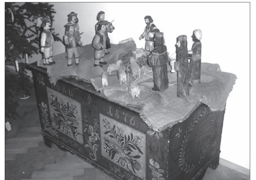
Na przedświątecznych wystawach często można zobaczyć szopki artystów ludowych. Na zdjęciu szopka Pawła Kufy z Mostów koło Jabłonkowa.

W ramach cyklu imprez pt. „Bożonarodzeniowe Drzewko” odbędzie się Jarmark „Świętomikołajowy” z