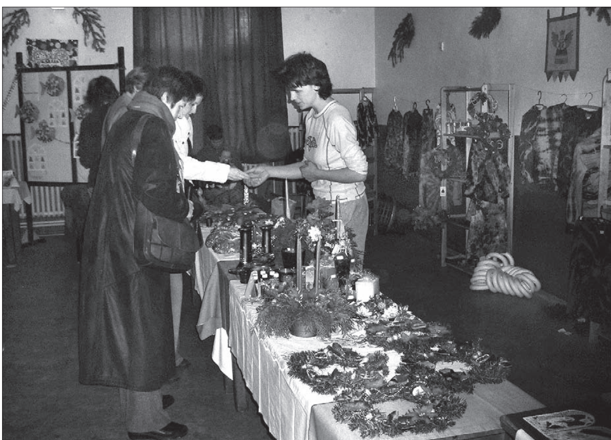
Z wystawy w Mostach koło Jabłonkowa.