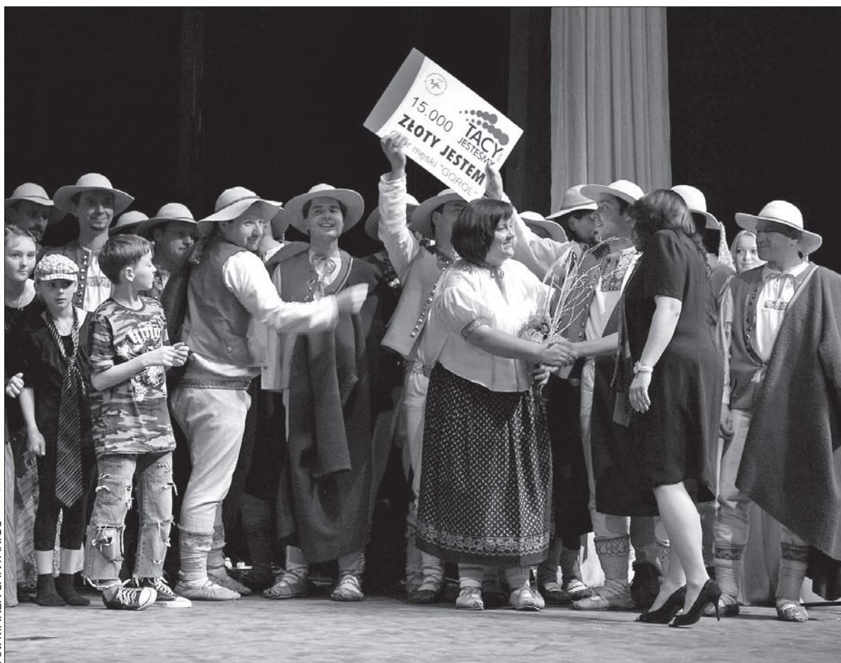
Zdjęcie z gali finałowej Tacy Jesteśmy 2010.