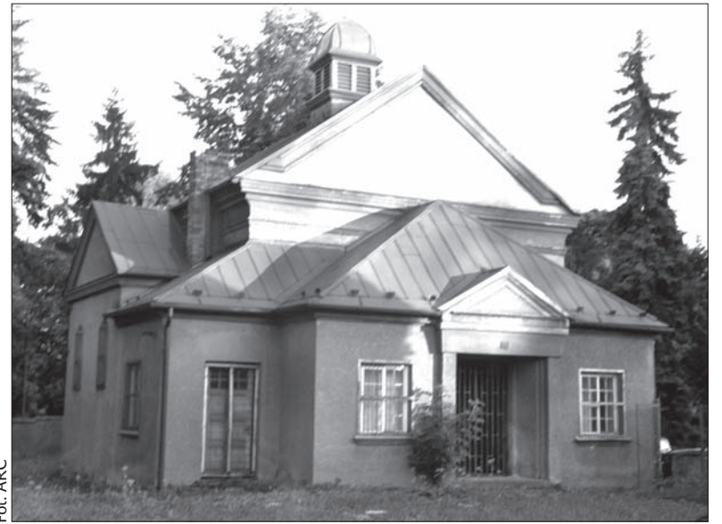
Czeskokocieszyńska świątynia luterańska.

Za wiedzą naszego biskupa zwróciliśmy się do różnych instytucji i władz kościelnych z prośbą o pomoc