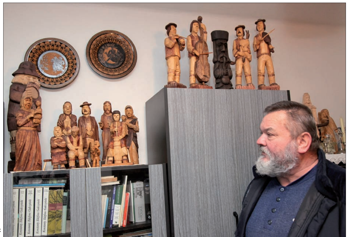
Dom w Nawsiu jest pełen pamiątek.