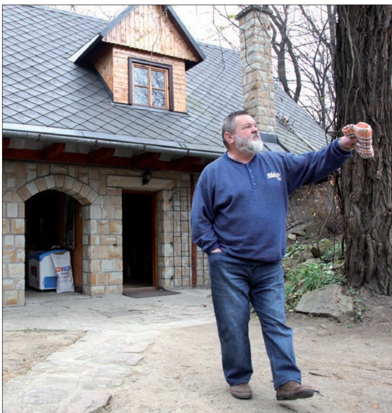
Belko w Gródku – pięć dni po imprezie „Kosztowani samogóny”.