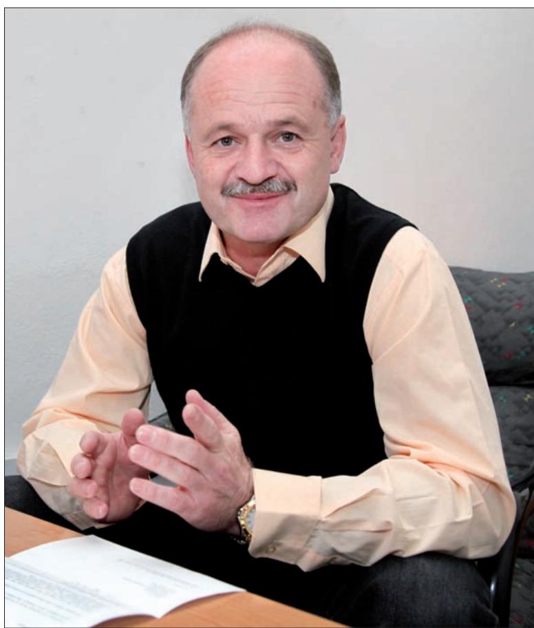
Senator Petr Gawlas w redakcji „Głosu Ludu”.

Gawlasowi za tę interwencję – powiedział nam wiceprezes Kongresu i szef jego Komisji Szkolnej, Tadeusz Wantuła. – Nowy senator zadeklarował pomoc dla polskiej mniejszości już przed wyborami i widać, że podjął w tej sprawie już pierwszy krok.