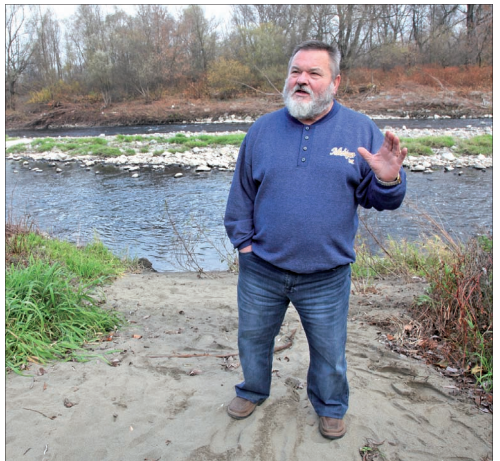
Nad Olzą, w miejscu, gdzie kiedyś stała prowizoryczna przeprawa.