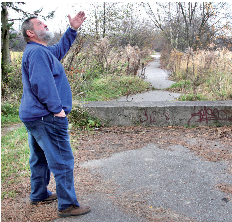
Jedna ze starych ulic w Łąkach, w części zwanej Stawy.

Chciał być doktorem, wyszło trochę inaczej. Pracował jako mechanik samochodowy w Koprzywnicy, później