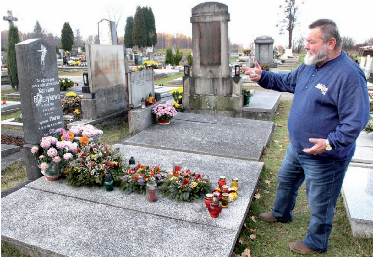
Przy grobowcu rodzinnym.