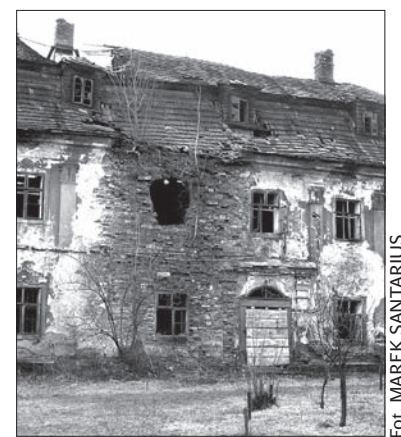
Ruiny ropickiego zamku.

Rosová z Narodowego Instytutu Zabytków w Ostrawie, poświęcony będzie historii i współczesności tych najbardziej znaczących zabytkowych obiektów Śląska Cieszyńskiego. (o)