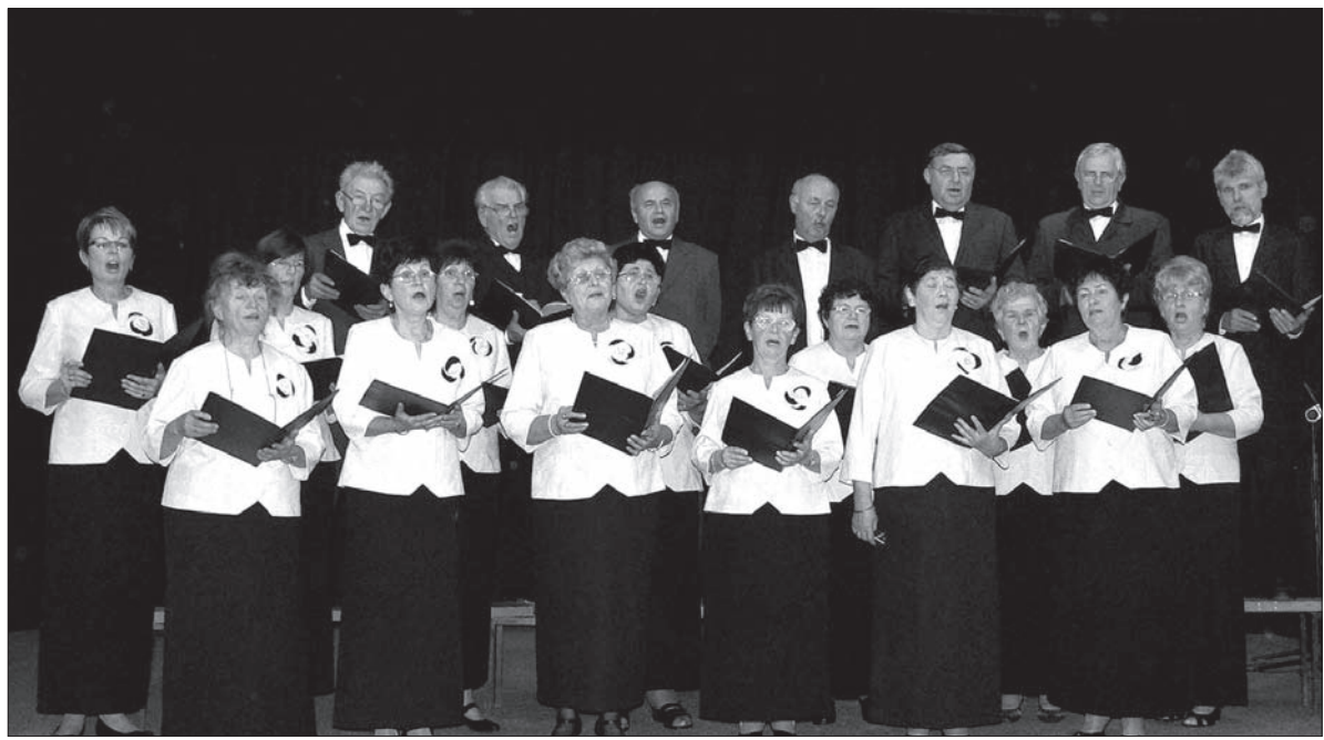
Jubileuszowy występ chóru.