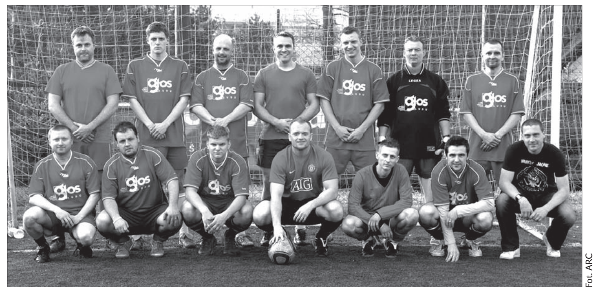
Ekipa „Głosu Ludu”.