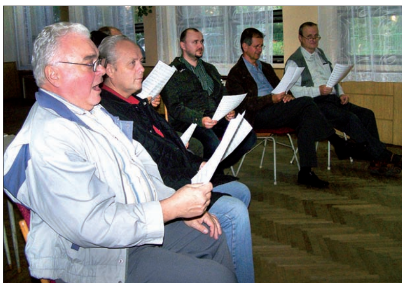
Mały męski zespół wokalny na próbie.

– To odmłodzenie Koła na pewno nam pomoże – kontynuuje prezes. – My, starsi, przywykliśmy do tradycyjnych form pracy PZKO-wskiej, co nie zawsze już odpowiada młodszemu. Ale to nie oznacza, że „starszacy” chcieliby złożyć broń. Nadal organizujemy też swoje imprezy.