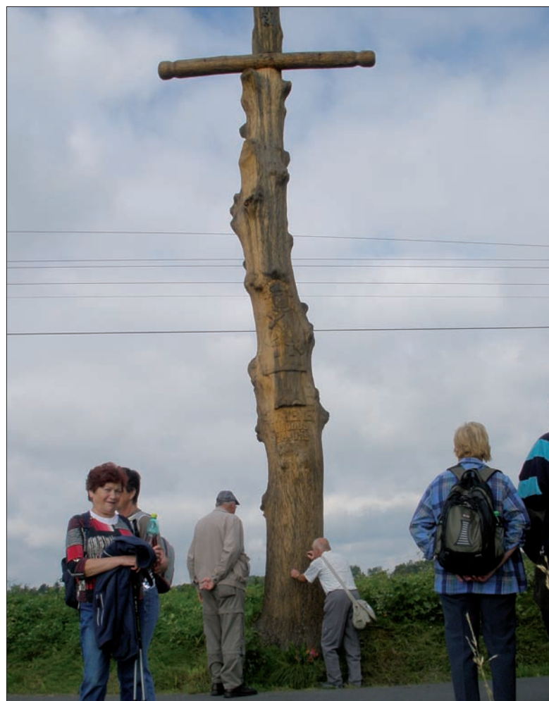
Oryginalny 9-metrowy krzyż z wizerunkiem św. Jana Nepomucena.

Dochodzimy do ronda przed dworcem kolejowym. Rozstajemy się z rzeką, która dalej zmierza przez Szonów do Ostrawy, by pod Zamkiem Śląskoostrawskim połączyć się z Ostrawicą.