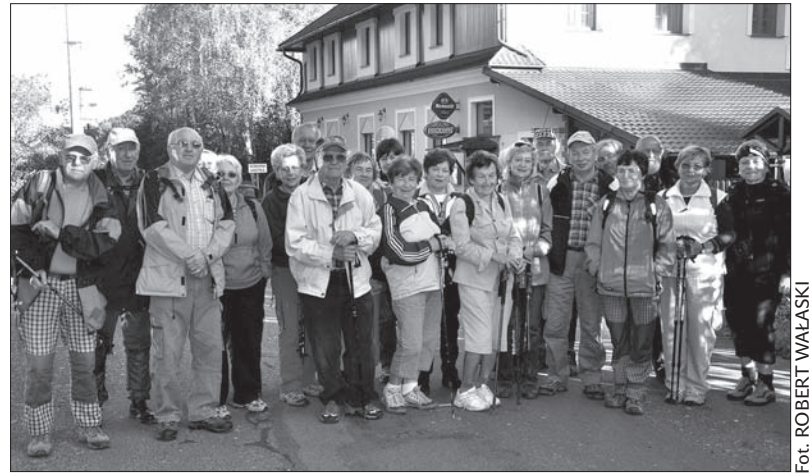
Pamiątkowe zdjęcie z wtorkowej wycieczki.

rystów były skierowane na Ropiczkę i Godulę. Na Goduli w jesiennych promieniach słonecznych turyści wypoczęli, każdy według swoich możliwości – niektórzy na ławeczkach, inni grając w kręgle. Wielu było na tej trasie po raz pierwszy. Wtorkową wycieczkę „beskidowcy” zakończyli ponownie w Ligotce Kameralnej. (kor)