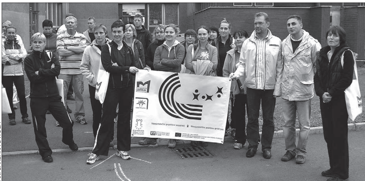
Uczestnicy pierwszego spotkania wuefistów w ramach projektu Transgraniczna Akademia Sportowa.

zwłaszcza w dziedzinie działań sportowych. Projekt jest dofinansowany ze środków Funduszu Mikroprojektów Euroregionu Těšínské Slezsko – Śląsk Cieszyński w ramach Programu Operacyjnego Współpracy Transgranicznej Czeska Republika – Rzeczpospolita Polska 2007-2013. (kor)