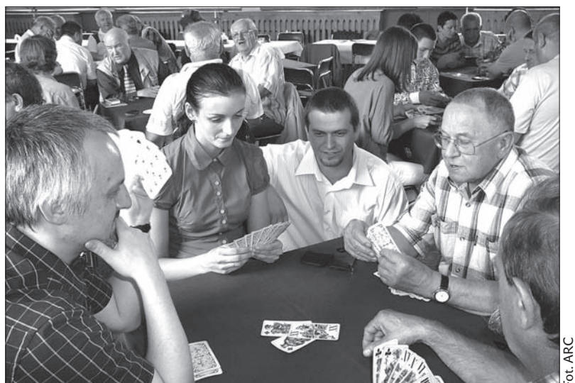
Pierwszy z turniejów w ramach projektu „Taroki – gra o tożsamość” odbył się 6 sierpnia br. w polskim Zabrzegu. Przy jednym stoliku zasiedli młodzi i starsi gracze.