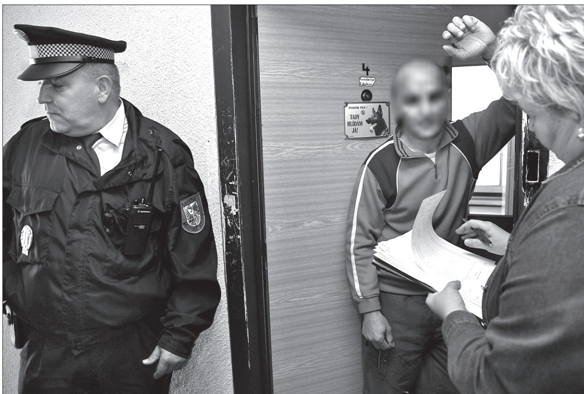
Pracownica spółki RPG sprawdza, czy lokator legalnie zajmuje mieszkanie. Z lewej strażnik miejski, przydzielony do pracy w dzielnicy zamieszkałej w dużym stopniu przez osoby wykluczone społecznie.