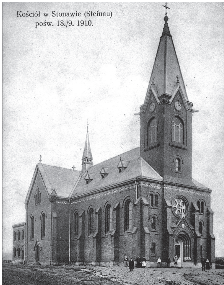
Kościół w Stonawie (Steinau) pośw. 18./9. 1910.

Obchody 100-lecia rozpoczną się już w sobotę, w wigilię jubileuszu, o godz. 17.00 uroczystą mszą św. w języku polskim, po której nastąpi koncert muzyki cerkiewnej w wykonaniu chóru Kozaków z Uralu Borodino. To fantastyczny, znany w całej Europie męski zespół wokalny. W niedzielę o godz. 8.00 rozpocznie się msza św. w języku czeskim, a o godz. 10.00 zostanie odprawiona uroczysta suma pontyfikalna z udziałem ks. bp. Františka Václava Lobkowicza z Ostrawy. Po