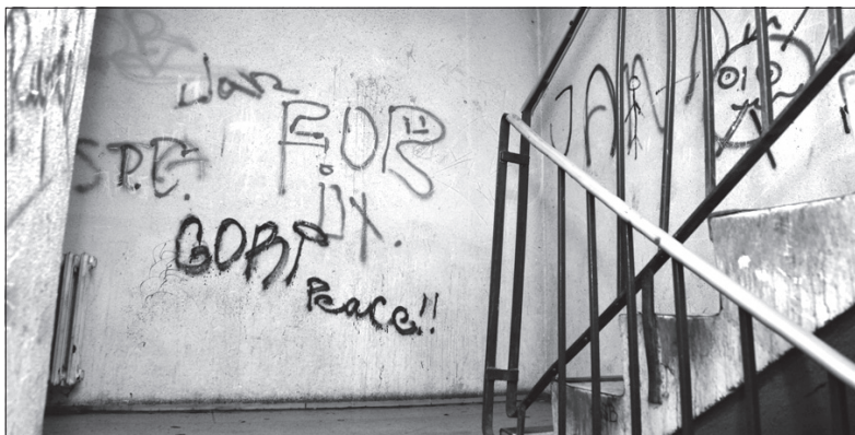
Tak wygląda klatka schodowa w „domu grozy” przy ul. Makarenki w Karwinie.

dzień: 15 do 19 °C noc: 10 do 6 °C wiatr: 2-6 m/s