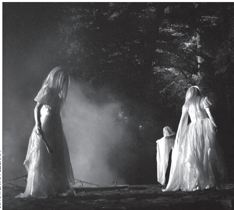
Scena Polska zagra „Makbeta” na Wzgórzu Zamkowym w ramach imprezy „Skarby z cieszyńskiej tróły”.

Dodajmy, że bilety w cenie 50 koron będzie można nabyć przed spektaklem. (kor)