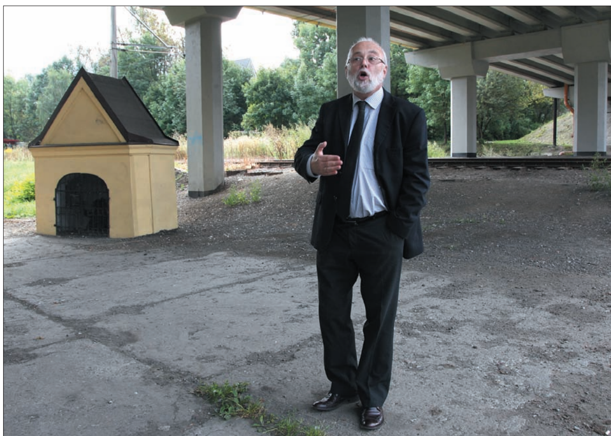
Ta kapliczka była dla skażąców ostatnim przystankiem w drodze na Górę Szubieniczną...