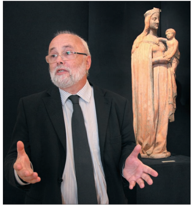
Gotycka Madonna z Dzieciątkiem stała przez wieki na Starym Targu.