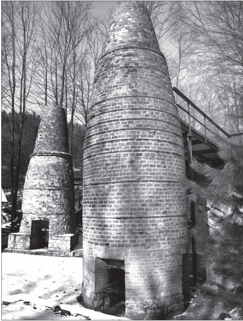
Piec wapienne z XIX wieku – symbol i chluba gminy.

Najlepiej w tych dniach poruszać się pieszo lub na rowerze – a i to po deszczu może przysporzyć kłopotu. Trudno tu mówić o zwiedzaniu, ale spacer po Wędrynie zaczniemy od centrum. Najprościej tu dotrzeć, bo to zaraz koło dworca, przystanek autobusowy też jest, a dla zmotoryzowanych – zrobiony z rozmachem parking, który lubi świecić pustkami. Owe centrum jest dosyć skromne – sklepy mięsne i spożywczy, salon z