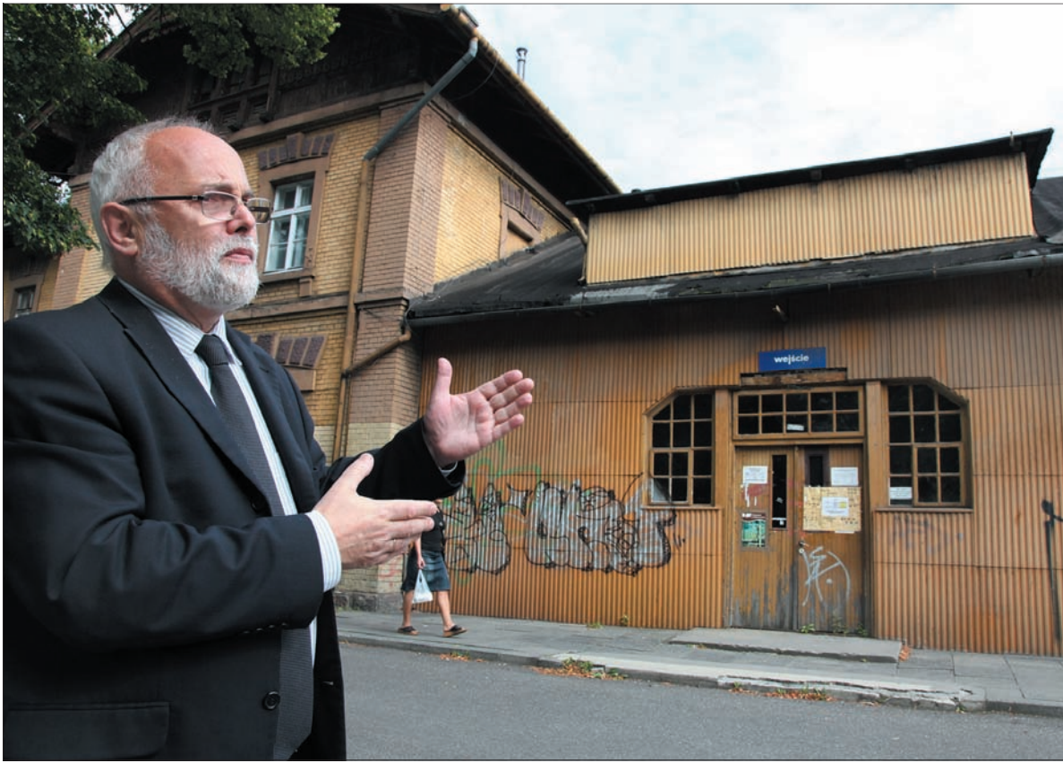
Gdyby ten dworzec wyremontować, mógłby być cackiem.