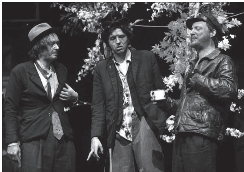
W ubiegłym roku Klimsza przywiózł nad Olzę spektakl „Brenpartija”.

czesnej polskiej literatury dramatycznej. W ciągu dwóch dekad udało nam się wystawić tak istotne sztuki, jak „Miłość na Krymie” Mrożka, „Ślub” Gombrowicza czy „Prorok Iłja” Słobodzianka... W tym sezonie w naszym teatrze przygotowujemy adaptację znanej książki Mariusza Szczygła „Gottland”. Ta książka, napisana przez polskiego dziennikarza, jest refleksją na temat czeskiego życia kulturalnego w wieku dwudziestym, wzbudziła furorę wśród czeskich czytelników i w mgnieniu oka doczekała się następnego wydania. Reżyserem będzie niezwykle wysoko ceniony przez krytykę młody twórca, Honza Mikulášek, na stałe współpracujący z naszym teatrem. Notabene jest on wnukiem Oldřicha Mikuláška, klasyka dwudziestowiecznej poezji czeskiej.