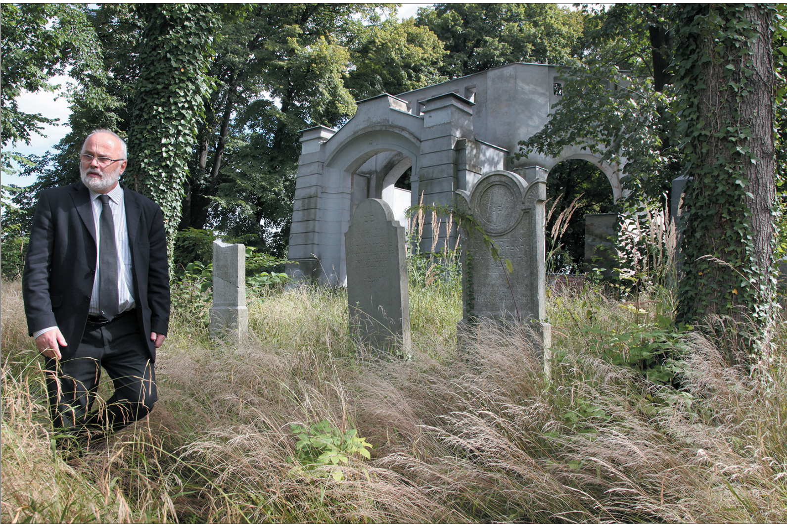
Cmentarz żydowski może się dziś kojarzyć raczej z Pompejami lub Herkulanum.