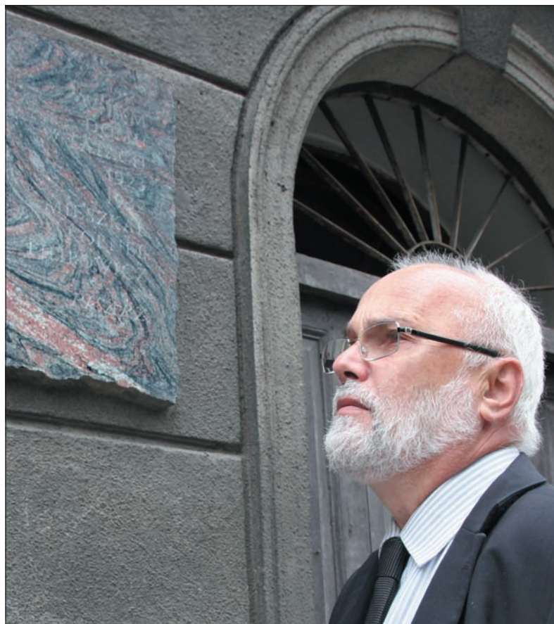
Ta tablica przypomina pisarza Kornela Filipowicza.

Mówi, że Filipowicz powracał przez całe życie do Cieszyna. Tutaj byli pochowani jego ojciec i babcia. – W latach 80. mogłem się z nim spotykać, nawet gościłem go u siebie. Znalazłem tak klucz do wielu jego opowiadań. A zasługują one na ciągłą lekturę, są niezwykle ascetyczne w formie i zwięzłe, ale też nakierowane na rzeczywistość, widać w nich szacunek wobec opisywanego przedmiotu. Filipowicz uchodzi za jednego z najwybitniejszych prozaików polskich XX wieku. Warto go czytać, zwłaszcza nad Olzą, bo on dla promocji Cieszyna zrobił więcej, niż wszyscy kierownicy miejscowych instytucji kultury razem wzięci – podkreśla konsul.