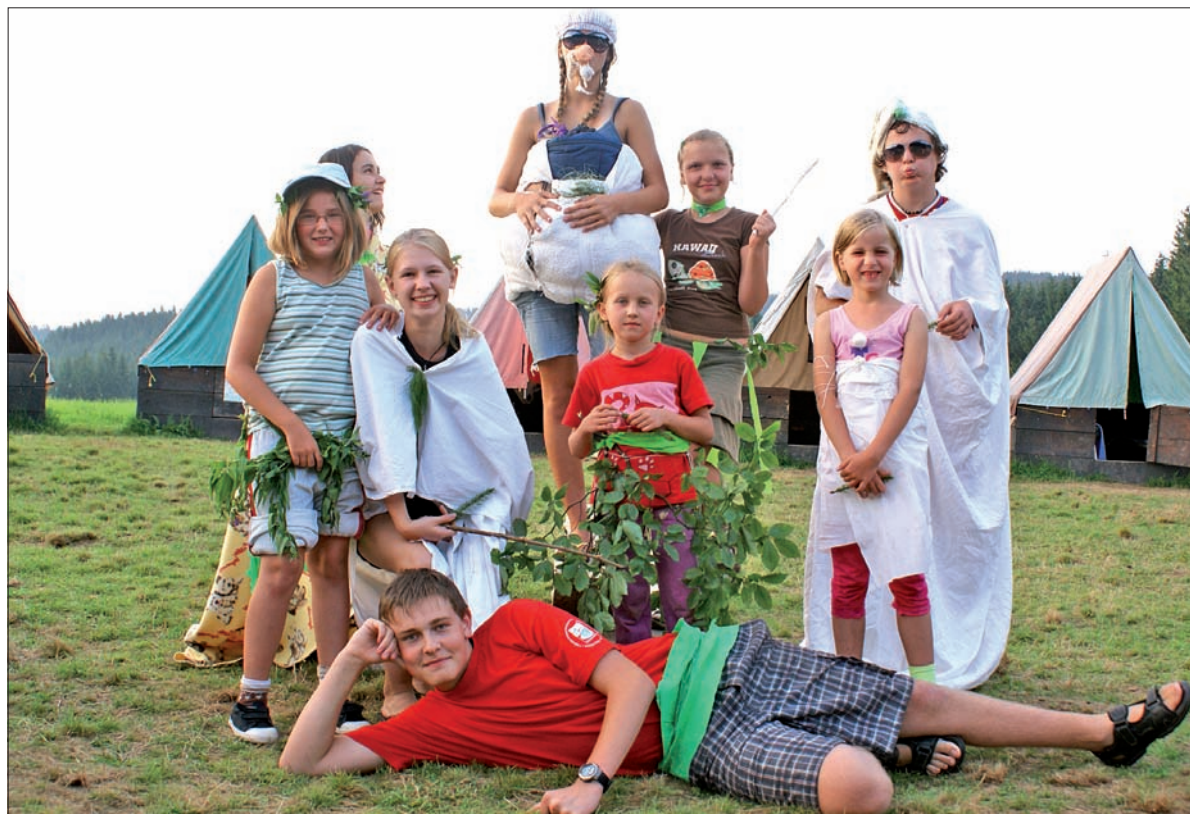
Na obozie nigdy nie jest nudno, zapewniają cierlickie zuchy.

Na krakowskim jubileuszowym zlocie, na którym 10 tys. osób świętowało 100-lecie polskiego harcerstwa, w delegacji HPC zabrakło przedstawicieli cierlickiej drużyny. Postanowiłem sprawdzić, dlaczego. Odpowiedź okazała się prosta – byli oni w tym czasie na obozie. Nie pozostało mi zatem nic innego, jak wsiąść w samochód i pojechać ich odwiedzić.