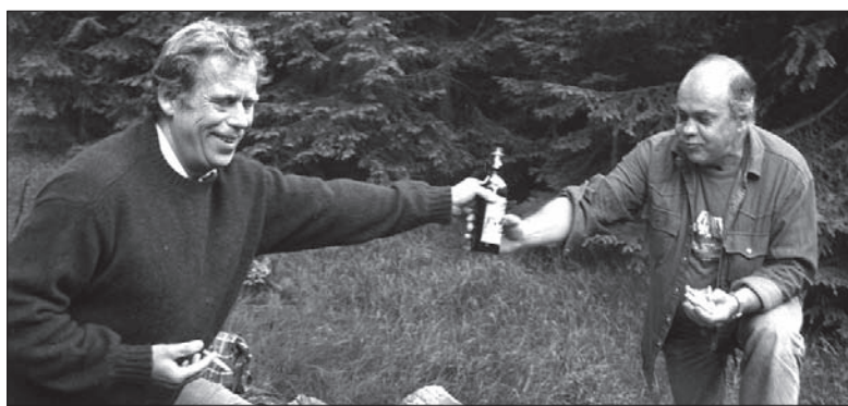
To zdjęcie na pewno też znajdzie się na wystawie.

W poniedziałek 30 sierpnia (w 30. rocznicę podpisania Porozumień Sierpniowych) w Ambasadzie RP w Pradze odbędzie się wernisaż wystawy pt. „Przekaz z ludzką twarzą” o Solidarności Polsko-Czechosłowackiej. Na trzydziestu panelach zostaną pokazane zarówno znane na całym świecie fotografie, jak i mniej