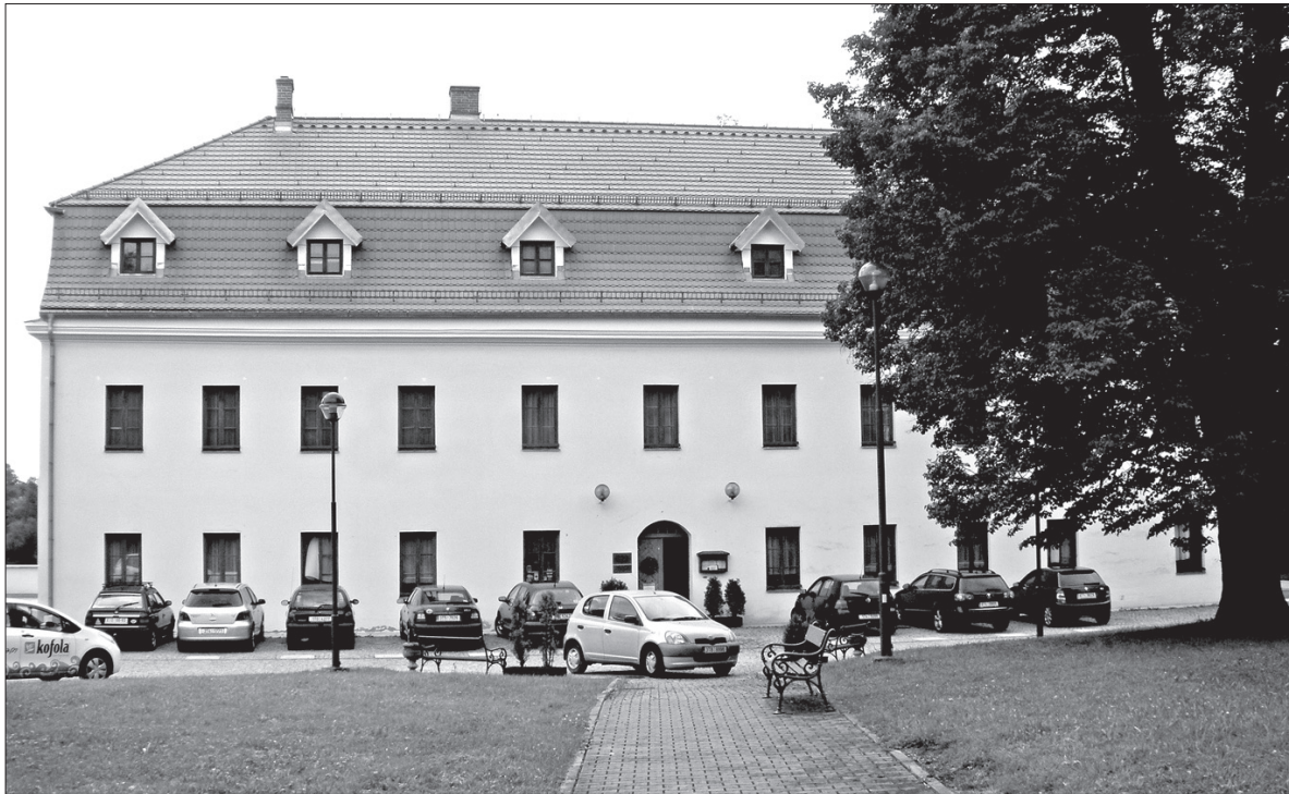
Zamek w Szumbarku doczekał się kompletnej odnowy. Dziś znajduje się w nim reprezentacyjny hotel w Hawierzowie.

Na wystawie pt. „Hawierzów przed Hawierzowem” zapoznamy się z historią Błędowic Dolnych, Szumbarku, Żywocic, Suchej Średniej i Dolnej oraz Datyń Dolnych, z charakterystycznymi dla nich zakątkami i budynkami. Na mapie wyznaczone są granice samodzielnych dawniej wiosek, łatwo można się więc zorientować, co dziś znajduje się na ich terenie. Kościół św. Anny, basen letni i zamek, który dziś jest kompleksem restauracyjno