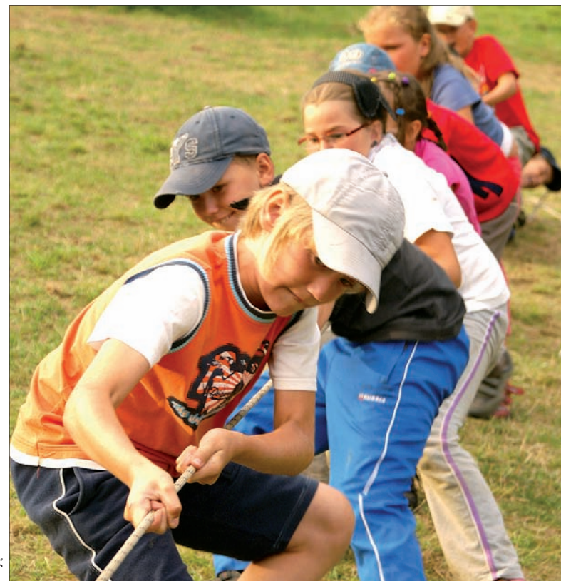
Dobry harcerz to mocny harcerz.