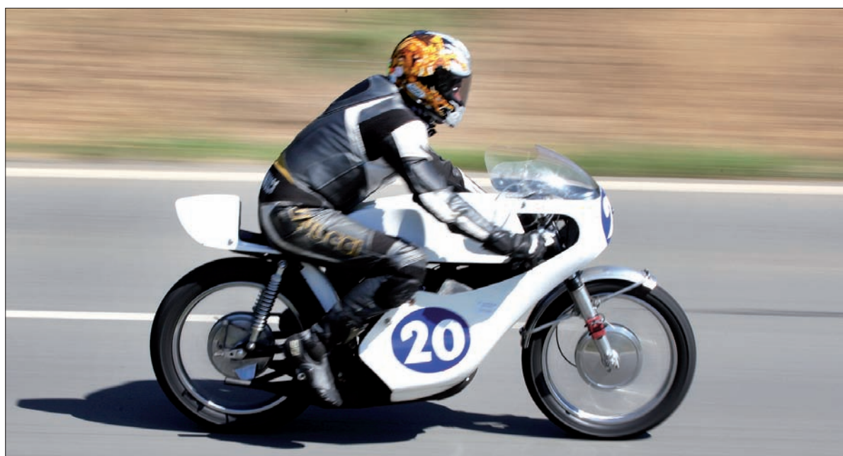
Momentami pędzono nawet z prędkością 300 km/h.

ochroniarzami, którzy – co zrozumiałe – nie wpuszczali fanów motoryzacji w niebezpieczne sektory zagrażające życiu. W dyskusję z ochroniarzami włączył się też fotoreporter „Głosu Ludu”, Marek Santarius. – Chciałem zrobić fajne zdjęcia, ale musiałem zadowolić się dużo gorszym miejscem, niż jeszcze kilka lat temu. Rozumiem jednak, że nadrzędnym celem organizatorów było bezpieczeństwo jeźdźców i widzów. (jb)