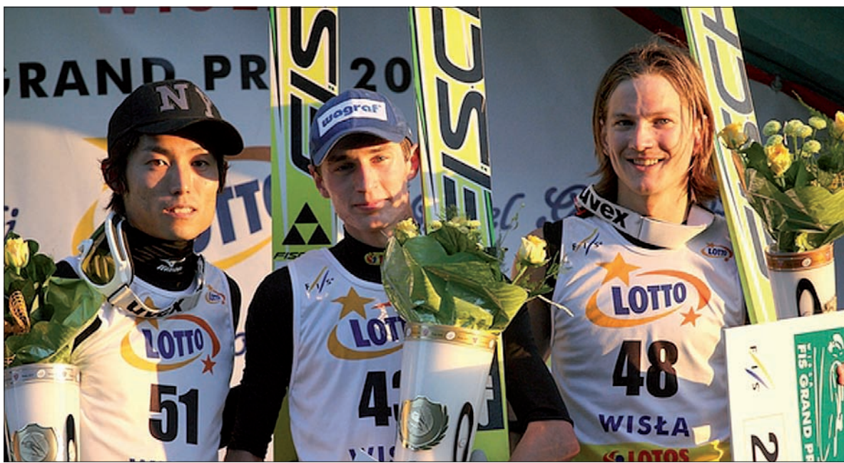
Podium sobotniego konkursu. Od lewej: Daiki Ito, Kamil Stoch i Tom Hilde.

Na skoczni im. Adama Małysza wystartowała prawie cała światowa czołówka skoczków, zabrakło tylko Szwajcarów z fenomenalnym Simonem Ammannem. Biało-czerwoni potwierdzili jednak, iż na własnym obiekcie skaczą najlepiej ze wszystkich. – Liczyłem na dobry występ moich podopiecznych, ale te wyniki przerosły najsmielsze oczekiwania – powiedział nam trener reprezentacji Polski, Łukasz Kruczek. Euforią tryskał też bohater sobotniego konkursu, Kamil Stoch. – Cieszę się z tego, że wygrałem właśnie tutaj, w Wiśle, przed własną publicznością – stwierdził Stoch, którego forma dobrze wróży przed zimowym sezonem. – Sportowa forma przychodzi zniemacka. Jedyne, co skoczek może zrobić, to maksymalnie ją wykorzystać i jak najdłużej utrzymać. Do zimowe-