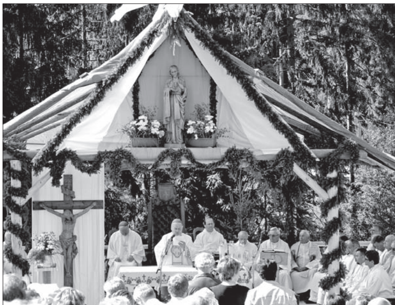
Trzej biskupi służyli mszę przy ołtarzu polowym na Trójstyku.