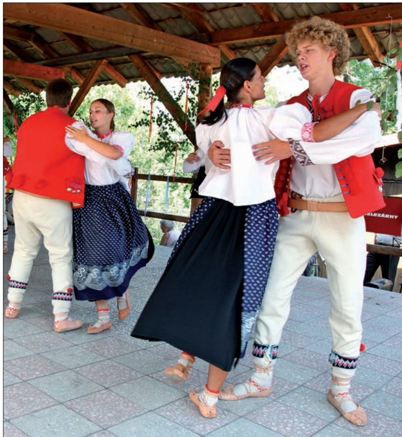
Zespół „Śmitowianie” przedstawił zabawy świętojańskie.