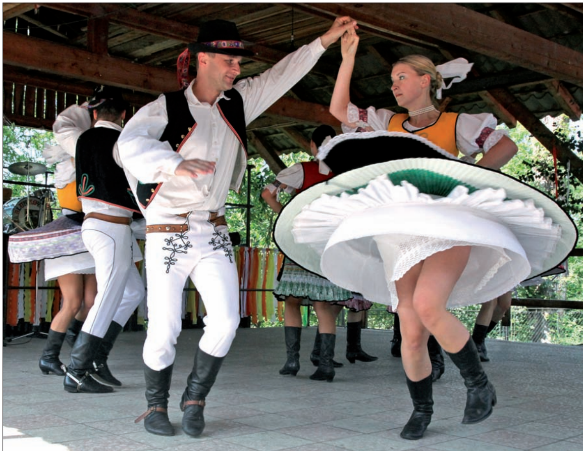
Wartkie, energiczne tańce słowackie pokazał zespół „Bystrzyca”.