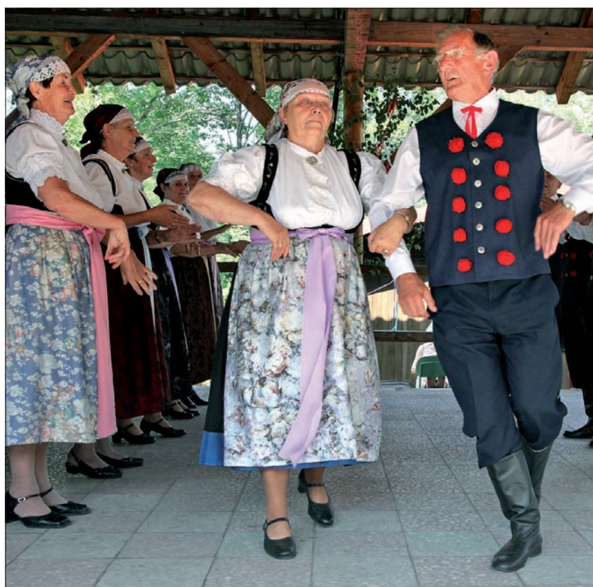
Folklor cieszyński w wykonaniu „Jasieniczki” z Jasionicy.