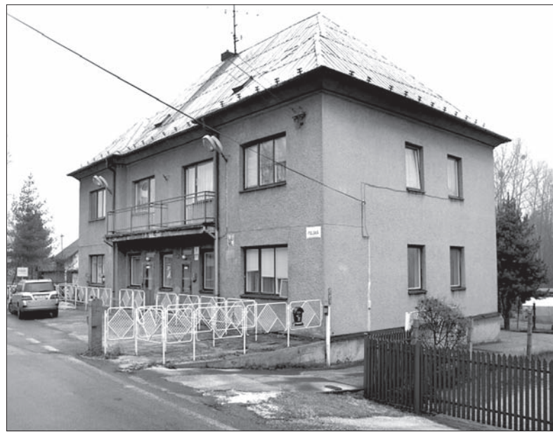
Budynek przy ul. Polskiej w Karwinie-Raju jeszcze w tym roku zaoferuje nową usługę socjalną – mieszkania chronione dla klientów bogumińskiego ośrodka dla osób z chorobami psychicznymi.

Z dotacji europejskiej równocześnie powstaje też dom z mieszkaniami chronionymi w Karwinie-Raju. W obiekcie, z którego korzystał niegdyś urząd celny, dach nad głową i opiekę znajdzie jeszcze w tym roku dziesięć klientów bogumińskiego ośrodka dla osób z problemami psychicznymi. (ep)