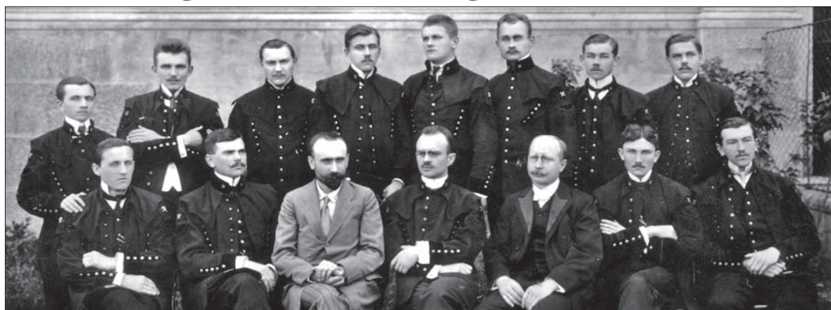
Także to zdjęcie obejrzymy na wystawie w Karwinie-Frysztacie.

Historia Polskiej Szkoły Górniczej w Dąbrowie była krótka. Placówkę założono w 1907 roku, a za-