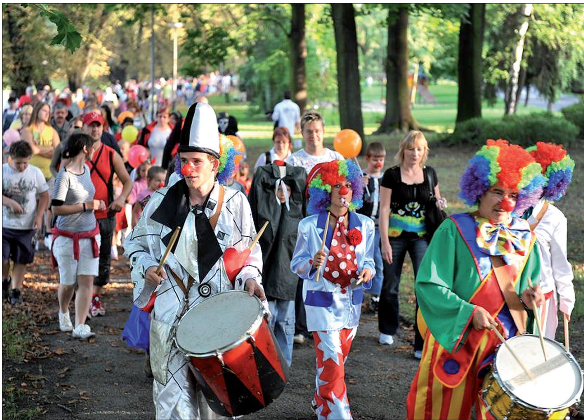
Kolorowy pochód dzieci – straszylek w maskach przejdzie z Czeskiego Cieszyna na Wzgórze Zamkowe.

szy o godzinie 18.00 sprzed ośrodka Kultury „Strzelnica” w Czeskim Cieszynie i wzdłuż Olzy dojdzie na Wzgórze. Tam czekają na was zabawy, konkursy, wybór najlepszych masek, nagrody, słodycze i wiele innych atrakcji. Tradycyjnie też wieczorem zapłoną lampiony, a po zmroku cieszyńskie niebo rozświetlą sztuczne ognie. (ep)