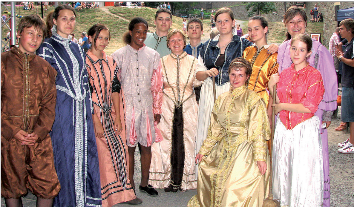
W sobotę obozowicze przebrali się w historyczne kostiumy. Na Helfsztynie odbywał się wielki Bal Zamkowy.