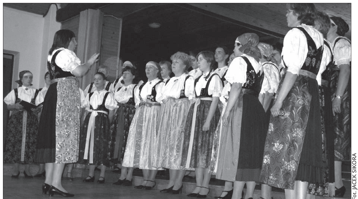
Chór Żeński „Melodia” z Nawsia w akcji.

Z Bałkanów Zaolziacy przyjechali zadowoleni. Impreza była dobrze zorganizowana, pogoda dopisała, gospodarze byli bardzo mili... – Podobną nam się też wycieczka do Stambułu. Młodzi koledzy z „Lipki” przez cały czas świetnie bawili nie tylko nas, ale wszystkich uczestników festiwalu. Kapela zrobiła tam po prostu furorę – dodała wiceprezes „Melodii”. (kor)