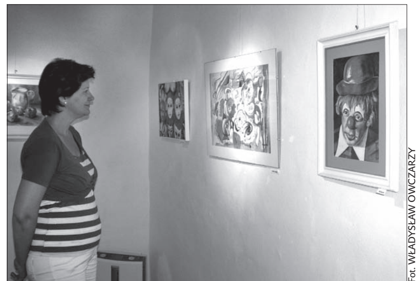
Wystawa tym razem jest trochę skromniejsza i nie wykorzystuje renesansowej sklepionej piwnicy ratusza.