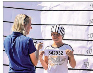
Filmowe lato w Boguminie upływa pod znakiem tematyki kryminalnej.

W Boguminie trwa od poniedziałku festiwal filmowy poświęcony tematyce kryminalnej. Projekcje filmowe odbywają się w Letnim Kinie w miejscowym Parku Petra Bezruča i – jak sprawdziliśmy na własne oczy, pomimo zmasowanego ataku komarów – cieszą się całkiem sporą popularnością. Na festiwalu, którego zakończenie zaplanowano na sobotę, widzowie mogą obejrzeć prawdziwe perły kinematografii. W poniedziałek wyświetlono temat „Na północ szlakiem północno-zachodnim” Alfreda Hitchcocka z 1959 roku, zaś obraz „Psycho” tego samego kultowego twórcy zaprezentowano widzom we wtorek wieczorem. Dziś można się wybrać na najnowszy obraz przygód Sherlocka Holmesa, stylizowany