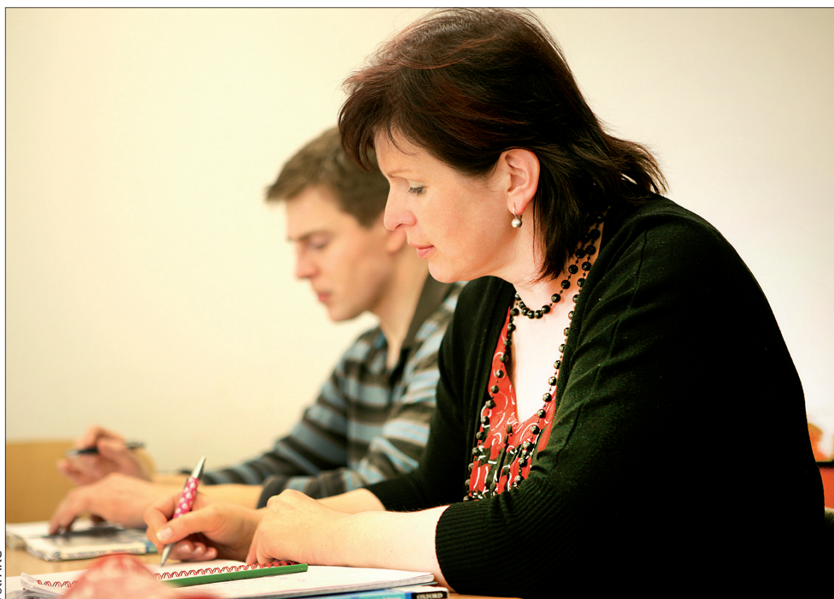
W czeskokocieszyńskim Pygmalionie zainteresowanie kursami języka polskiego systematycznie wzrasta.

Przejdźmy więc do kosztów. Nauka języków nie jest tania. Dobre pozna- nie polskiego od podstaw również. Kursy językowe oferuje na przykład Uniwersytet Wrocławski. Można tutaj wybierać spośród różnych form zdobywania biegłości językowej. Dla osób dysponujących czasem wolnym przeznaczony jest kurs semestralny, trwający trzy miesiące. Kosztuje on