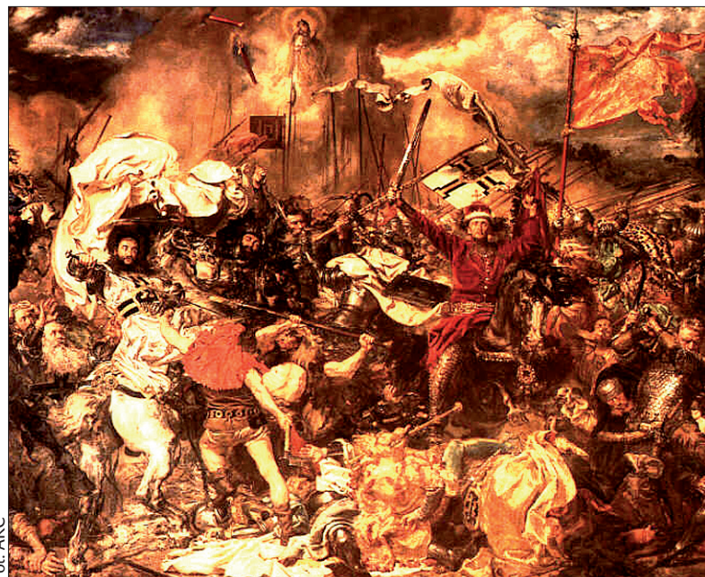
Fragment najbardziej znanego historycznego obrazu Jana Matejki – „Bitwa pod Grunwaldem”.

poślukowymi oddziałami czeskimi, mołdawskimi i tatarskimi, pod do- wództwem króla Polski Władysława II Jagiełły.