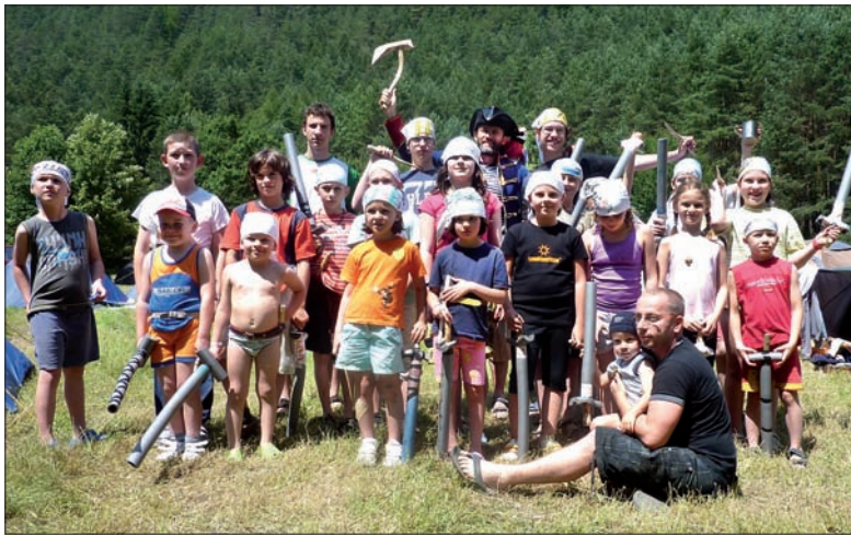
Kapitan Smugler i mali piraci.

Jak sądzicie? Musiało być ekstra, prawda...? (sch)