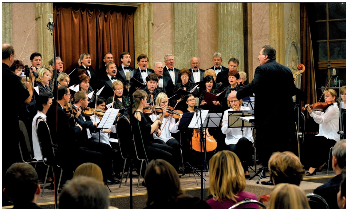
Wspólny koncert zespołu „Hutnik” i Trzynieckiej Orkiestry Kameralnej na Międzynarodowym Festiwalu Zespołów Kameralnych w Ołomuńcu w 2009 roku.