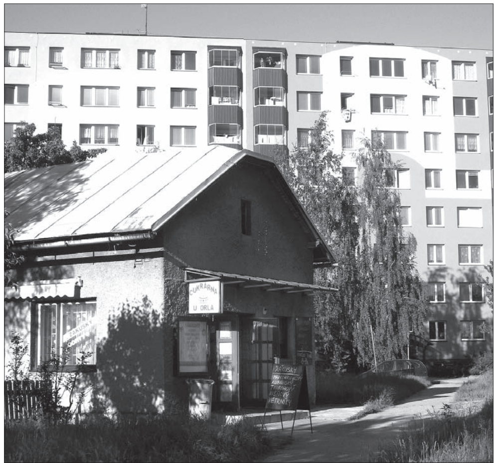
Stare miesza się z nowym...

W Orłowej, w starej Orłowej, wieje końcem świata. Zaczopowany kopalniany szyb, ewangelicki kościół w otoczeniu drzew i nagle z tej zieleni wyrastają domy, kamienice, piękne kamienice z przełomu zeszłych stuleci. W jednej z nich,