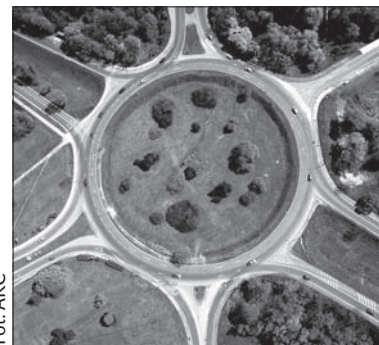
Hawierzowskie rondo z lotu ptaka.

Inwestycja, łącznie z budową chodników, ścieżki rowerowej i nowego przystanku autobusowego, pochłonie 43 mln koron. (dc)