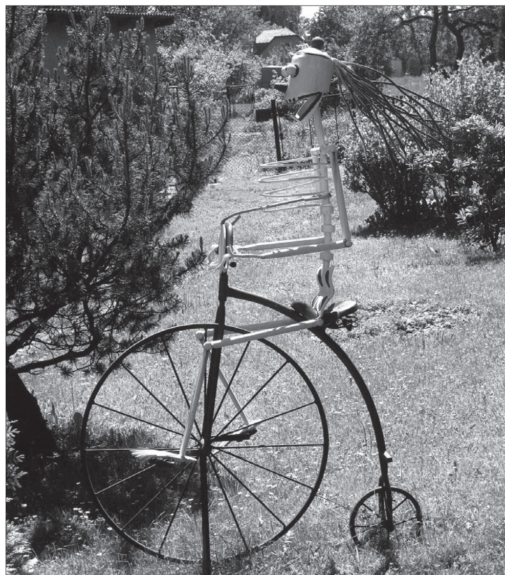
Nietypowa rzeźba – śmierć radośnie pomykająca na rowerze.

Podoba mi się. Stąd emanuje jakiś błogi spokój. Nad Dołami roztacza się klódek, svatý klódek. Położę się tak na wznak na zielonej trawie ze złożonymi na piersi rękami. Może wtedy łatwiej usłyszę głosy dobiegające od tych, którzy leżą parę łokci pod ziemią, w podobnej pozycji, tu na Dołach. A nad nimi tabliczki: żył, był, Pan przyjął go do siebie. Na jednym z mijanych po drodze podwojek właściciel postawił sobie rzeźbę: radośnie pomykającą na rowerze wśród soczystej trawy śmierć. To chyba bardziej przemawiający symbol dla Dołów niż pikujący orzeł z Obroków. JAROSŁAW JOT-DRUZYCKI