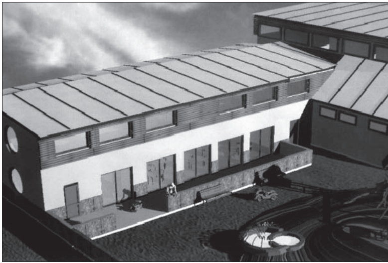
Tak ma wyglądać nowe polskie przedszkole w Gnojniku.