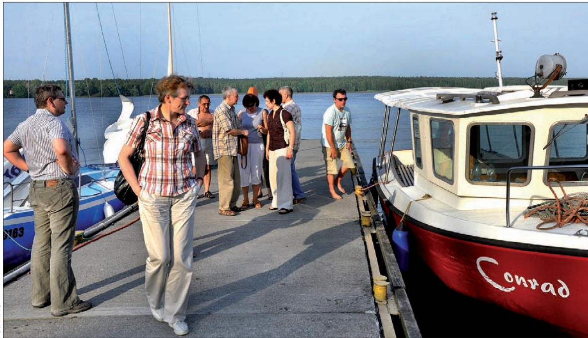
Niedawno członkowie PTM bawili z rewidytą w Rybniku. Na zaproszenie kolegów z tamtejszego TOZ spędzili dzień nad Zalewem Rybnickim.

W niedzielę, trzecim dniu obchodów, członkowie PTM wraz z jubileuszowymi gośćmi odwiedzą