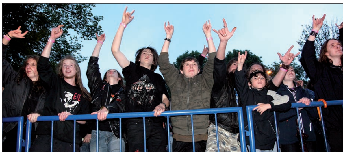
Bystrzycki Złot przyciągnął także młodych fanów rocka.