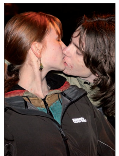
Namiętnie... jak na maj przystało.