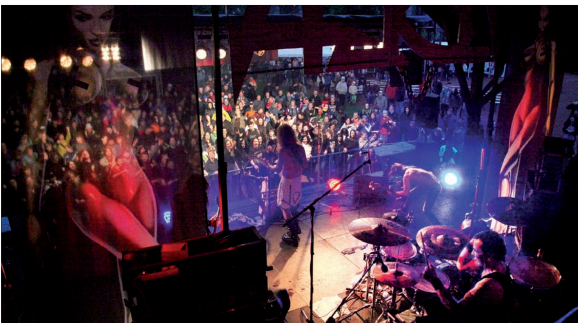
Widok na scenę z salonu dla VIP-ów. Właśnie gra Doga.