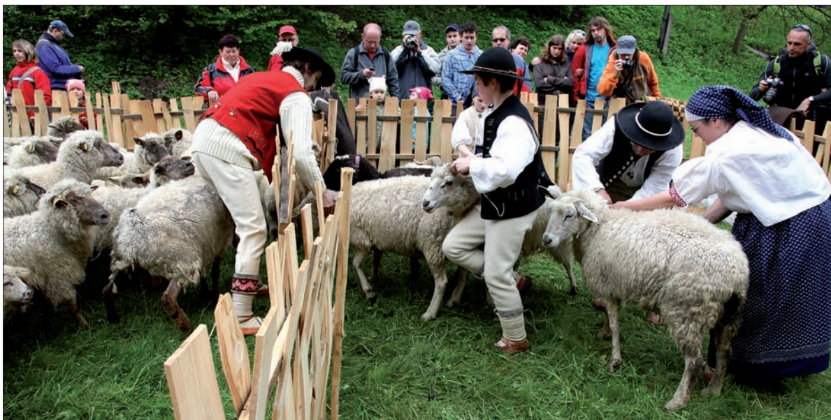
Owczki już „pomyszane”. Przed wyganianiem na hale trafiły do „koszora”.