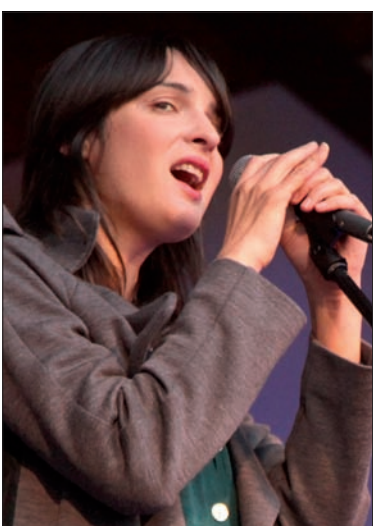
Sympatyczna Jana Kirschner.