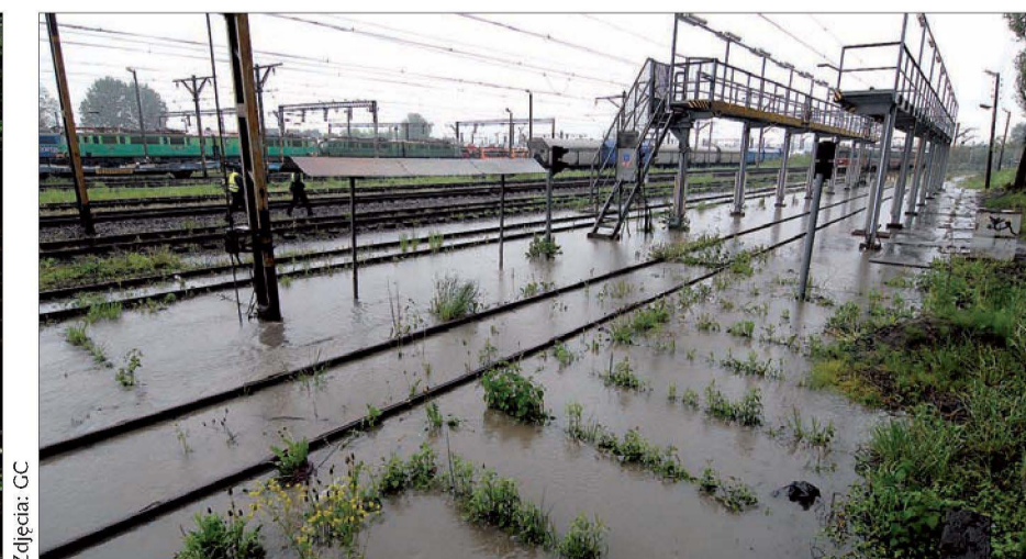
... i zalany dworzec w Zebrzydowicach.