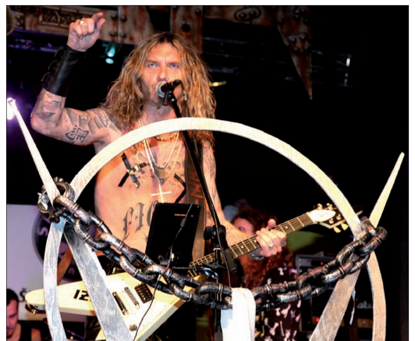
Dla wokalisty Romana Izaśa było w piątek wyraźnie za gorąco.