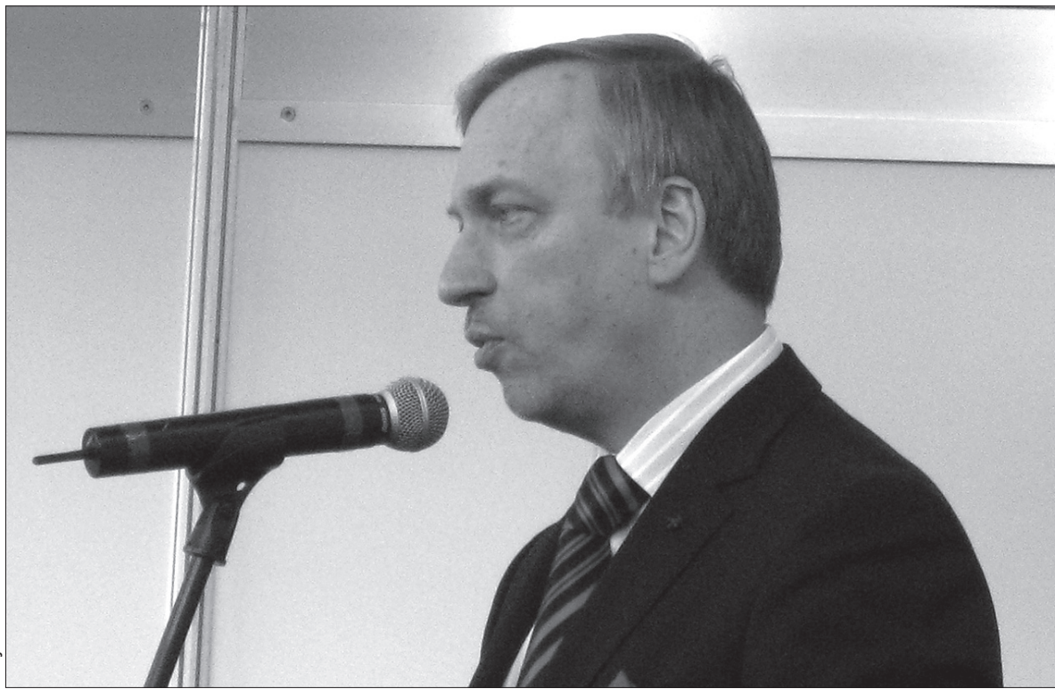
Minister kultury Bogdan Zdrojewski na targach książki w Pradze.

Bardzo mi zależy, żeby ten dystans między Warszawą i Pragą był najkrótszy, taki, jaki jest bardzo często w naszych sercach. Prawdą natomiast jest, że przez dwadzieścia lat trochę się od siebie oddaliliśmy. A to dlatego, że otwarcie Europy oznaczało pewną satysfakcję Paryżem, Berlinem, Londynem, Rzymem. Poszliśmy w Europę, żeby zdobywać miejsca, przestrzeń dla siebie, doświadczenia. Ale ten czas jest za nami. Teraz obserwujemy to, o czym śp. prezydent Kaczyński powiedział. Znowu jesteśmy sąsiadami, bardzo bliskimi. Mało tego – obserwujemy, że niewiele nas różni, że dzielimy te same doświadczenia z estetyki, literatury. I ten