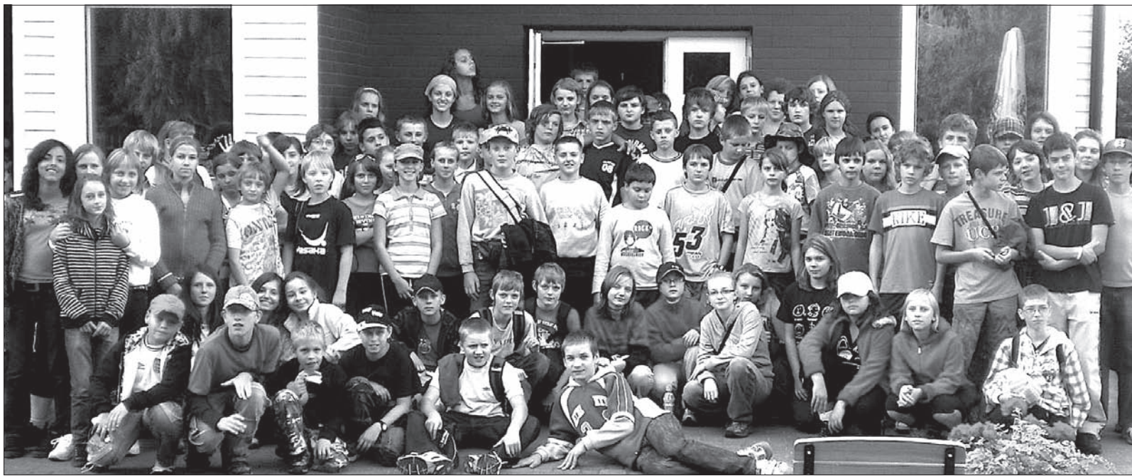
Uczestnicy ubiegłorocznej Zielonej Szkoły w Karwi.

Pobyt młodych Zaolziaków w Zielonej Szkole będzie dofinanso-