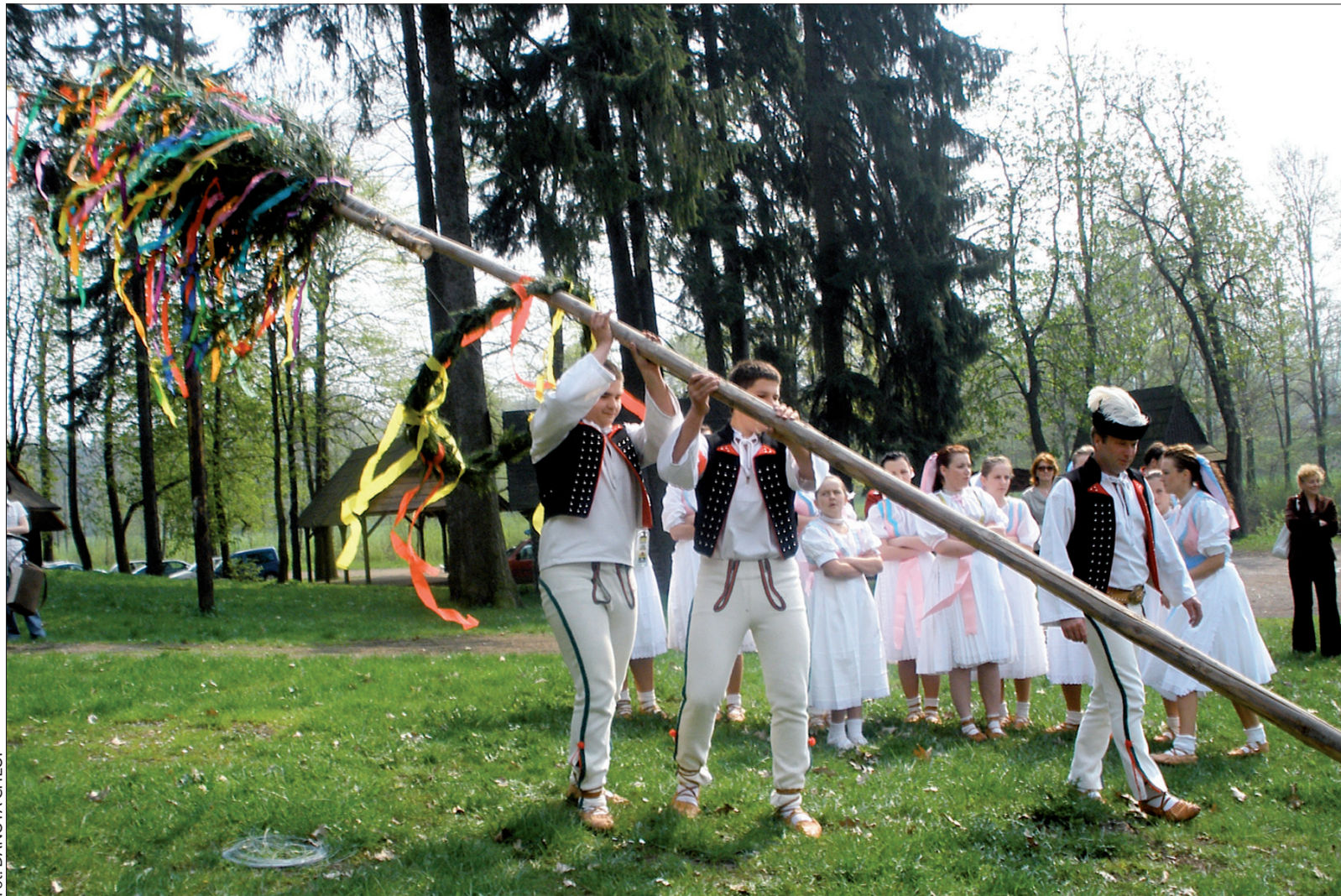
Chłopcy z zespołu „Radošťan” stawiają moja w Lasku Miejskim w Jabłonkowie.