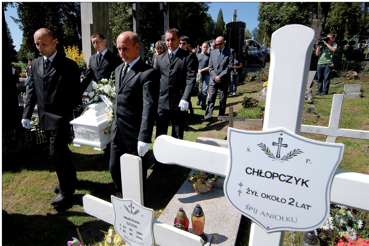
Na białym krzyżu napisano tylko: „Ś.p. chłopczyk, żył około 2 lat. Śpij aniołku”.

Prokuratura Okręgowa w Bielsku-Białej ma już wyniki badań DNA chłopca, niestety nie mają one większego znaczenia w śledztwie, ponieważ wyodrębnionego kodu nie ma z czym porównać. (gc)