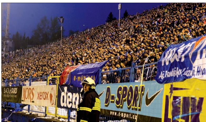
Mecz Banika ze Spartą obejrzał komplet publiczności.

Nawsie – Palkowice 3:1, Bukowice – Rzepiszcz 0:2, Piosek – Wacławowice 1:2. Lokaty: 1. Frydek-Mistek 50, 2. Rzepiszcz 41, 3. Palkowice 39 pkt. (jb)