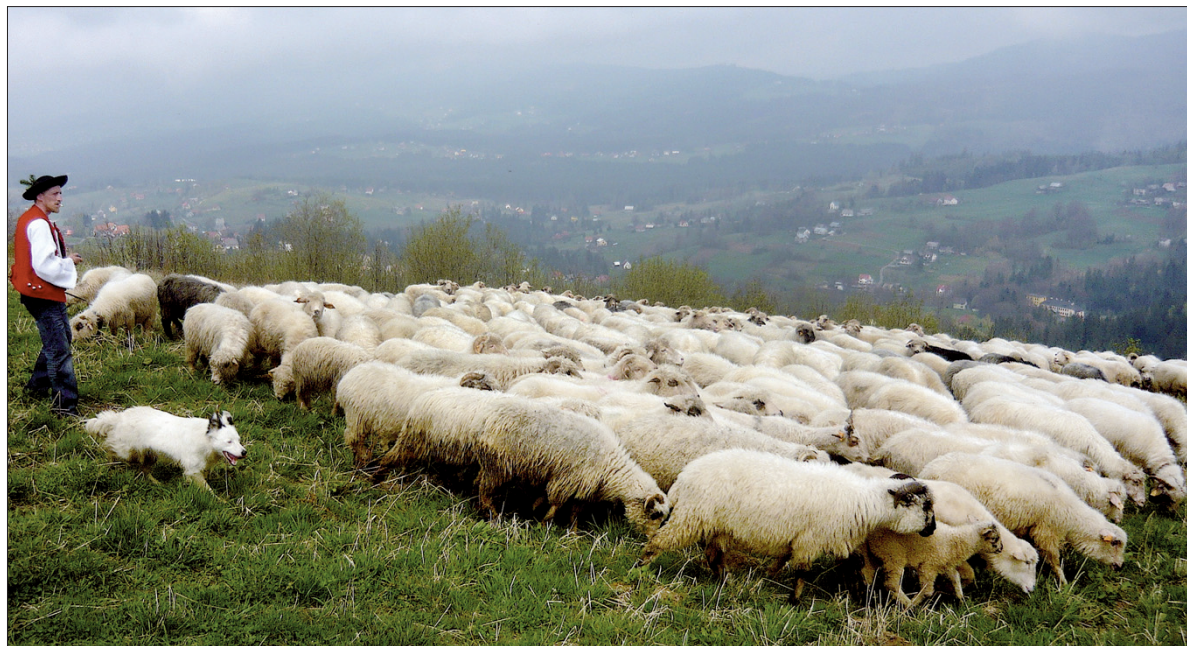
W Beskidzie Śląskim rozpoczął się wypas owiec.

Na stronie poświęconej gwarze Śląska Cieszyńskiego (gwara.zafrisko.pl) o myszaniu można przeczy-