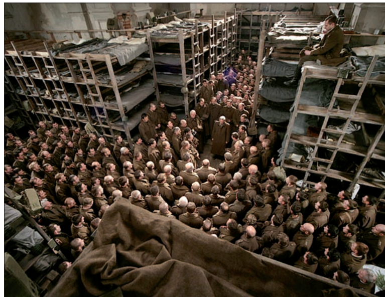
Kadr z filmu „Katyn” Andrzeja Wajdy.

Rossija wyświetliła „Katyn” w kanale tematycznym Kultura, w porze najwyższej oglądalności. (r)