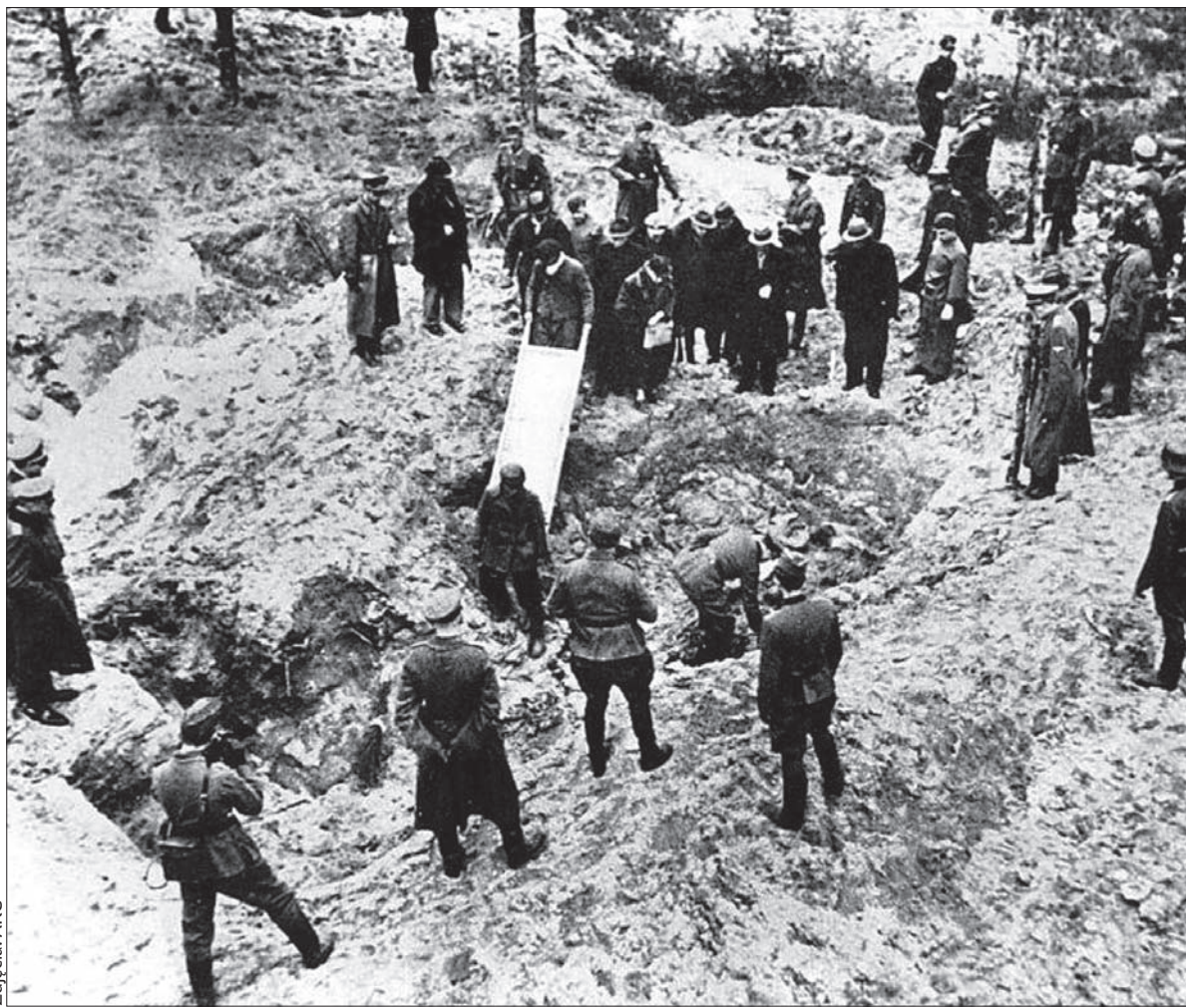
Zdjęcie z ekshumacji pomordowanych na Wschodzie.

Już w pierwszych dniach wojny aresztowali hitlerowcy szereg wybitniejszych Polaków miejscowych, wywożąc ich do obozu koncentracyjnego w Skrochowicach, zamordowali byłego burmistrza Karwiny, ogólnie lubianego i zasłużonego