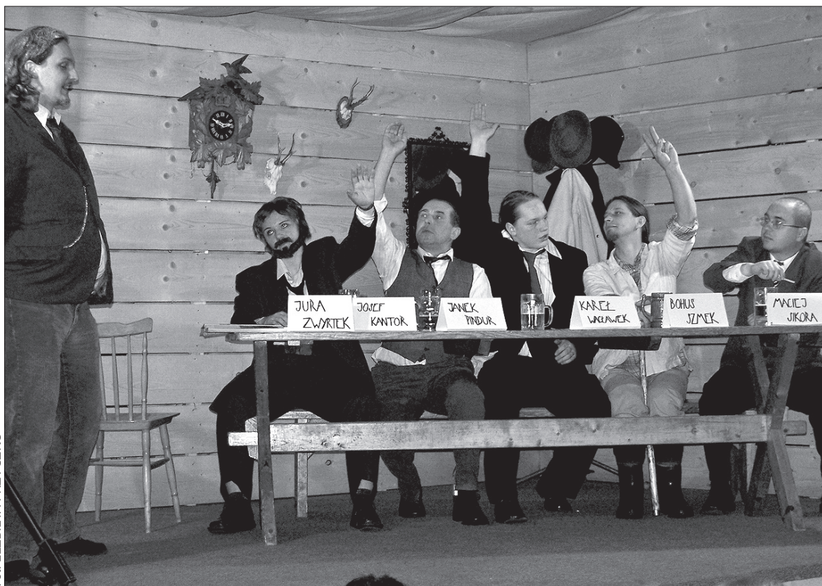
„Wymiana” Władysława Młynka – radni świętują budowę „ławki przez potok”.

Budowa nowej „ławki przez potok” i domniemana wymiana pieniędzy to problemy trapiące bohaterów „Wymiany” Młynka. Przedstawienie przygotował Klub Młodych MK PZKO, a śmiała się cała sala, bo na teatr w niedzielne popołudnie przyszło sporo osób. Sztuki wystawiane „po naszymu” to już tradycja miejscowego Klubu Młodych, zwykle udaje im się przygotować sztukę właśnie na Wielkanoc. Po przedstawieniu grały do wieczora kapele „Nowina” i „Kozubek”. (ep)