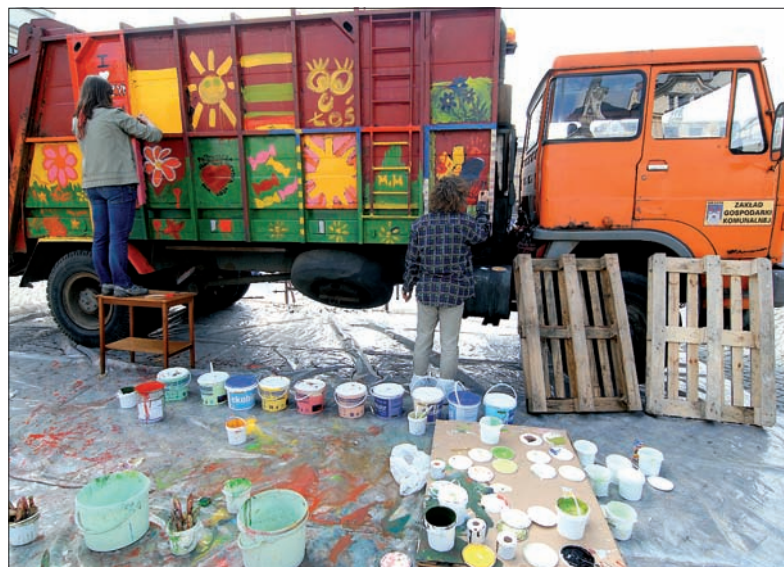
Śmieciarkę malowało 15 uczniów.