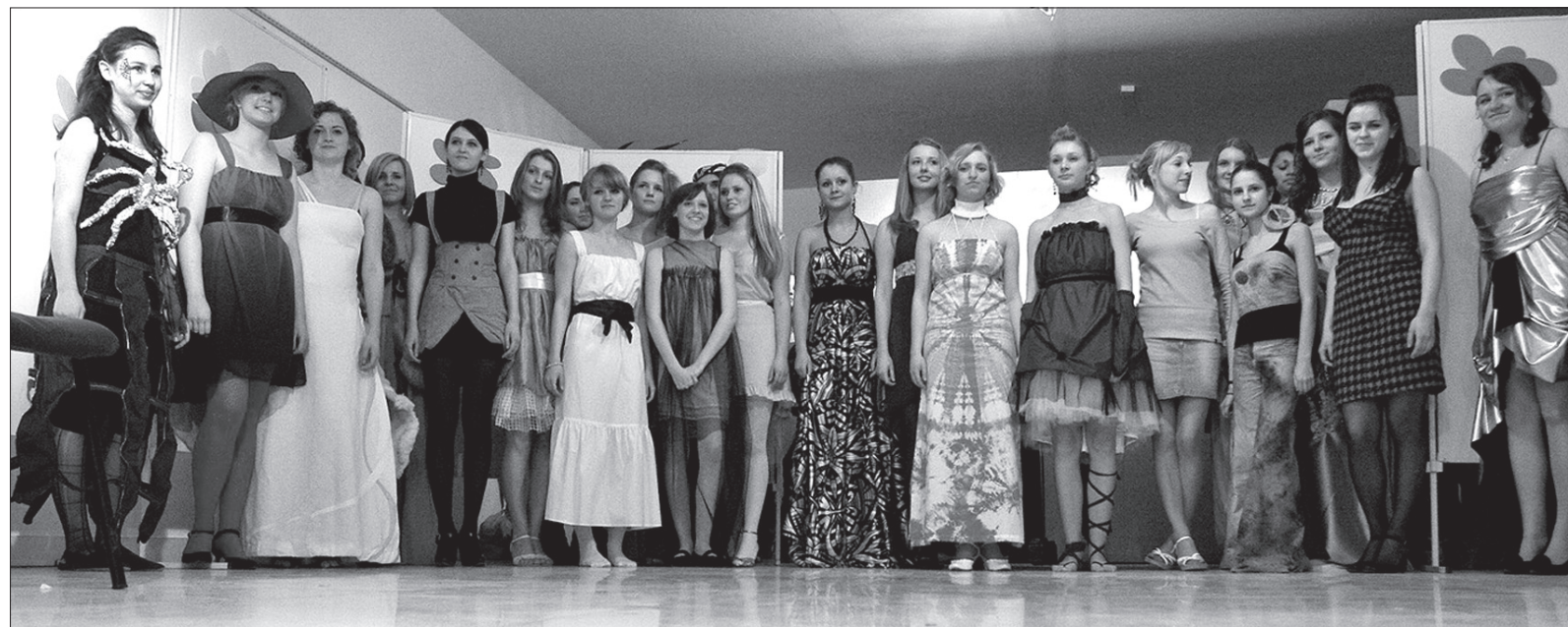
Na gimnazjalnym pokazie mody »Kwiat Morwy« było na co popatrzeć.

W tym samym dniu, przed południem, gimnazjaliści zaprosili swoich kolegów na kolejną imprezę zorganizowaną w ramach projektu Biały Kruk. Tym razem na stadionie zimowym w Czeskim Cieszynie kto miał łzy, mógł wziąć udział w spotkaniu pod nazwą Cieszyński Vancouver i zmierzyć się z rówieśnikami w nietypowych dyscyplinach sportowych. (kor)