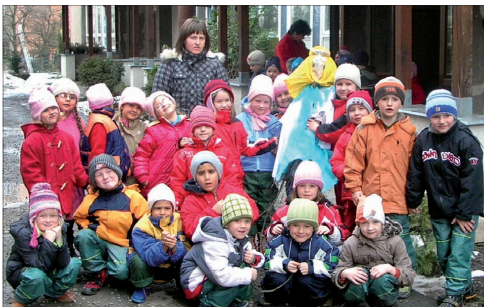
Przedszkolaki z Jabłonkowa i zrobiona przez nich Marzanna.

Marzannę topiono także w Jabłonkowie. W ubiegły piątek 60 dzieci z polskiego przedszkola poszło nad rzekę Łomniankę, żeby utopić kukłę, symbolizującą zimę. Marzannę dzieci robiły od rana, używając do tego gałązek, papieru i materiału. Podobno początkowo kukła Marzanny jakoś nie chciała popłynąć z nurtem rzeki, ale w końcu się udało.