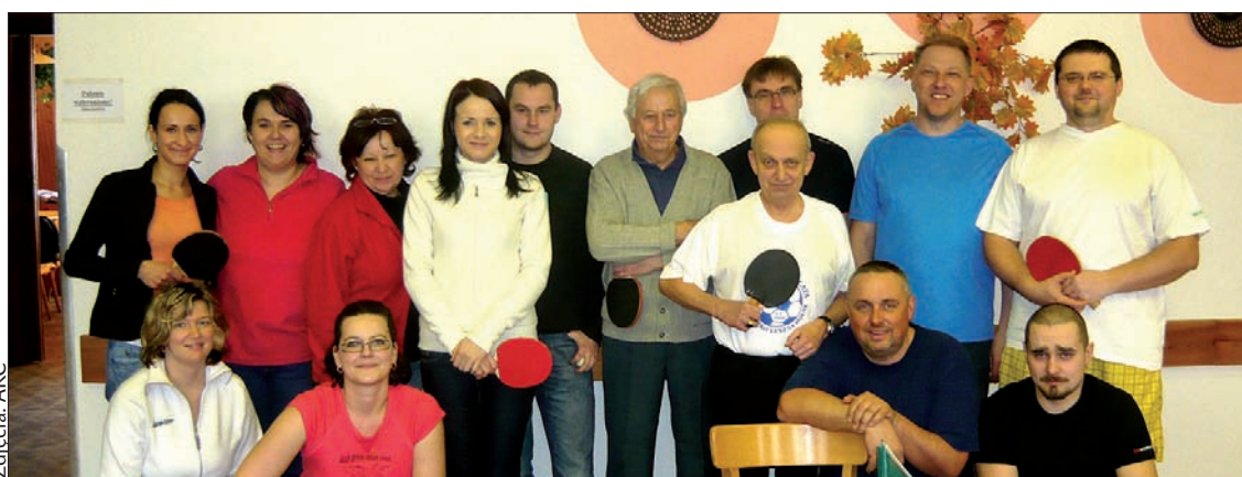
▼ Zawodnicy startujący w kategorii seniorów.