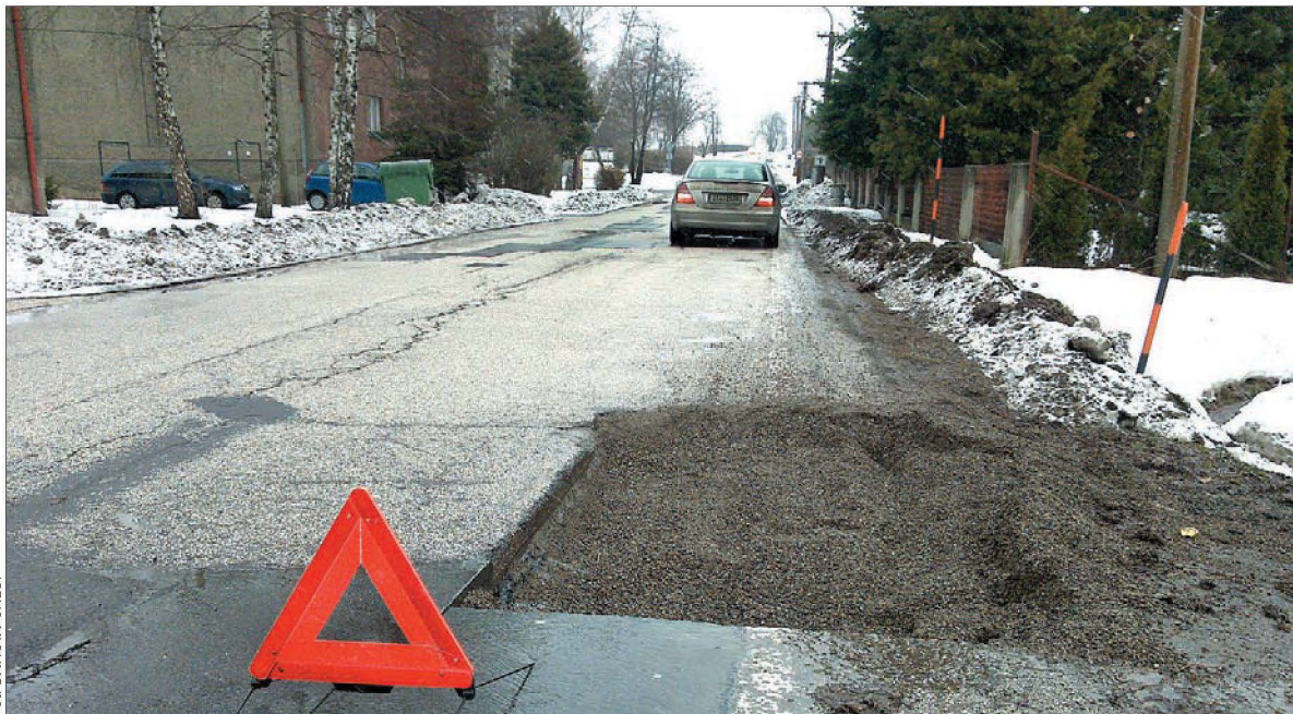
W tę dziurę w Hawierzowie-Sucej wpadł w sobotę samochód.