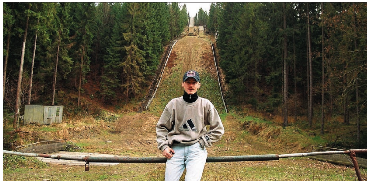
Skocznia w Wiśle-Łabajowie. Tu Adam Małysz stawiał pierwsze sportowe kroki. Podczas jednego z treningów doszło do zabawnego wydarzenia: mały Adas wyskoczył dzielnie z progu, a wylądował kilka metrów dalej, w samych skarpetkach – buty z nartami zgubił gdzieś podczas lotu.