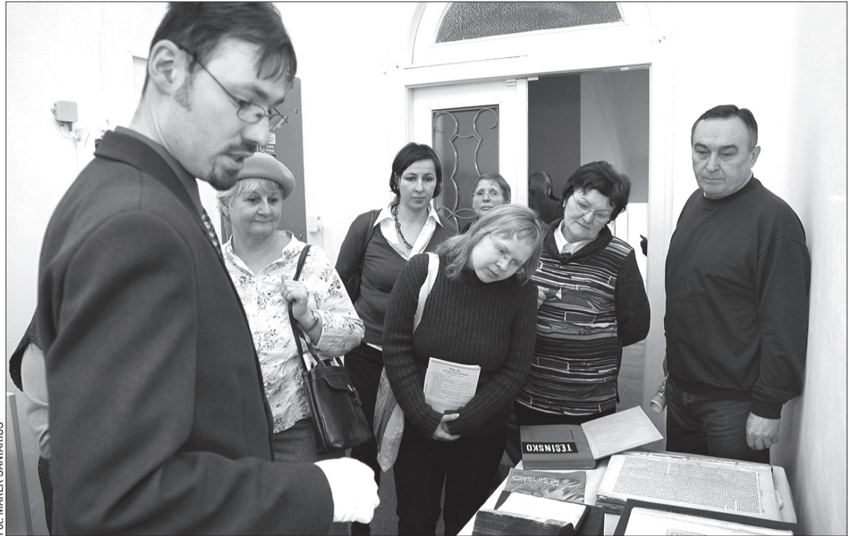
Biblioteka Silesia pisze od kilku dni nowy rozdział swej historii.