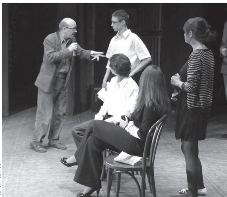
Artur Barciś jest częstym gościem cieszyńskiego teatru. Na zdjęciu podczas zajęć z młodzieżą.