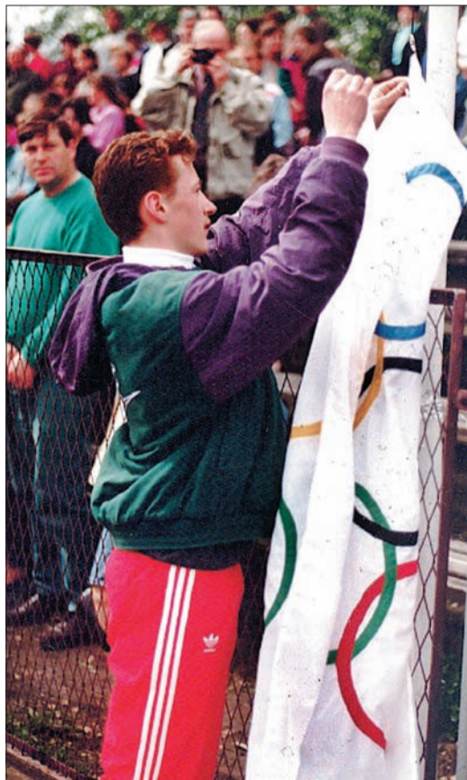
1996 rok. Jeszcze jako mało znany skoczek wiesz flagę olimpijską podczas inauguracji Olimpiady Młodzieży Ewangelickiej w Skoczowie. Wtedy nawet nie marzył o wyjeździe na prawdziwe igrzyska...