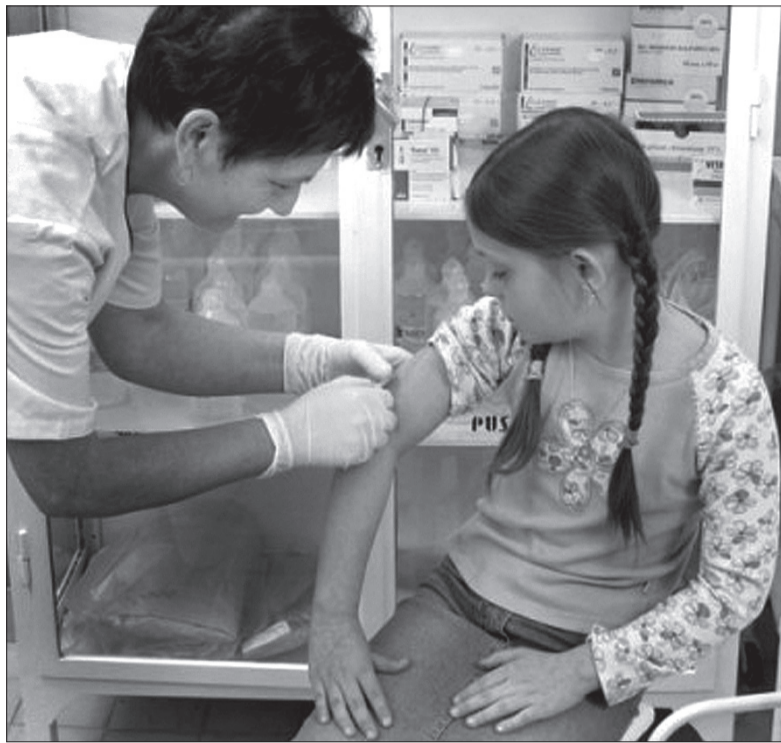
Szczepienie przeciwko gruźlicy ponownie jest opłacane przez ubezpieczalnie zdrowotne.

W większości krajów europejskich, w tym w Republice Czeskiej i w Polsce, nie trzeba się gruźlicy specjalnie obawiać. Sytuacja epidemiologiczna jest raczej dobra. Mimo wszystko liczba zachorowań z roku na rok powoli rośnie – najprawdo-