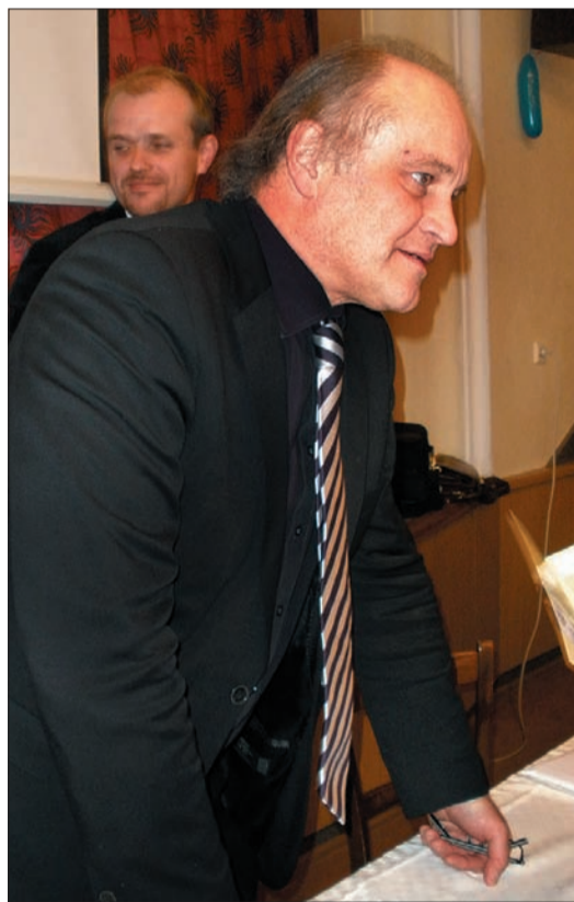
Minister wysłuchał wszystkich poglądów – również po oficjalnym zakończeniu imprezy.

Seminarium edukacyjne nt. dwujęzyczności zwołały Komisja ds. Mniejszości Narodowych przy Urzędzie Gminy w Śmiłowicach oraz Miejsce Koło Polskiego Związku Kulturalno-Oświatowego. Przybyło na nie, prócz mieszkańców gminy, wiele osób z innych miejscowości regionu – m.in. wójtowie sąsiednich gmin, dyrektorzy szkół, przedstawiciele organizacji Matice Slezská. To oni najgorzej wystąpili w dyskusji, obwiniając polską stronę o nacjonalizm, pogarszanie wzajemnych stosunków i celowe podsycanie konfliktu w mediach.