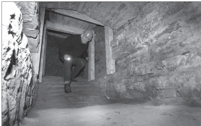
Tajemnicze przejście odsłonięto w jednej z piwnic browaru.

Cieszyński browar otwarto w 1846 roku, 10 lat przed słynnym browarem w Żywcu. Obecnie oba wchodzi w skład Grupy Żywiec, należącej do holenderskiego koncernu Heineken. (gc)