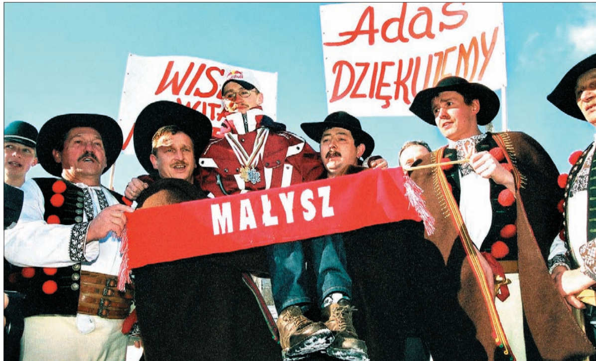
2001 rok. Adam Małysz po powrocie do rodzinnego miasta z Lahti jako mistrz świata.