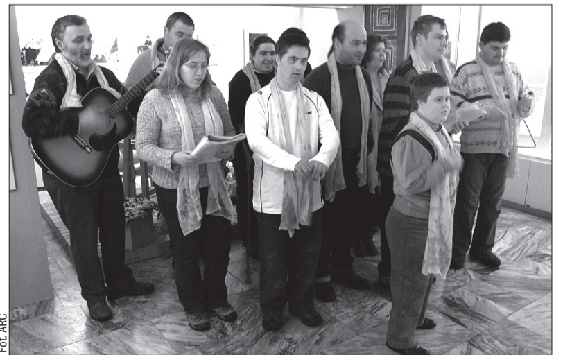
Na wernisazu wystąpili klienci ośrodka dziennego Eden Diakonii Śląskiej w Czeskim Cieszynie.

Również ich organizacja - Stowarzyszenie Pomocy Osobom z Upośledzeniem Mentalnym - obchodzi w tym roku swe 20-lecie. Inicjatorką jego założenia była matka dziewczynki z Czeskiego Cieszyna, która urodziła się z zespołem Downa. Dziś stowarzyszenie liczy 81 członków. Urządza obozy letnie i inne imprezy sportowe i kulturalne z myślą o niepełnosprawnych. Wystawę można zwiedzać codziennie, oprócz poniedziałków, do 11 kwietnia br. (dc)