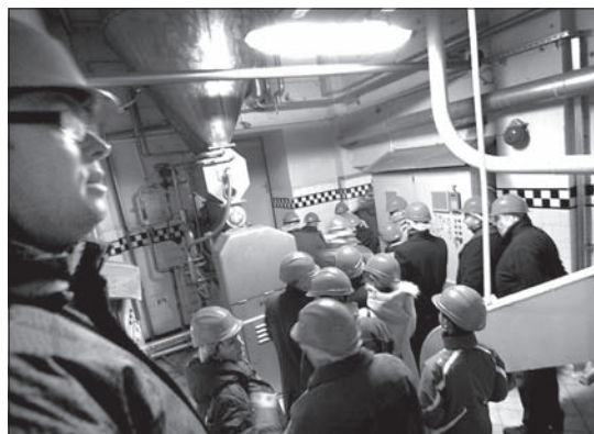
Wielką atrakcją wieczoru było też nocne zwiedzanie browaru.

Nocne zwiedzanie, piwne konkursy, zabawa przy muzyce irlandzkiej złożyły się na sobotnią Karnawałową Biesiadę w Brackim Browarze Zamkowym w Cieszynie.