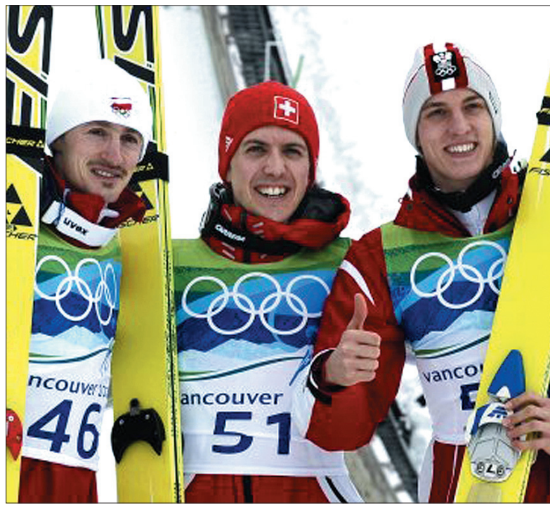
Na podium z lewej: Adam Małysz, Simon Ammann i Gregor Schierenzauer.