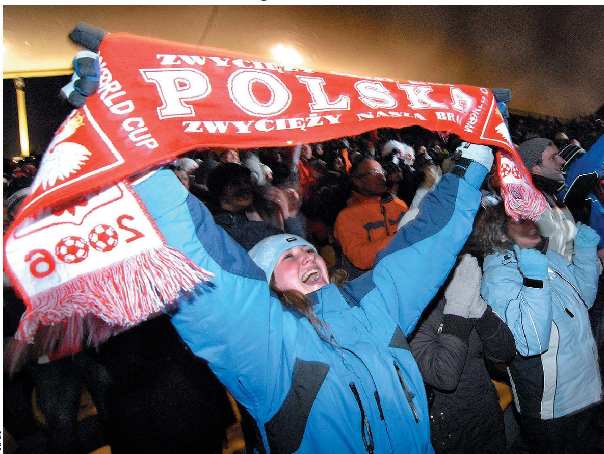
Wisła kibicowała Adamowi Małyszowi przed wielkim ekranem w amfiteatrze.