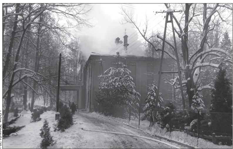
Tak wygląda dziś pałacyk w Jaworzu, pamiątka po dawnych właścicielach.