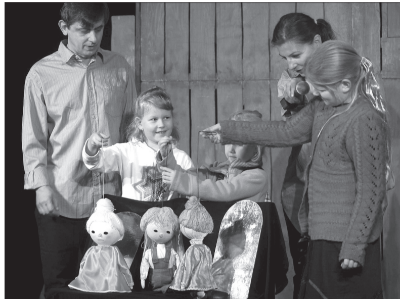
Aktorzy zapraszają w „Makowej wojnie” do zabawy w teatr także dzieci.

szą atrakcją dla widzów jest możliwość wzięcia czynnego w nim udziału. Całość pomyślano bowiem jako zabawę z dziećmi - oczywiście zabawę w teatr; zaproszone na scenę maluchy animują tutaj wszystkie role. Całość poprzedza krótki prolog, w którym prezentowane są róż-