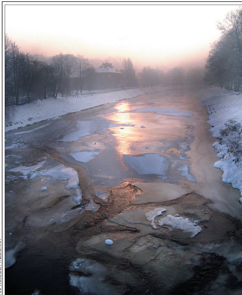
Poniedziałkowy poranek nad zamrożoną Olzą.