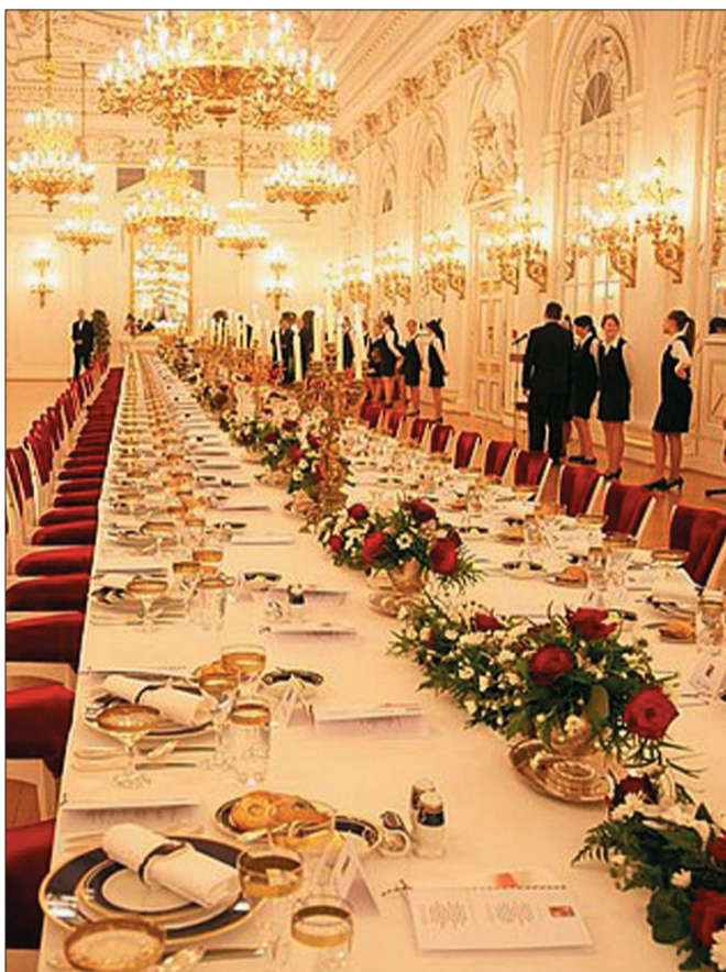
Prezydent Václav Klaus wydał na cześć gości z Polski uroczystą kolację na Hradczanach.