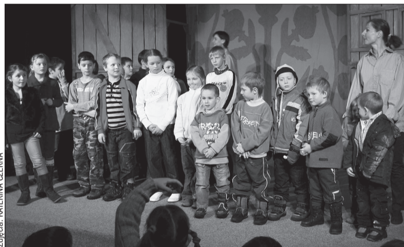
Mali i duzi aktorzy podczas jednego z przedpremierowych przedstawień.

Scenariusz do przedstawienia powstał na podstawie wierszowanego tekstu Ewy Szelburg-Zarembiny o dzielnym strachu na wróble, który ratuje Makowe Królestwo przed najazdem ptaków. Spektakl zbudowany został w konwencji teatru w teatrze. Nowością i najwięks-