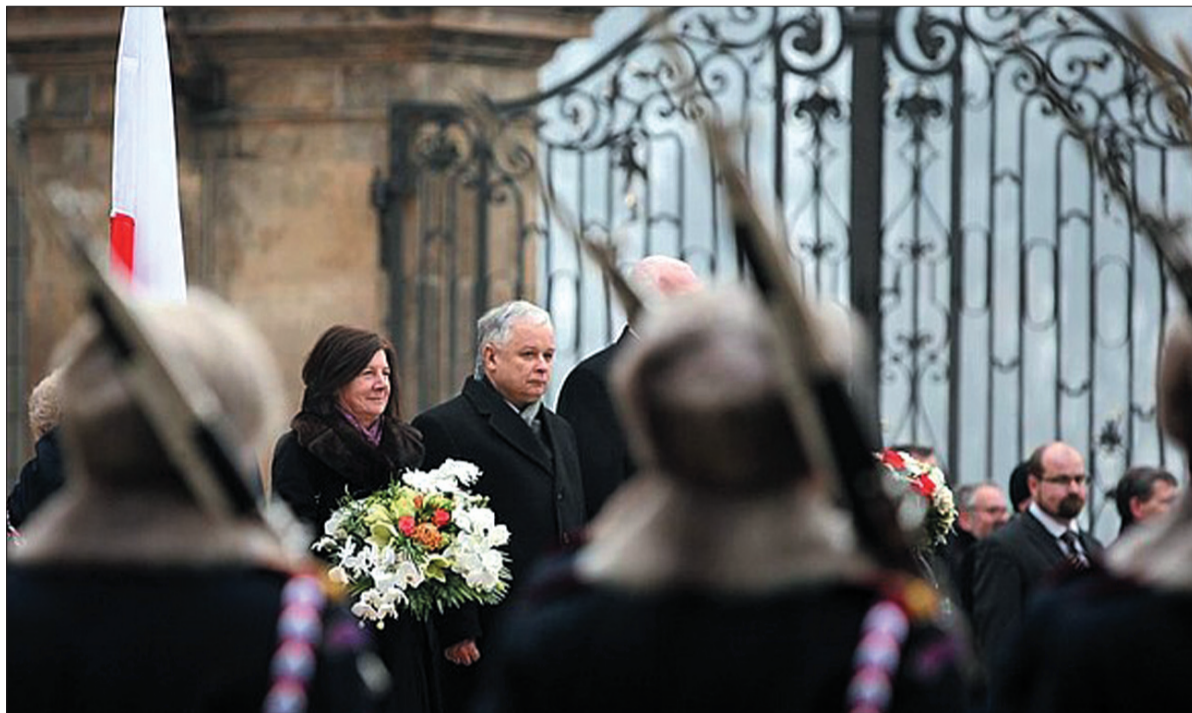
Prezydencka para przed bramą Zamku Praskiego.