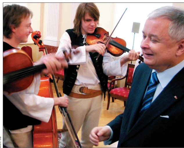
A może by tę „Lipkę” zaprosić do Warszawy?