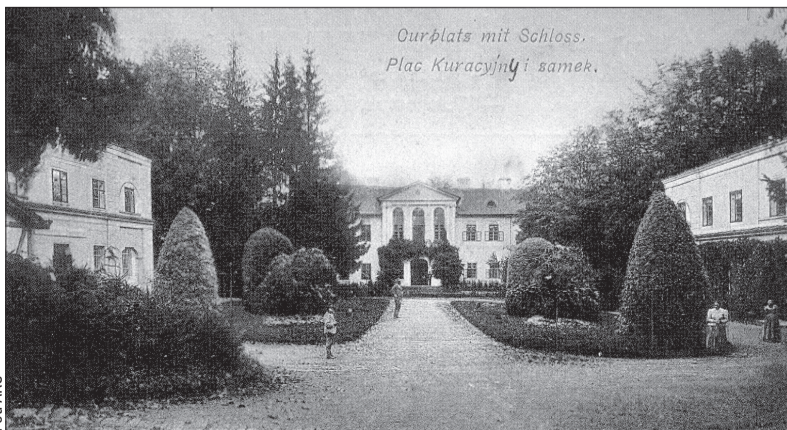
A tak wyglądał w czasach świetności.