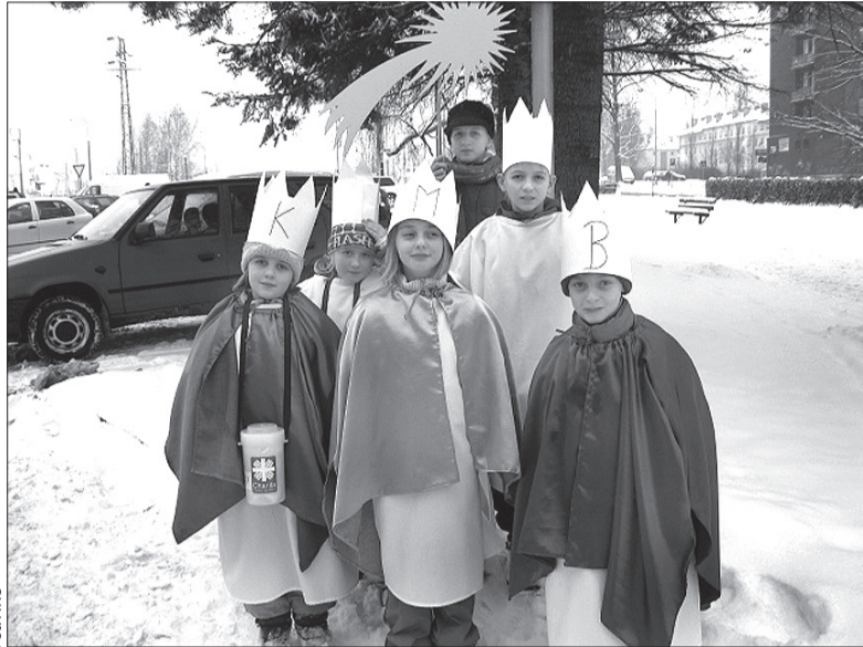
Wolontariusze „Charity” Trzynieć zbierali dary do skarbonek w Trzyniecu, Wędryni, Ropiczy, Bystřicy, Nydku i Trzyciezu.

W ramach całej diecezji ostrawsko-opawskiej uzbierano 10 mln koron, ale niektóre rejonowe organizacje „Charity” nie zdążyły jeszcze podliczyć pieniędzy. Pół miliona koron z diecezji trafi na pomoc ofiarom trzęsienia ziemi na Haiti. (dc)