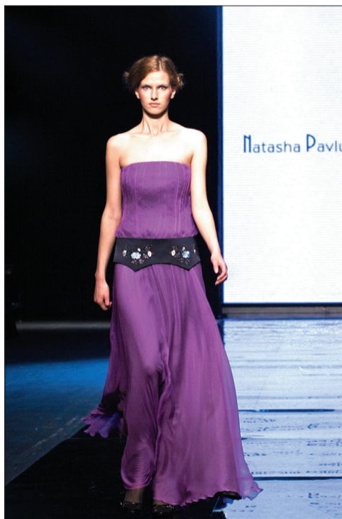
Kreacja balowa powinna być lekka i zwiewna.

Do wypożyczalni sukien wieczorowych nie przychodzą kobiety dlatego, że je nie stać. Niemniej mówiąc o plusach wypożyczonej kreacji, aspekt finansowy bez wątpienia odgrywa jedną z głównych ról. – Mam stałą grupę klientek, powiedziałabym, bardzo dobrze sytuowanych, które zamiast biegać po sklepach wolą przyjsć do mnie. Wie-