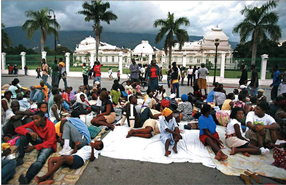
Mieszkańcy Haiti koczują na ulicach. W tle zniszczony budynek parlamentu.