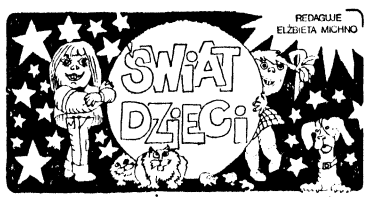
Redaguje ELŻBIETA MICHONO