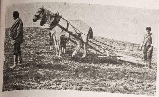
Siew i bronowanie