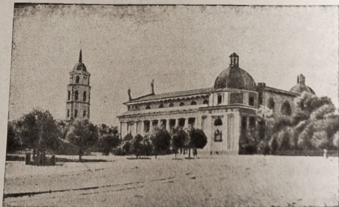
Katedra w Wilnie