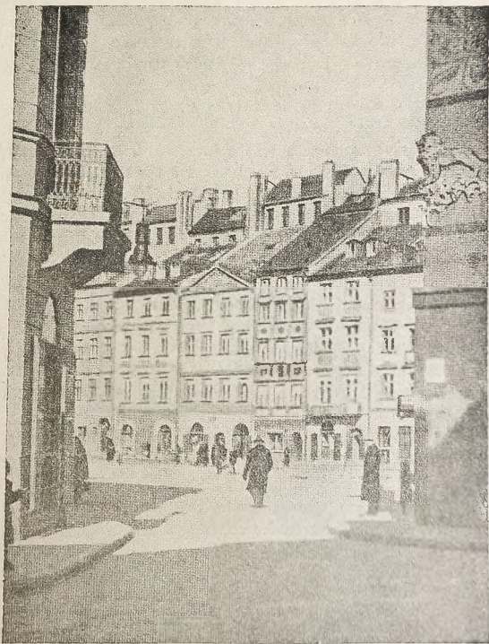
WARSZAWA STARE MIASTO

CZASOPISMO ZWIĄZKU HARCERSTWA POLSKIEGO NA WSCHODZIE