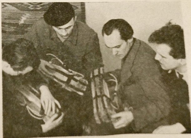
Żołnierze Armii Krajowej przygotowują miny

Od lat pięciu walczą one bez przerwy na oceanach i kontynentach w obronie wolności ludów, wierząc, iż jest to droga do odzyskania Ojczyzny całej i prawdziwie niepodległej.