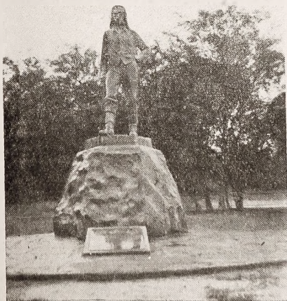
Pomnik Livingstone'a, odkrywcę wodospadów Wiktorii