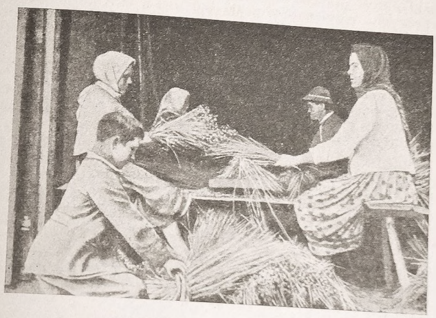
Praca przy Inie