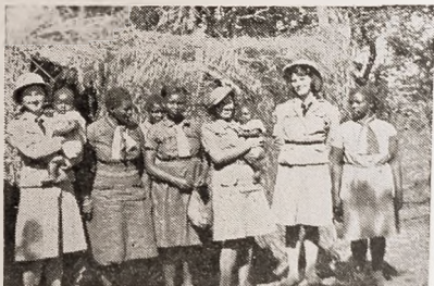
Nasze instruktorki i murzyńskie skautki na kursie w Chalimbane

Przecież połowa tych harcerek nosi na plecach, przywiązane sposobem murzyńskim, dzieciaki. Z za pleców wystają czarne głowy i błyskają białka oczu. Ale tymczasem nie mam czasu o nic się pytać, bo właśnie następuje oficjalne przywitanie. Komendantka kursu składa raport żonie Gubernatora Rodezji, która jest honorową przewodniczącą. Rozlegają się okrzyki, następnie parę przemówień i przegląd uszeregowanych zastępów, wreszcie goście zaczynają zwiedzać obóz.