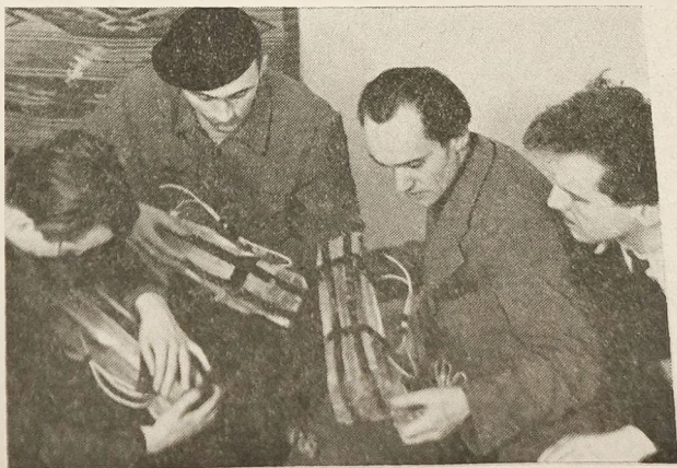
Żołnierze Armii Krajowej przygotowują miny

Od lat pięciu walczą one bez przerwy na oceanach i kontynentach w obronie wolności ludów, wierząc, iż jest to droga do odzyskania Ojczyzny całej i prawdziwie niepodległej.