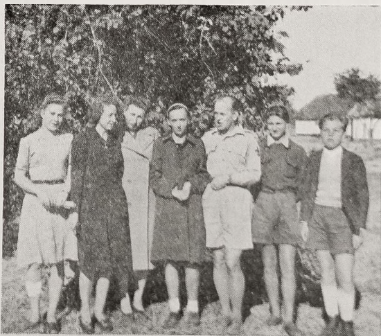
Kurs drużynowych w Lusaku

Dzięki inicjatywie ekipy instruktorskiej na Indie powstało Towarzystwo Przyjaciół Muzeum Polskiego, którego zadaniem jest gromadzenie materiałów do muzeum w Polsce.