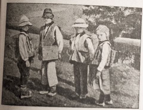
I dla nas zaczęła się praca...