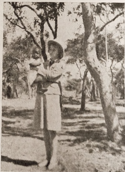
Nasza instruktorka z murzyniątkiem