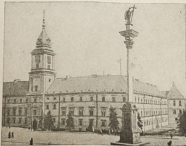
— za ruiny Warszawy...

Żołnierz polski jest, był i pozostać musi idealistą pełnym wiary, że prawda, sprawiedliwość i zasady moralne rządzić będą światem. Żołnierz bez ideałów stałby się tylko specjalistą w sztuce zabijania, sprzedającym swą duszę za żołąd i pełny garnek.“