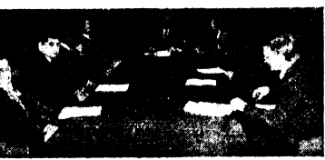
Na zdjęciu: delegacja polskich lekarzy oraz naczelny władz ZPW podczas spotkania z wiceministrem zdrowia rządu Ontario.