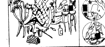
Wszystkie mi dotknęła i mamu i tato, i nową Krakowa myśli. Pójde sobie w świat.

— Nie. Ja tylko zastanawiałem się skąd zacznemy naszą wyprawę ku Krakowiu — powiedział Łosteros i cofnął się od barierki.