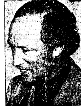
Wzrost popularności premiera Trudeau w ostatnich dniach lutego.

Niektórzy politycy z otoczenia premiera, a i z opozycji, zaczęli wręczyć wczoraj w trybie sżętkie ze do rozegrania kolejnej batalii wyborczej. Ostatecznie niezaradne badania opinii publicznej "McKinnon" wykazywały ostatnio spory i stały wzrost popularności premiera. Liczył się swadowne "niepetyzacje" w pogoni za odwróceniem i stał się objęty, z kazyim miesiącem odwołaniem na straty do prowadzącego lidera Konserwatywów. Wreszcie inne badania, przeprowadzone dla Global Tele-